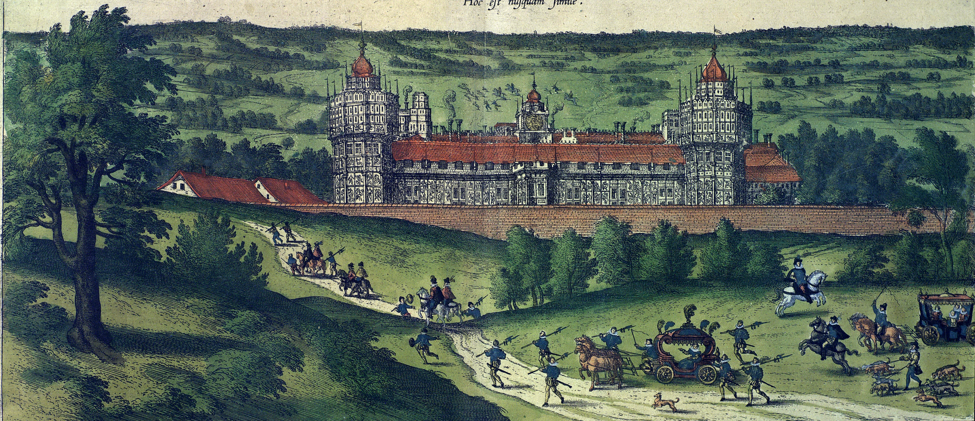
Effiguit Georgius Houfnaglus Anno 1582.

PALATIUM REGIVM IN ANGLIÆ REGNO APPELLATVM NONCIVTZ, Hoc est nusquam simile.