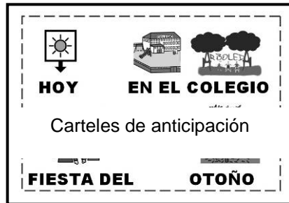
Carteles de anticipación