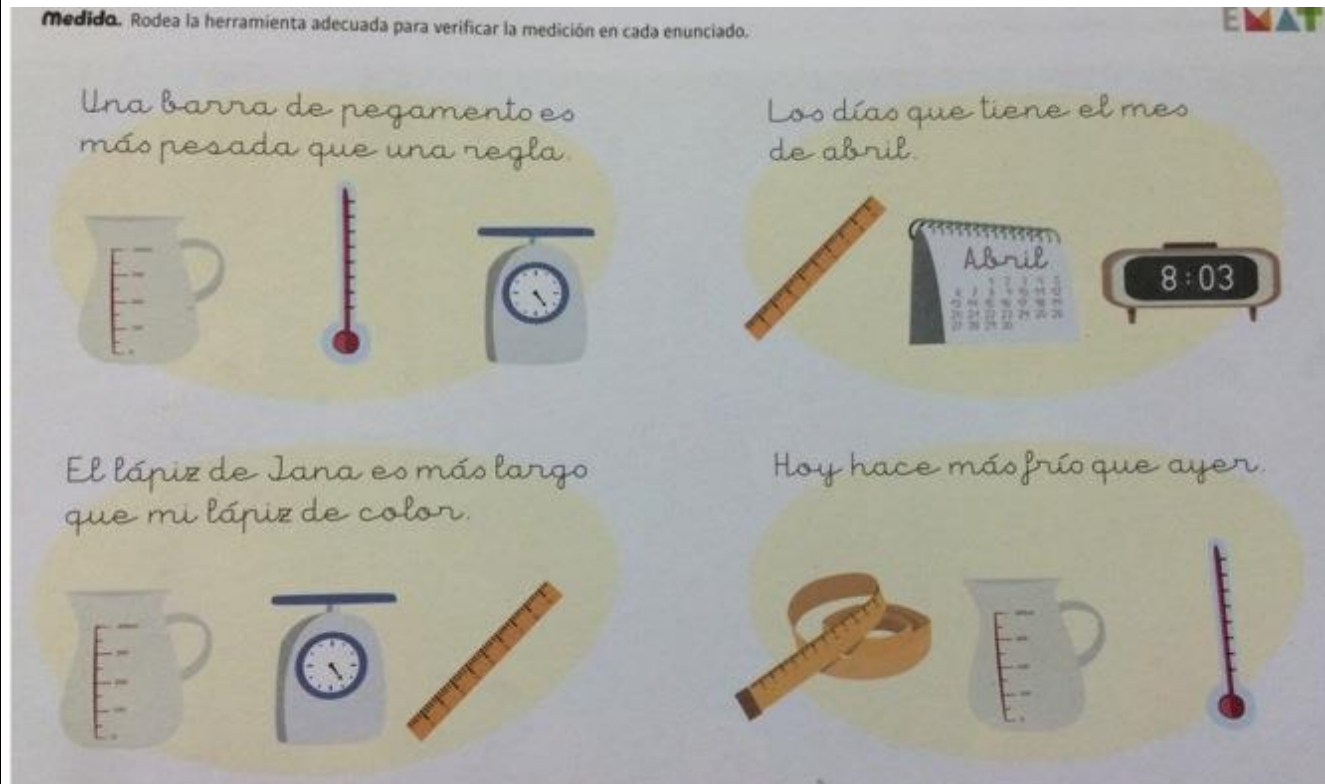
Foto de la ficha