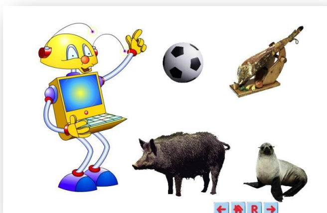
imagen se muestra al robot preguntando qué imagen contiene la letra “j”.

“ Aprende a leer con Alex ”, este recurso web con más de 300 juegos, presenta tres opciones permitiendo elegir entre letra mayúscula, minúscula o manuscrita. Con las aventuras del robot Alex J-7 y sus amigos, se descubrirá de forma divertida el mundo de las letras y el gusto por la lectura mediante el uso de las nuevas tecnologías. En la