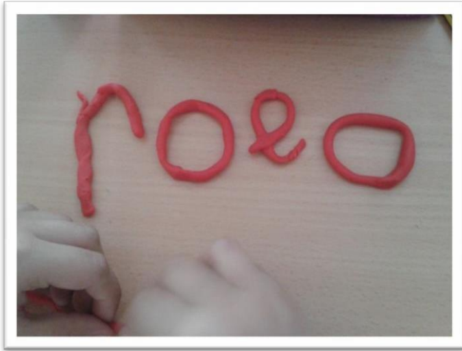
“Seguimos las instrucciones”