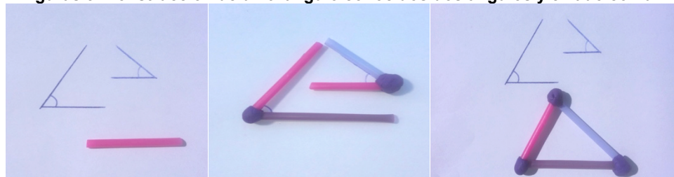
Figuras 3. Construcción de un triángulo conocidos dos ángulos y el lado común