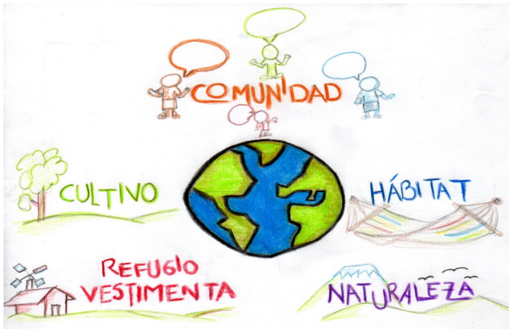
Ilustración 4. Metabolismo de las NMV con el planeta tierra

En un planeta finito como este, la apropiación de él como cuerpo inorgánico de una NMV desprovee a otra u otras NMV del suyo, es decir, al ser el metabolismo del cuerpo inorgánico el conjunto de procesos de satisfacción de las necesidades humanas y en especial las NMV, si una de ellas es sobre-satisfecha , el planeta sufre un desequilibrio estructural y exponencial que se refleja en las desigualdades sociales, o en el peor de los casos, muerte de seres humanos. En estos terminos, no solo hablamos de unidad del ser humano con la naturaleza, sino de las formas en que el proceso histórico de la actividad vital del trabajo ha modificado, roto y desequilibrado ese metabolismo con la naturaleza. La satisfacción del subconjunto de NMV requiere la obtención de los satisfactores a esas necesidades que preservan la vida de los humanos, a saber, “ existe relación causal entre la muerte de seres humanos por la insatisfacción de necesidades mínimas vitales y nuestra interacción metabólica con el planeta tierra mediante el trabajo como actividad vital ”; y por tanto, dejando de lado toda institución humana que permita el intercambio de satisfactores de las necesidades entre humanos, la única fuente de satisfactores a esas NMV es el planeta tierra y la forma de obtener esos satisfactores es mediante nuestra actividad vital, el trabajo. Esto reconfigura la propuesta colocando al planeta tierra en el