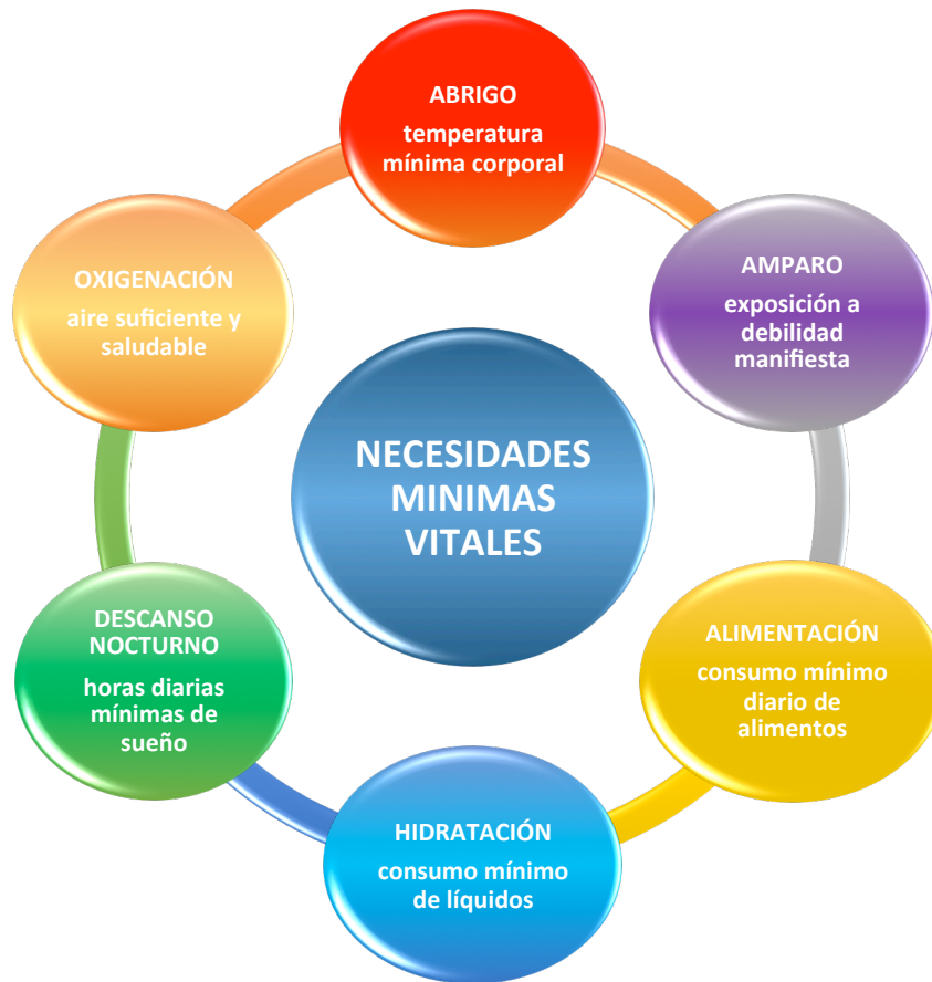
Ilustración 1. Necesidades Mínimas Vitales

Es preciso aclarar que todas las NMV , se postulan como un subconjunto garantes de la vida y por tanto de las necesidades humanas , es decir, son su preámbulo.