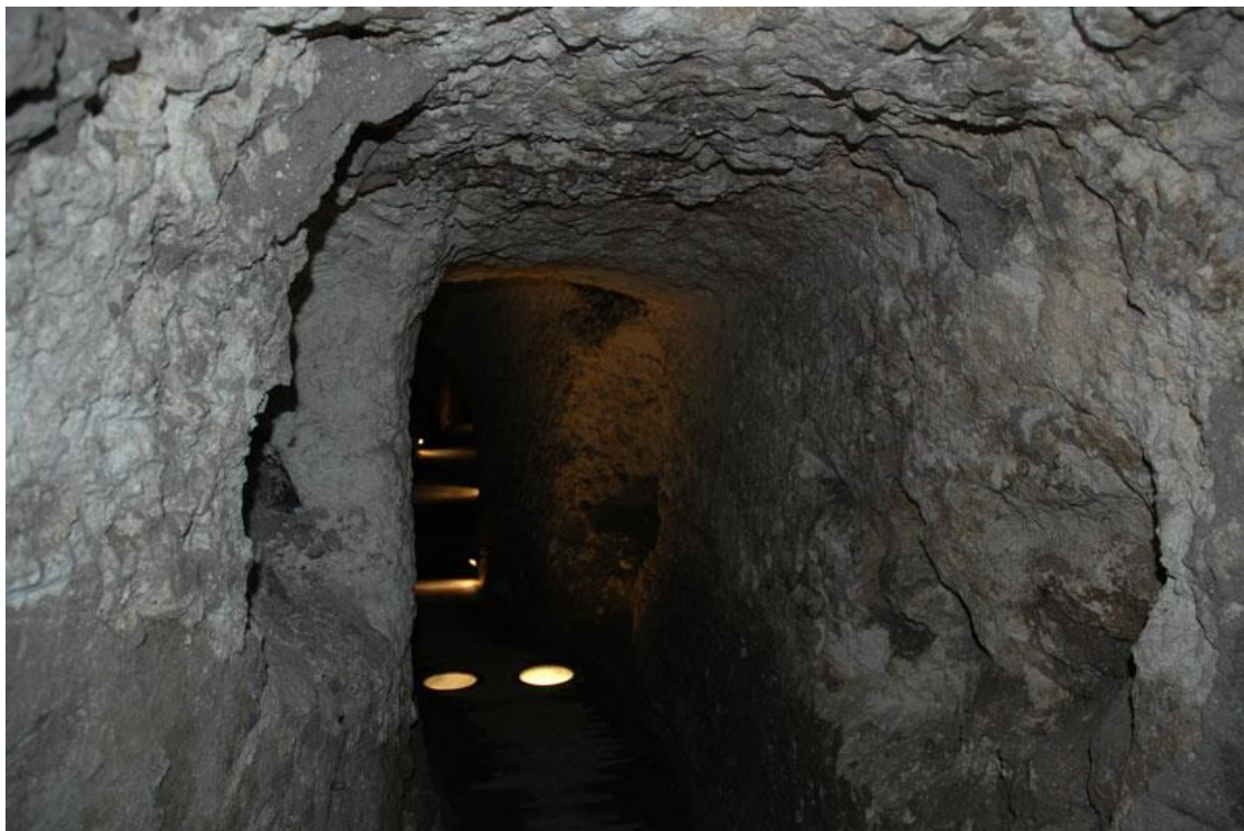
Ilustración 04. Galería del Baluarte de San José Bajo. Interior.