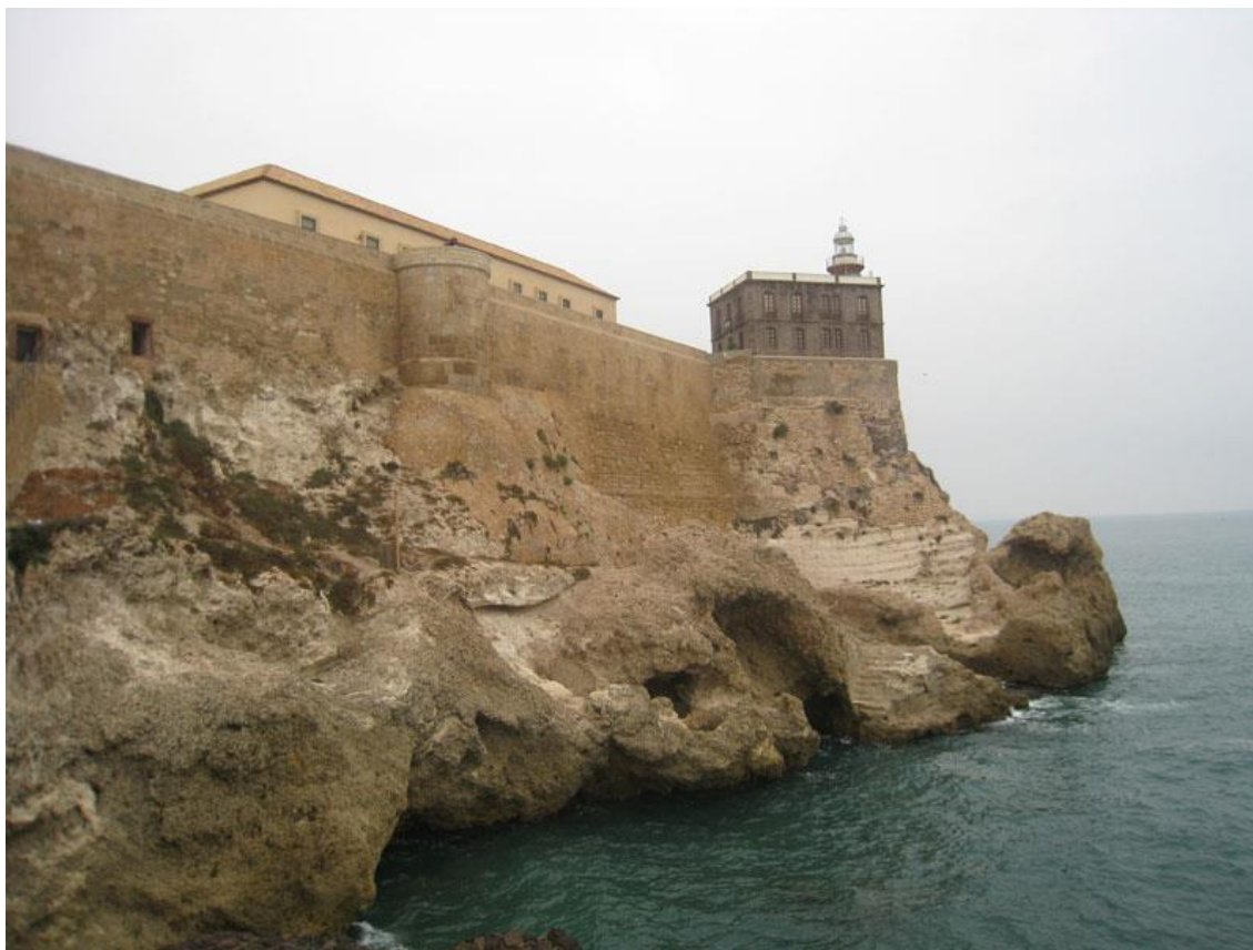
Ilustración 01. Faro de Melilla la Vieja. Sede Social de la Fundación. Exterior.