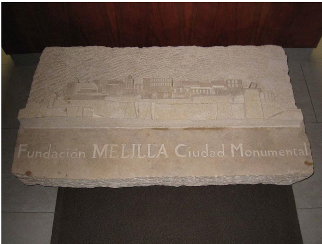
Ilustración 02. Fundación Melilla Ciudad Monumental. Lápida logotipo.