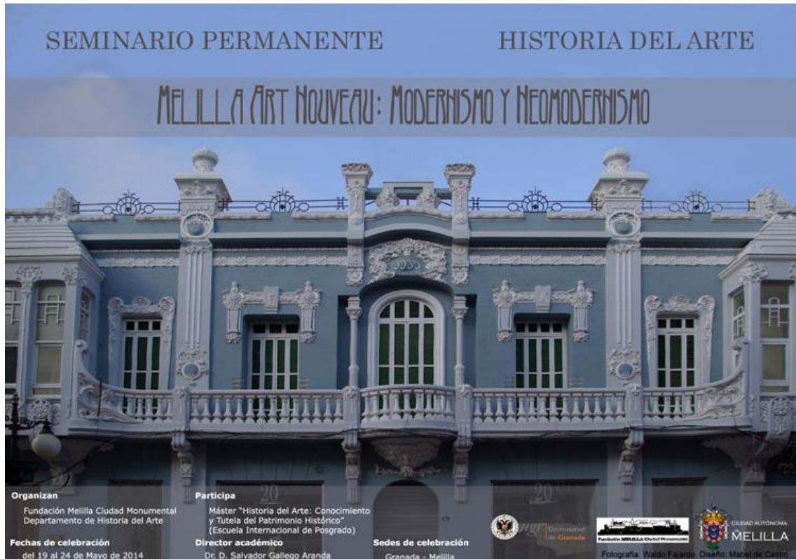
Ilustración 06. “Seminario Melilla Art Nouveau, 2014”. Cartel (Waldo Fajardo y Mabel de Castro, 2014).

(desde 2012) y Jornada “El legado patrimonial europeo en la ciudad de Melilla/ UGR” (desde 2013), que comienzan a ser fijas en su anual “Plan de Actuaciones” 63 .