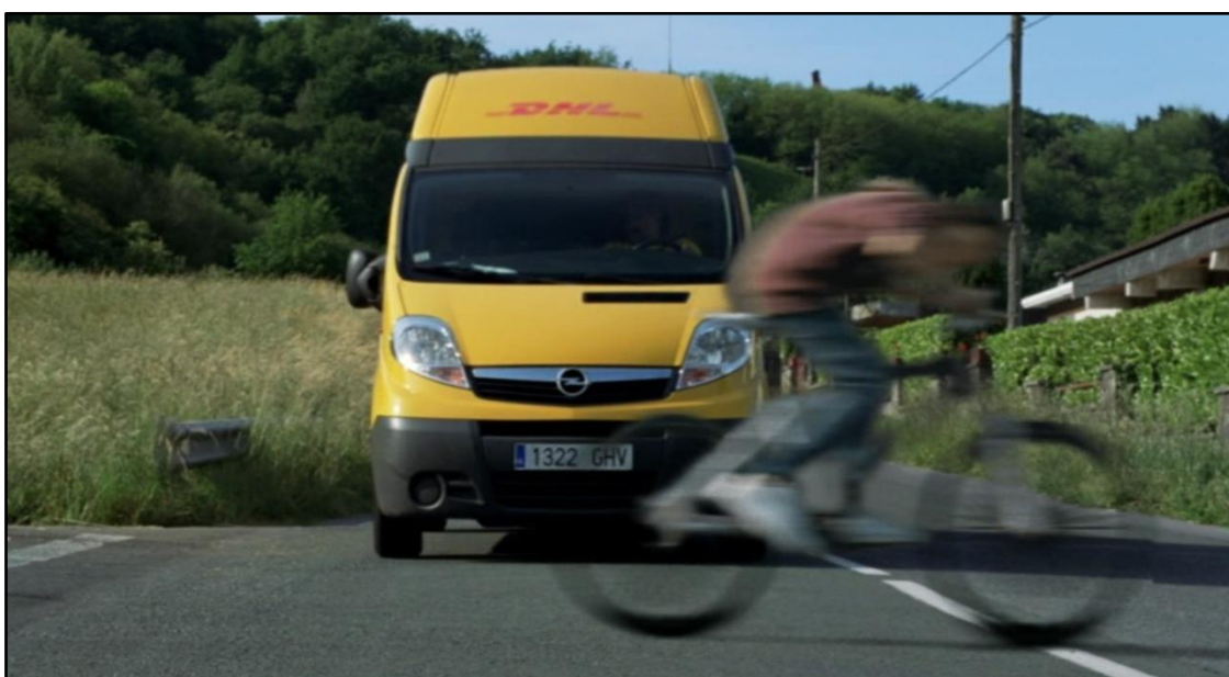
Situación de peligro: John a punto de ser atropellado por un coche.