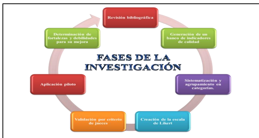
Figura1. Fases de la investigación (elaboración propia)

Tal revisión bibliográfica, ha permitido generar un banco de noventa indicadores sobre los cuales se ha elaborado, tras su sistematización, el instrumento de medición. Para ello se categorizaron los distintos indicadores, cuya procedencia está verificada en la revisión bibliográfica, creándose un cuestionario con el formato de escala tipo Likert. En el proceso de validación de esta escala han colaborado el director de este TGF y la citada investigadora del ministerio. Finalmente, se ha aplicado tal escala, de forma piloto, a las secuencias clave de un film para verificar la funcionalidad de dicha escala y determinar sus debilidades, para la posterior elaboración de una versión mejorada.