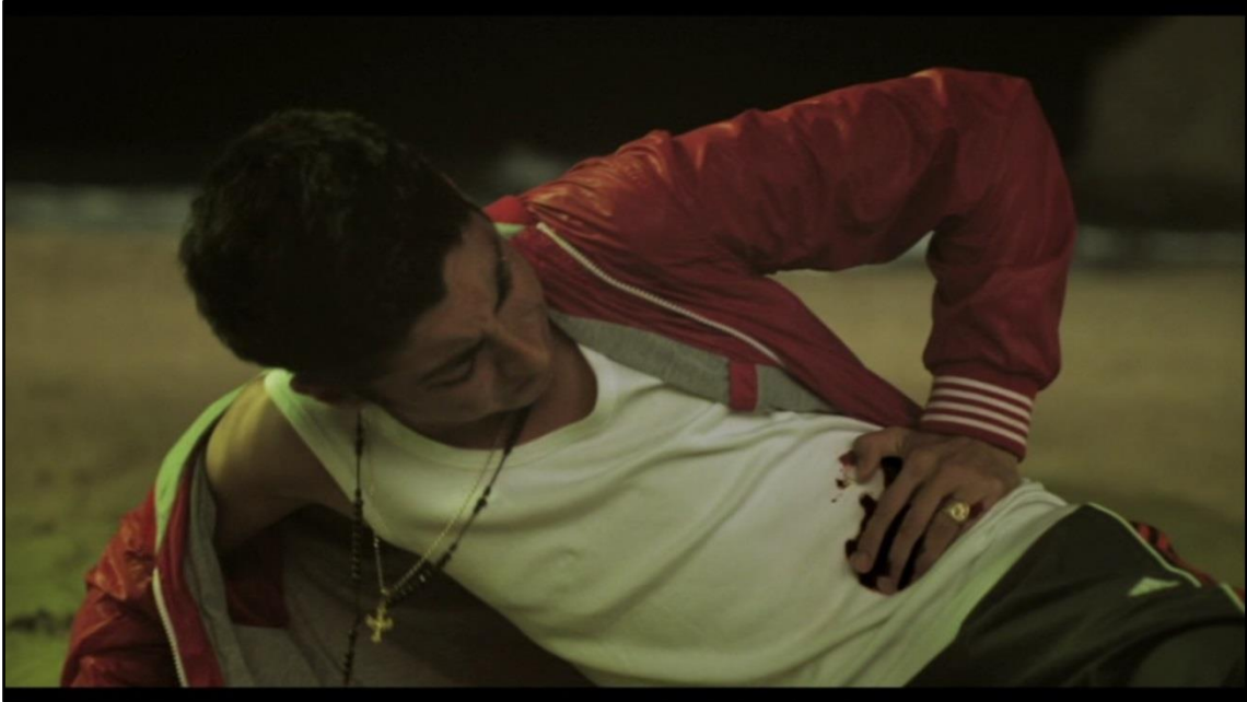
Nelson apuñalado en la barriga.