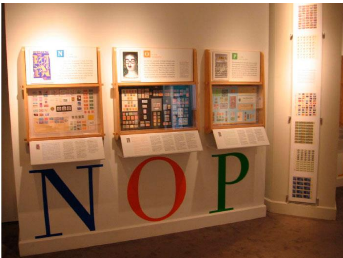
Ilustración 06. Exposición temporal Every Stamp Tells a Story .

El museo cuenta con un premio para ciudadanos de cualquier nacionalidad -el Smithsonian Philatelic Achievement Award- que distingue los logros de coleccionistas comprometidos con la filatelia. 14