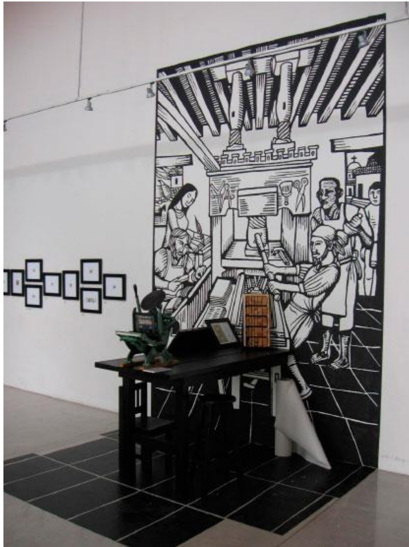
Ilustración 10. Sala Mayor del Museo de Filatelia de Oaxaca.

Un pasillo techado conduce a la bella biblioteca José Lorenzo Cossío y Cosío con seis mil ejemplares manuscritos e impresos. Cossío (ciudad de México 1902-1975), reunió su colección a lo largo de 50 años. El Fondo Cossío, especializado en filatelia, también está abierto al público general de manera gratuita.