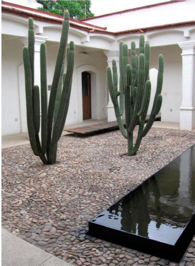
Ilustración 07. Patio interior del Museo de Filatelia de Oaxaca.

Sin embargo, la restauración de López Salgado también integra en el museo valores de la arquitectura moderna, como los diseños geométricos minimalistas en algunos muros de los jardines. Hay una limpieza luminosa y aséptica en las salas de exhibición.