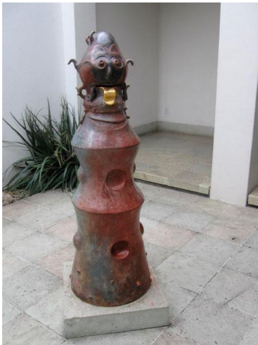
Ilustración 09. Escultura Los comeartas , de José Luis García (2007). Fotografía: FLR.

Junto al primer patio, se encuentra la Sala Mayor, con menos de 40 metros cuadrados: un espacio de exposiciones temporales basadas en temáticas específicas de las emisiones postales. La Sala Mayor suele enmarcar las estampillas expuestas, además de que hay elementos museográficos que contextualizan el tema elegido: pinturas o diagramas murales, carteles, peanas con libros y documentos, objetos y mecanismos varios.