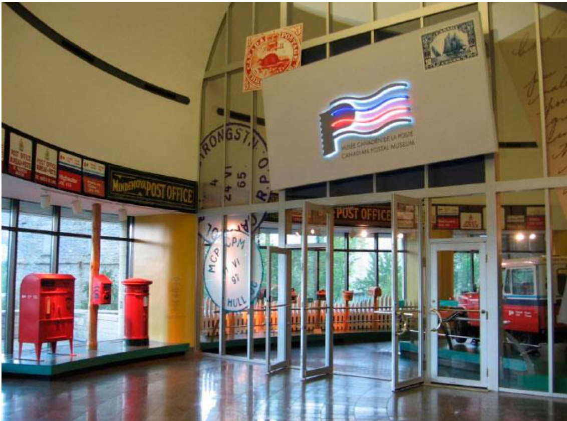
Ilustración 02. Vestíbulo del Canadian Postal Museum de Gatineau.

Elementos museográficos de gran escala emulaban estampillas y sellos postales sobre la puerta del vestíbulo principal; la imagen institucional del museo se delineaba con tubos fluorescentes sobre una plataforma que simulaba una carta gigante. La señalética y las cédulas estaban redactadas en inglés y en francés.