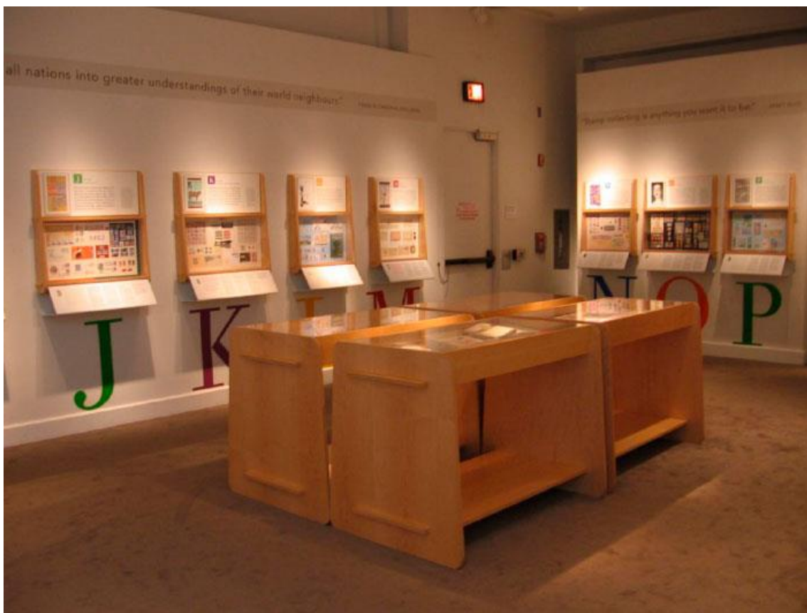
Ilustración 05. Sala de exposiciones temporales del National Postal Museum.

La exposición temporal Alphabetilately: Every Stamp Tells a Story celebra los primeros quince años de existencia del Smithsonian National Postal Museum. Se analizará más adelante este trabajo.