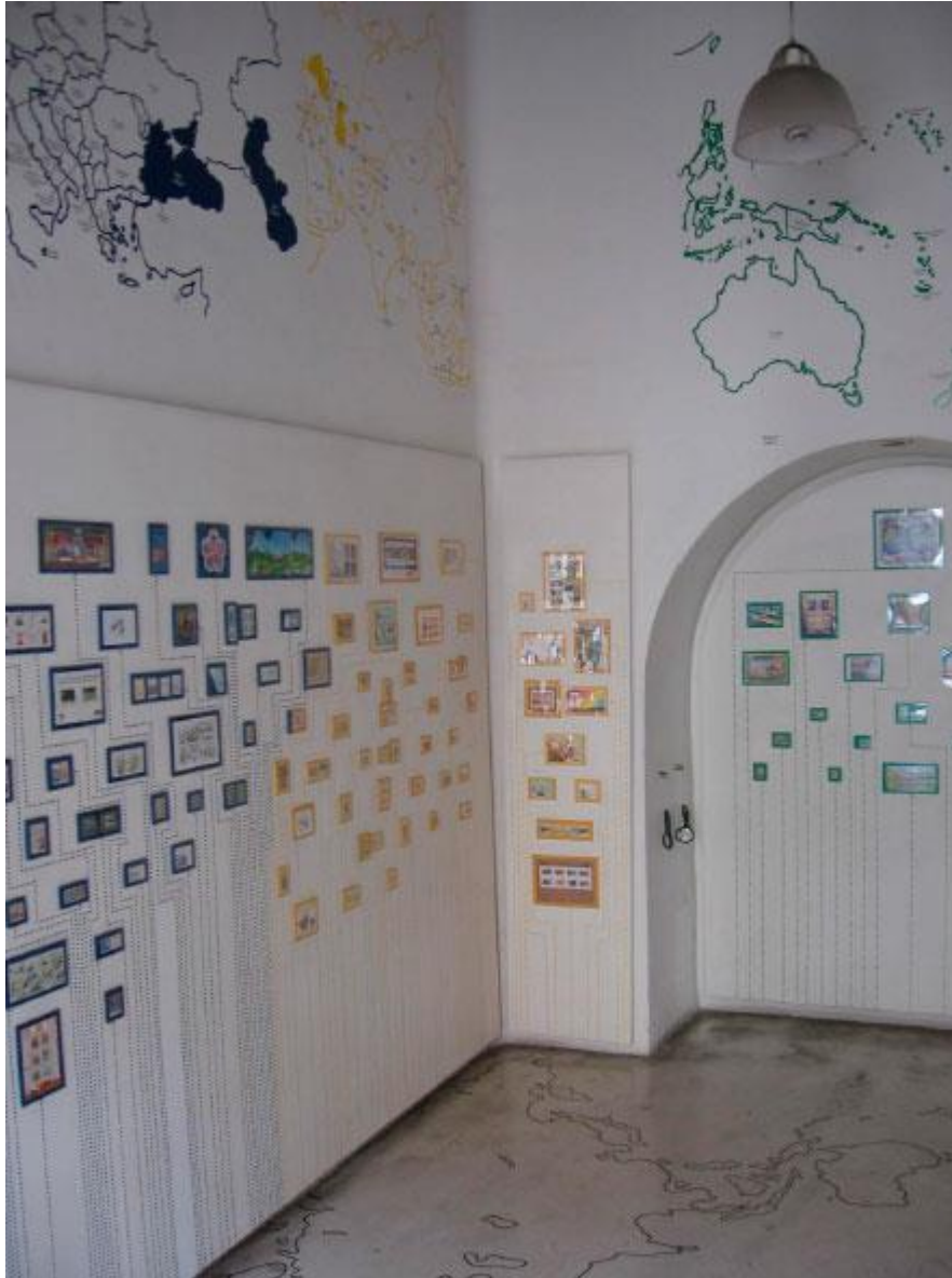
Ilustración 08. Sala de Exploración del Museo de Filatelia de Oaxaca.

Los pisos con pulido de cemento en interiores y los sencillos dispositivos de iluminación -siempre visibles y separados de la estructura arquitectónica- conviven con el vidrio templado y traslúcido de las ventanas clausuradas, circunstancia que favorece la iluminación natural de los espacios.