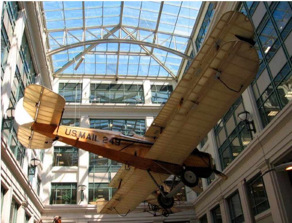
Ilustración 04. Exposición permanente del National Postal Museum de Washington, dc.

El público ingresa al museo gracias a un vestíbulo monumental; unas escaleras eléctricas descienden hasta la planta baja del patio. El primer espacio expositivo del National Postal Museum está dedicado a la historia postal de los Estados Unidos. Es el espacio central del museo: un espléndido patio techado ilumina los cinco pisos del edificio postal.