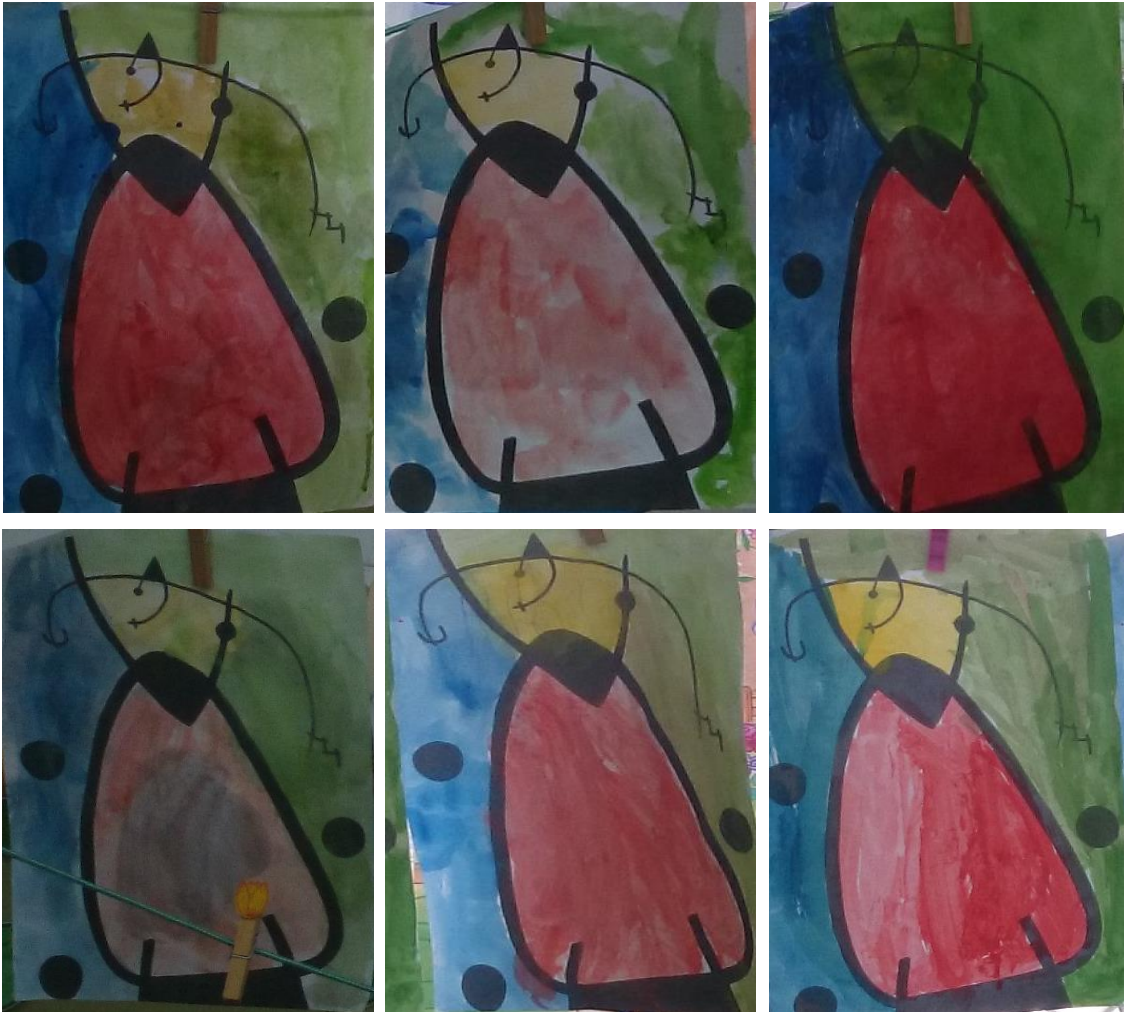
Rodríguez. J (2014). Acuarelas DinA-4. Serie muestra de 6 dibujos realizados por niños/as de 4/5 años de E.Infantil.

Con la realización de esta primera actividad con la técnica del pintado con acuarelas, se pudo ver cómo asombrados experimentaban con ese material que para muchos era su primer contacto básicamente. Todos quisieron pintar con los utensilios nuevos y crear la obra del artista trabajado. En estas podemos ver que todos cuadros son iguales en cuanto forma y estructura del cuadro, simplemente cambia el color de las pinturas ya que unas tienen un tono más claro y otras más oscuro.