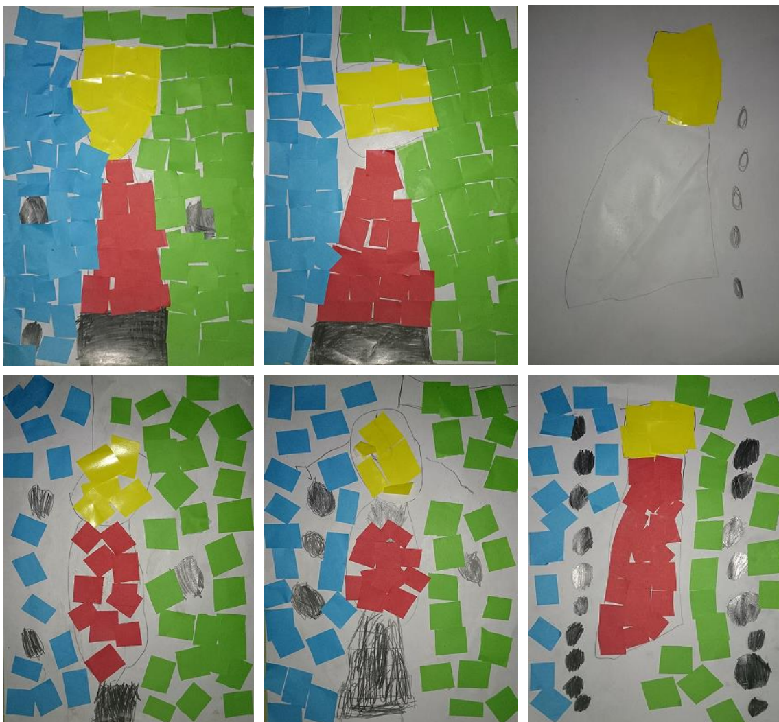
Rodríguez, J (2014). Collage DinA-4. Serie muestra de 6 dibujos realizados por niños/as de 4/5 años de E.Infantil

En estas imágenes vemos las obras realizadas a partir de trocitos de papel. En ellas podemos ver como todas son distintas en cuanto a la composición del cuadro. Son distintas también en cuanto al número de puntitos negros dibujados. Algunos/as han optado por no poner ni uno, mientras otros/as han puesto los que han visto oportuno. Todos/as la ha realizado como han querido y en el resultado se observa la creatividad de los/as participantes. No obstante podemos apreciar alguna similitud entre alguna de las obras. Si nos fijamos todas las imágenes tienen forma circular en cuanto al color amarillo. Las tres primeras imágenes, tienen forma de trapecio en cuanto al color rojo, y las tres imágenes restantes, el color rojo tiene una forma más bien ovalada.