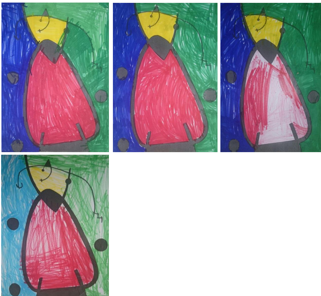
Rodríguez, J (2014). Rotulador 13x21cm. Serie muestra de 4 dibujos realizados por niños/as de 4/5 años de E.Infantil

En estas imágenes podemos ver el dibujo de 4 participantes que han realizado la obra de Joan Miró. En esta ocasión eligiendo como herramienta de trabajo el rotulador. Si nos fijamos en los dibujos todos son iguales en cuanto a forma del objeto ya que estos están realizados a partir de la plantilla de la obra. No obstante podemos ver diferencias en cada uno de ellos. Todos tienen un control distinto en la utilización del rotulador y hace que ya sean distintas unas a las otras. Pero quizá la diferencia más clara es que en tres de los dibujos han optado por coger el rotulador azul oscuro y verde oscuro para pintar su cuadro, y por el contrario uno/a se ha decantado por el color azul claro y el verde claro para pintar su obra.