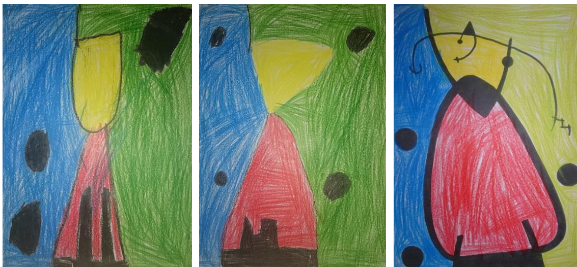
Rodríguez. J. (2014), Ceras DinA-4. Serie muestra de 3 dibujos realizados por niños/as de 4/5 años de E. Infantil.

Las ceras al ser la herramienta de trabajo más utilizada en este caso en el aula de Infantil de 4 y 5 años, se puede extraer como conclusión, que es la técnica más adecuada para expresar un mayor control en el desarrollo de la motricidad fina. Tanto en las obras realizadas sin plantilla y con plantilla mediante las ceras, se puede ver el gran dominio que tienen sobre este material, mostrándose más seguros a la hora de realizar los dibujos.