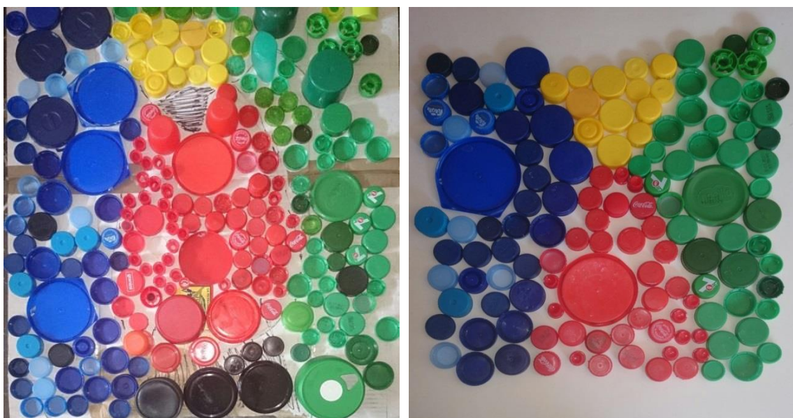
Rodríguez, J (2014). Collage tapones. Serie muestra de 2 dibujos realizados por niños/as de 4/5 años de E.Infantil

El collage de la primera imagen, está realizado a partir de un dibujo en un trozo grande de cartón, haciendo de plantilla para que los niños y niñas sepan dónde han de colocar cada tapón siguiendo un orden. En la imagen, se puede ver una copia del cuadro de “el comienzo del día” realizado por los niños y niñas pero siguiendo las indicaciones del docente, sin dejar libremente a los niños y niñas realizar ésta.