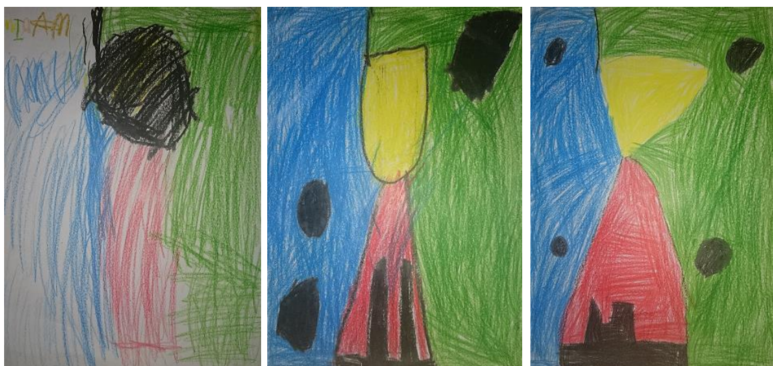
Rodríguez, J (2014). Ceras DinA-4. Serie muestra de 3 dibujos realizados por niños/as de 4/5 años de E.Infantil

En esta ocasión, vemos tres reproducciones de la obra trabajada, realizada con ceras finas. Si nos centramos en las similitudes que hay entre las tres imágenes, sólo podemos extraer los colores utilizados. Por lo demás son todo diferencias.