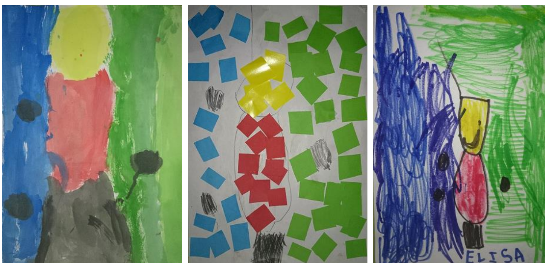
Rodríguez, J (2014). Comparaciones. Serie muestra de 3 dibujos realizados por niños/as de 4/5 años de E.Infantil

En estas imágenes se ven dos obras realizadas con distintos materiales pero parecen seguir el mismo patrón. Las figuras están compuestas a partir de dos triángulos y hace parecer que las haya realizado la misma persona.