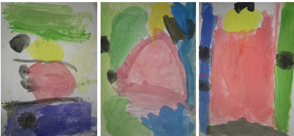
Rodríguez. J. (2014), Acuarelas DinA-4. Serie muestra de 3 dibujos realizados por niños/as de 4/5 años de E. Infantil.