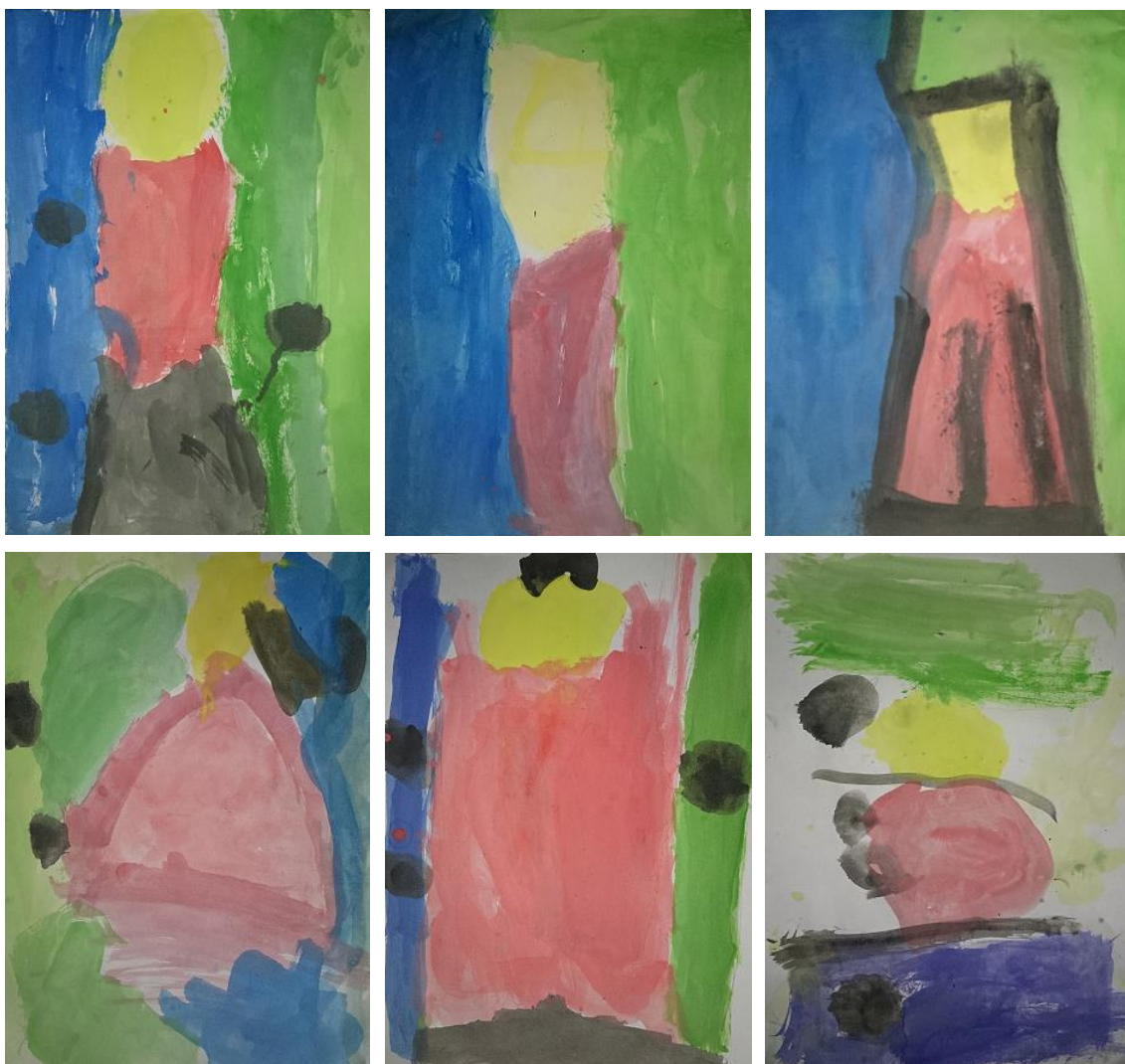
Rodríguez, J (2014). Acuarelas DinA-4. Serie muestra de 6 dibujos realizados por niños/as de 4/5 años de E.Infantil

En esta imagen podemos ver como los siguientes alumnos/as han realizado su propia obra inspirada en el cuadro del artista. Cada uno de la forma que ve la obra, sin plantillas ni pautas. Si nos fijamos en ellas podemos apreciar como todas son distintas, sólo tienen en común los colores de la obra.