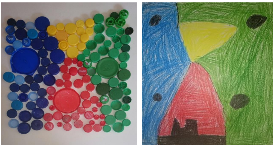
Rodríguez, J (2014). Comparaciones. Serie muestra de 2 dibujos realizados por niños/as de 4/5 años de E.Infantil

En estas imágenes se ven dos obras realizadas con distintos materiales pero parecen seguir el mismo patrón. Las figuras están compuestas a partir de dos triángulos y hace parecer que las haya realizado la misma persona.