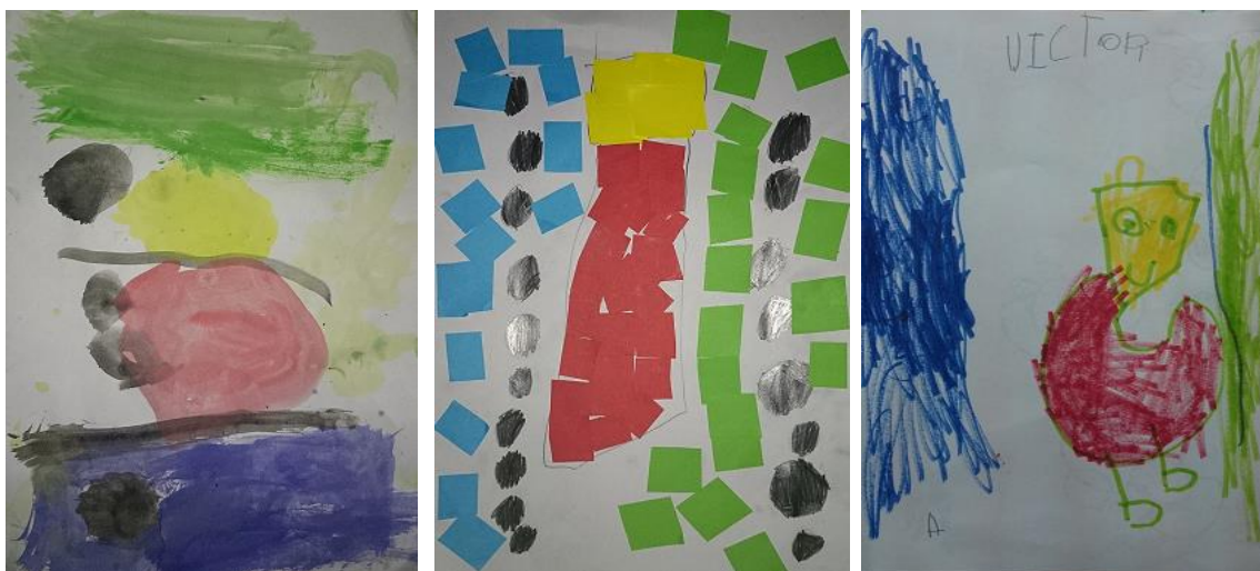
Rodríguez, J (2014). Detalles creativos. Serie muestra de 3 dibujos realizados por niños/as de 4/5 años de E.Infantil

Si nos fijamos en los resultados de las tres imágenes, podemos ver que cada una de ellas es totalmente distinta en cuanto a composición.