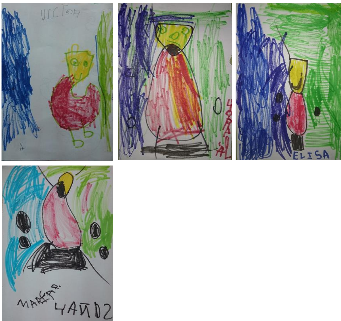
Rodríguez, J (2014). Rotulador 13x21cm. Serie muestra de 4 dibujos realizados por niños/as de 4/5 años de E.Infantil

Si observamos las siguientes imágenes, podemos ver otros cuatro dibujos realizados con rotulador por niños y niñas, pero esta vez hechos completamente con total libertad sin ningún tipo de plantilla. Si nos fijamos en los dibujos, vemos que tienen en común los colores característicos de la obra trabajada pero cada uno de ellos es totalmente distinto en cuanto a su composición. También tres de ellos tienen en común y es una de las cosas que llama más la atención, la realización de ojos y boca en la parte superior del dibujo dentro de la figura amarilla.