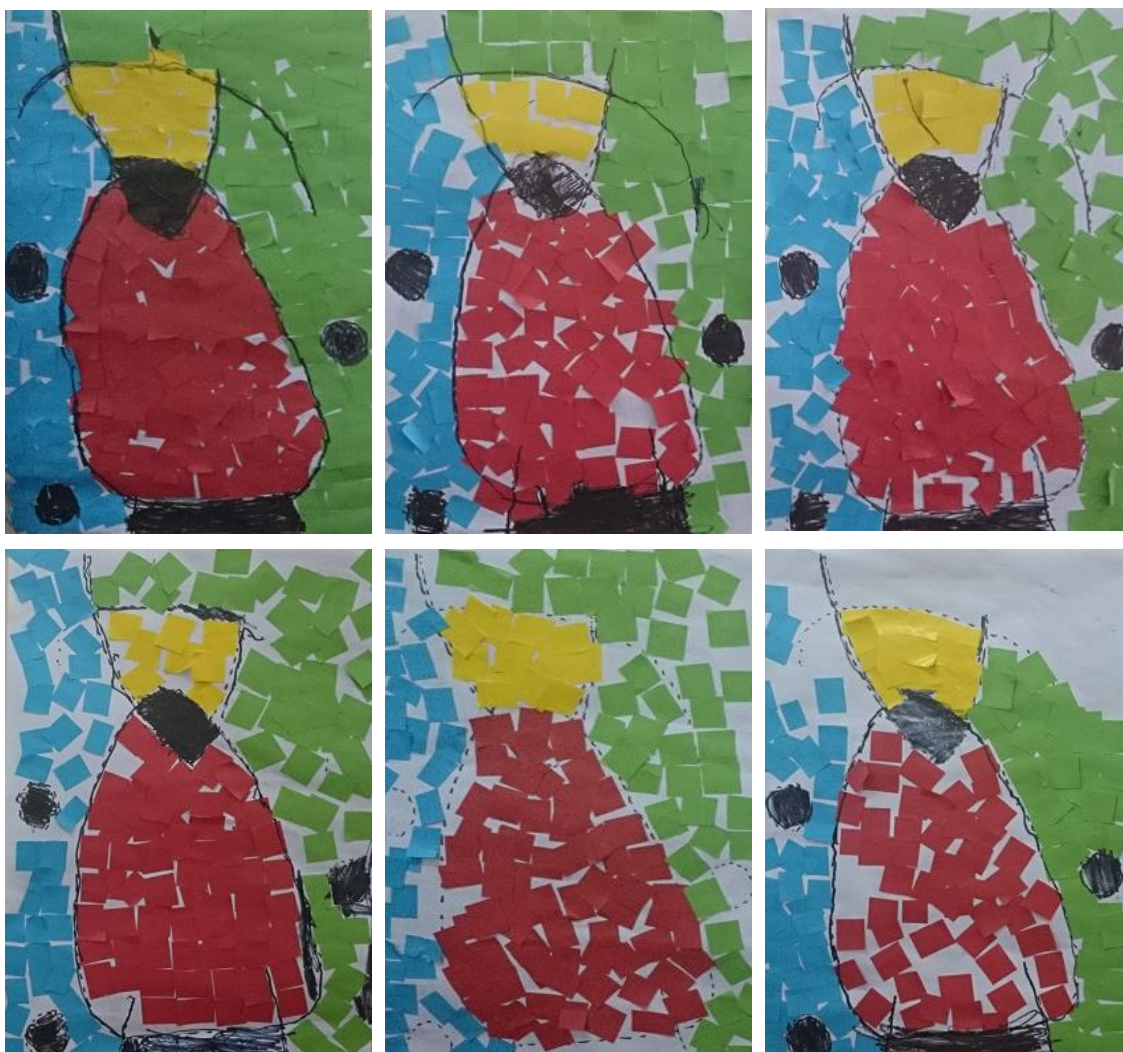
Rodríguez. J (2014). Collage DinA-3. Serie muestra de 6 dibujos realizados por niños/as de 4/5 años de E.Infantil

Con la realización de la actividad del collage en folio Dina-3, niños y niñas fueron pegando los papeles de colores formando así el collage del comienzo del día. En las imágenes podemos ver como los puntitos que forman la estructura de la obra limitan dónde empieza y acaba el color de cada papel, y hace que sean iguales todas ellas en la forma. La diferencia que podemos ver en estas, es el número de papeles pegados y la separación entre estos. En alguna imagen vemos papeles muy juntos casi sin dejar espacio y en otras se evidencia la separación de estos. También podemos diferenciar entre obras, los detalles con el rotulador. En unas se ha reseguído la figura con el rotulador y otras no han realizado ni los puntos negros de la obra.