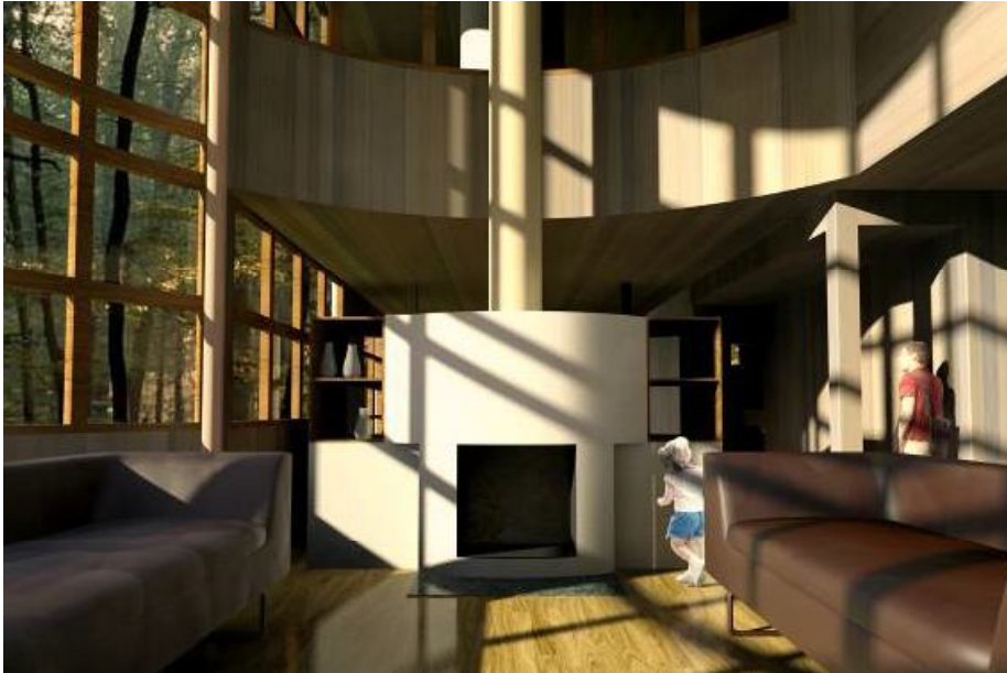
Fig 2. Casa Garey. (Gwathmey, Siergel y asociados). Vista del espacio a doble altura del salón.