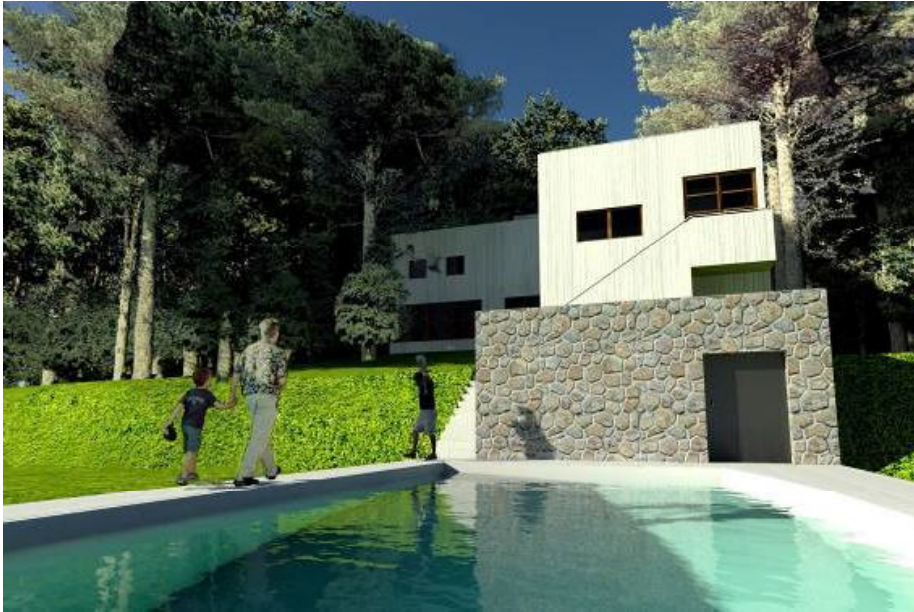
Fig 1. Casa Garey (Gwathmey, Siergel y asociados). Vista del entorno desde la piscina.

conscientes de otros factores que definen arquitectura.