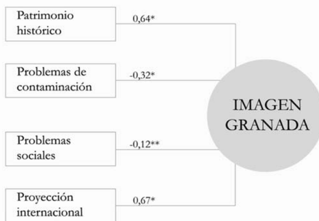
FIGURA 2. MODELO DE FORMACIÓN DE LA IMAGEN DE CIUDAD RESULTANTE (PARÁMETROS ESTANDARIZADOS)