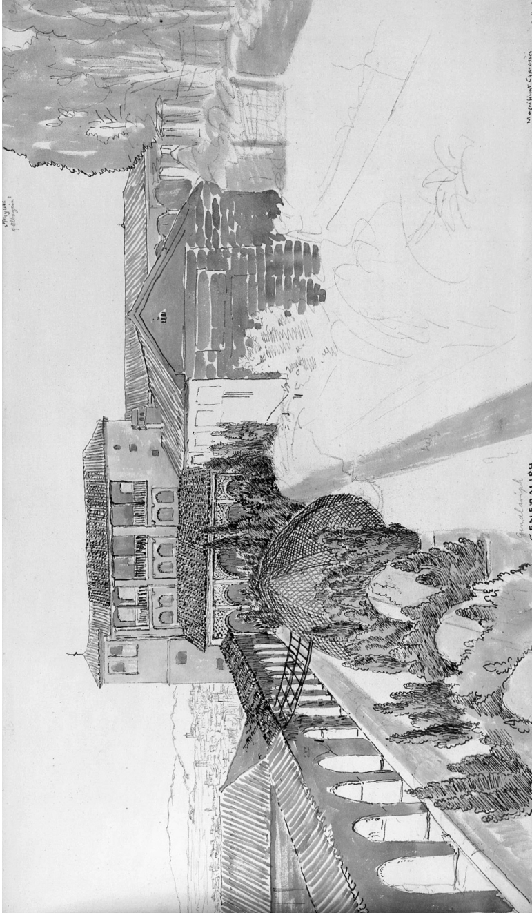
Figura 2: Vista del patio de la Acequia hacia el pórtico norte, William Gell, hacia 1801-1806.