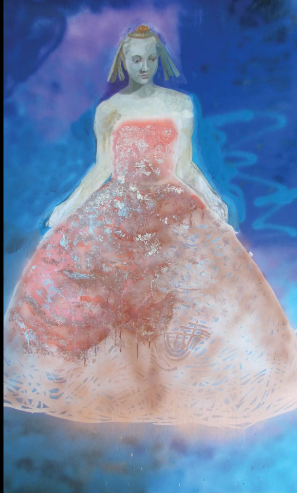
MODELO DE PORCELANA // 206x122 cm // Pintura de Spray industrial y óleo sobre tabla // 2005

Como en un surtido de recortes y troqueles, la pintura uniforme la caricia y viste los cuerpos con ofertas inesperadas y asombrosas. El recorte metálico de tules, rasos y sedas entabla un recreo caprichoso con los rostros bordados y prolijamente sugeridos. Se propone una pintura que tambalea las referencias culturales y artísticas, confundiendo las orto-