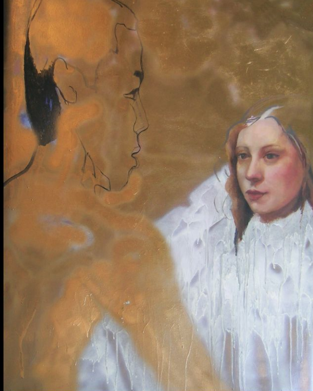
ENCUENTRO DURADO I // 120x110 cm // Pintura de Spray industrial y óleo sobre tabla // 2004