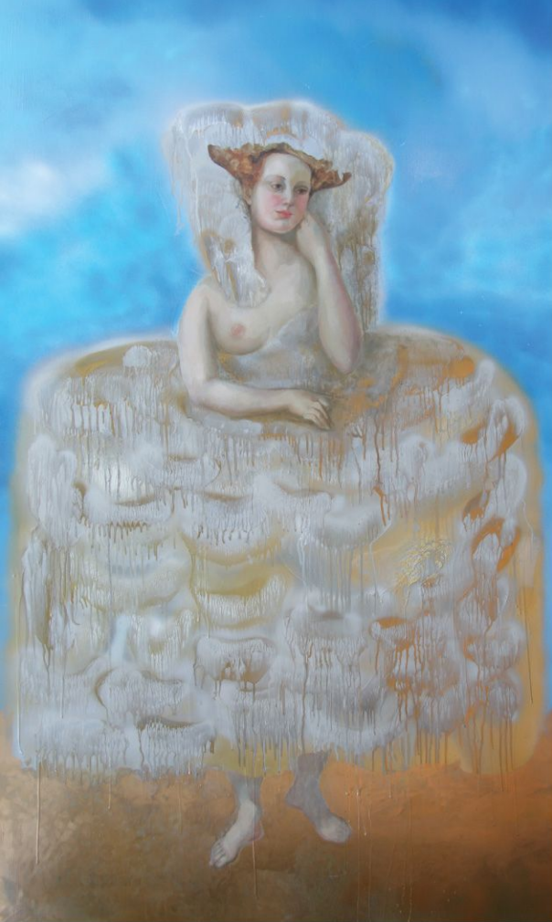
○ EVA MÉNDEZ // 201x122 cm // Pintura de Spray Industrial y Aliso sobre tabla // 2004

nales. Este desfile de telas sugeridas conduce al encuentro con una moda lírica y golosa. En los lienzos asoman representaciones donde están presentes el texto romántico, el más prolijo retrato inglés, el sosiego del rostro renacentista, el grafiti insolente y los lacados esplendorosos de las carrocerías metálicas... miradas fronterizas entre el hechizo y la paradoja.