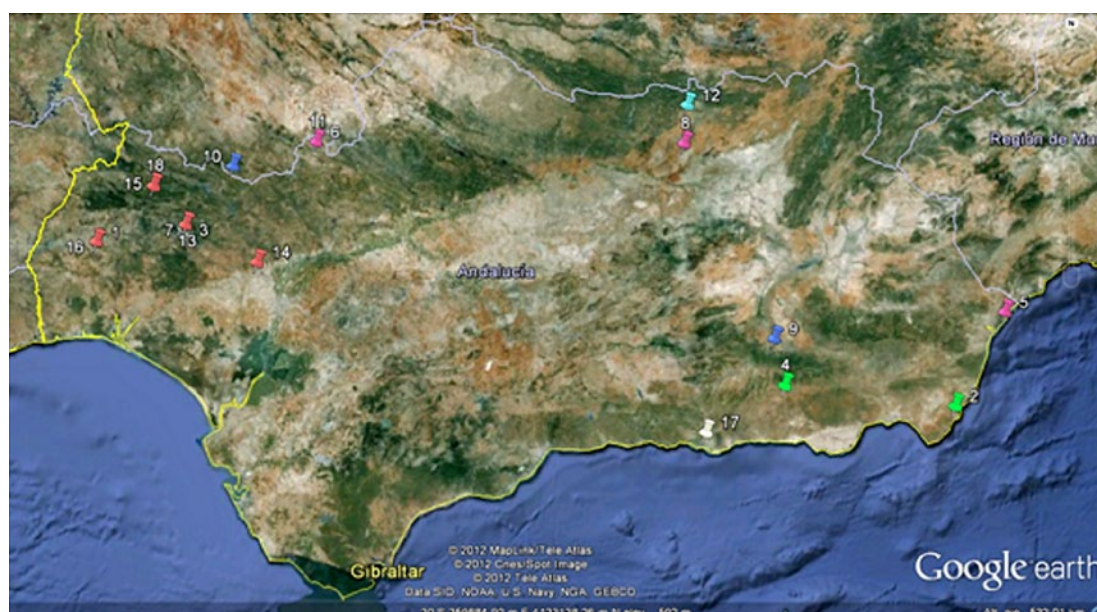
Fig. 2. Captura de imagen de Google Earth en el que se han ubicado diferentes indicios mineros de Andalucía, asignando un color diferente según el metal que se extrae (verde: oro; rosa: plata; azul: hierro; celeste: plomo; rojo: cobre; blanco: zinc) y un número a cada uno de ellos para facilitar su localización (1: Tharsis, Huelva; 2: Rodalquilar, Almería; 3: Riotinto, Huelva; 4: Ugijar, Granada; 5: Sierra Almagrera, Almería; 6: Guadalcanal, Sevilla; 7: Riotinto, Huelva; 8: Linares, Jaén; 9: Alquife, Granada; 10: Cala, Huelva; 11: Guadalcanal, Sevilla; 12: Linares, Jaén; 13: Riotinto, Huelva; 14: Gerena, Sevilla; 15: Almonaster la real, Huelva; 16: Tharsis, Huelva; 17: Motril, Granada; 18: Almonaster la Real, Huelva).