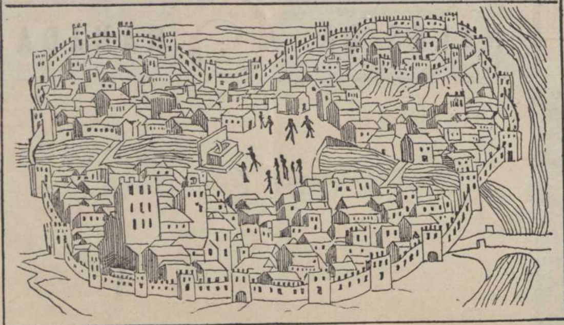
Granada en 1549.—Facsimil de un grabado de la época.