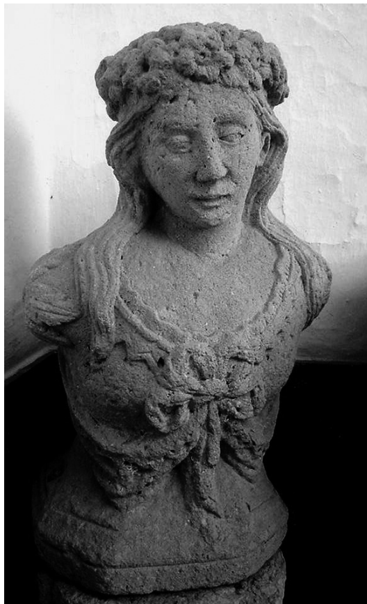
3. José Álvarez Cubero. Flora (ca. 1790-1793). Colección particular, Priego (Córdoba).