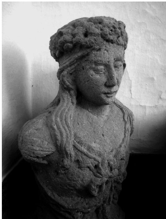
4. José Álvarez Cubero. Flora (ca. 1790-1793). Colección particular, Priego (Córdoba).