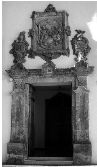
5. José Álvarez Cubero. Portada de la casa Ruiz de Castro (1790). Priego (Córdoba).