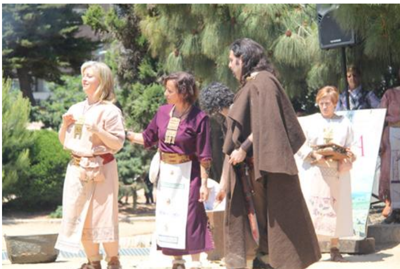
Ilustración 03a. Equipo de reconstrucción mostrando las vestimentas utilizadas por un grupo celtibérico

Estas representaciones suelen llevarlas a cabo grupos de teatro y grupos de reconstrucción histórica. Los primeros realizan una representación teatral y suelen ser pequeñas empresas o compañías de teatro formadas por actores que ofrecen sus representaciones a los organizadores de los eventos. Los segundos, tienen un carácter más didáctico y suelen apoyar sus representaciones en la arqueología experimental, en la investigación histórica y arqueológica y en investigaciones científicas. Las vestimentas y objetos de los que disponen son reproducciones basadas en materiales arqueológicos originales. Estos equipos están formados por perfiles diversos con artesanos, historiadores, arqueólogos, estudiantes, aficionados a la historia, etc [Ilustración 03a] [Ilustración 03b].