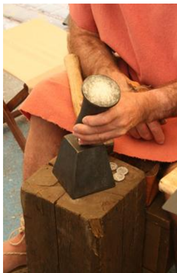
Ilustración 04. Artesano mostrando la elaboración de monedas con técnicas de época romana

Es habitual la presencia de artesanos entre los miembros de los equipos de reconstrucción. Éstos realizan muestras de trabajos artesanales entre los que se encuentran picapedreros, artesanos del tejido, cestería, construcción, etc. En muchos casos el artesano hace partícipe al público. El artesano también suele estar presente en estos eventos de manera individual sin formar parte de un grupo de reconstrucción. Estos pueden ser de la localidad o de otros territorios [Ilustración 04].