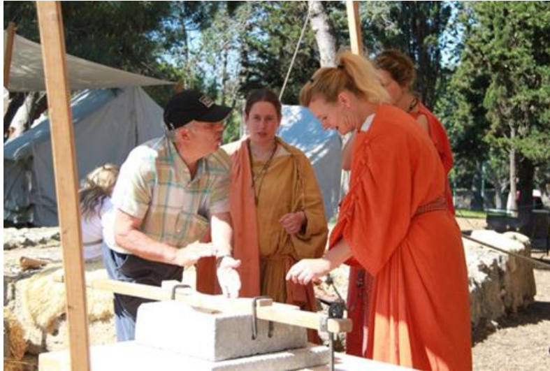
Ilustración 06. Representación del uso de utensilios de época romana con la participación de público asistente