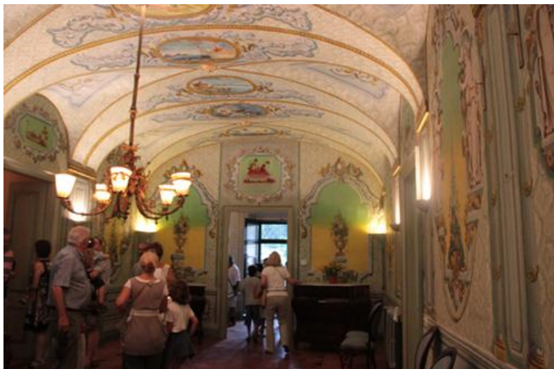
Ilustración 01b. Asistentes a la Fira d'Indians de Begur visitando una casa india.

En Cataluña se conserva un rico patrimonio arquitectónico fruto de las fortunas indianas, es decir, las que obtuvieron los emigrantes españoles, que a partir del siglo XVIII fueron a "hacer las Américas" con el objetivo de invertir en la industria, el campo y la construcción. El regreso masivo de este capital se produjo en la segunda mitad del siglo XIX, a partir de las insurrecciones y las guerras por la independencia de las antiguas colonias españolas. Las construcciones indianas modernistas están representadas por palacios, villas señoriales, masías, bloques de pisos, iglesias, colegios, asilos u hospitales. Es un patrimonio arquitectónico diseñado por indianos que llegaban de América y que querían mostrar las riquezas obtenidas.