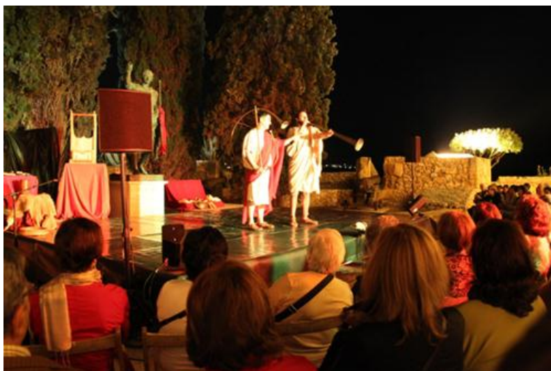
Ilustración 01a. Recreación de instrumentos musicales de época romana en las murallas de Tarragona

Disponemos de ejemplos del uso del patrimonio histórico de la civilización romana clásica. En el Festival Tarraco Viva (López-Monné et al. 2008) se difunde el extenso patrimonio histórico que se conserva de la Tarraco romana declarada patrimonio de la humanidad ( www.tarracoviva.com ). En este caso, Tarragona dispone de un patrimonio romano conservado que actúa como un marco ideal para la divulgación del mismo y de la civilización romana. Así, se localiza un anfiteatro en un notable estado de conservación, un Foro provincial, el Pretorio, unas canteras o diferentes yacimientos arqueológicos. Este patrimonio es escenario de buena parte de las actividades programadas [Ilustración 01a].