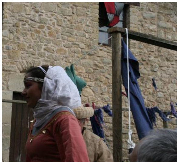
Ilustración 05. Representación de una escena de época medieval por parte de miembros de la comunidad local

En Portugal, diversas entidades privadas especialmente grupos de teatro y de animación dinamizan estos eventos de recreación (Raposo 2008). Realizan las actividades de recreación histórica a través de contratos y financiación con esas entidades. En cambio en el Reino Unido, se han llevado proyectos como Peformance, Learning, and Heritage , basado en una actuación conjunta y articulada entre academia, instituciones y otras entidades del Estado o ayuntamientos (agentes de turismo y escuelas) (Raposo 2008). De hecho, la agenda de estos organismos incluye frecuentemente actividades de recreación histórica, como forma de estimular el debate sobre tópicos como la nacionalidad, la ciudadanía, el patrimonio, etc.