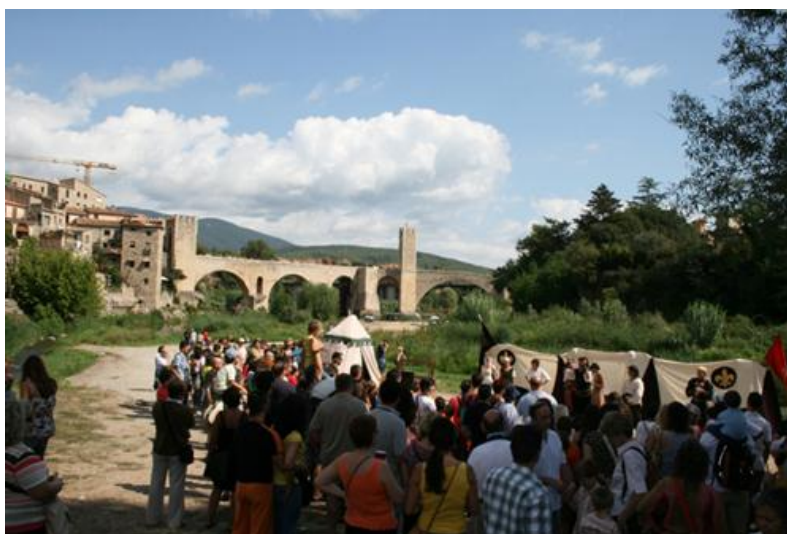
Ilustración 02. Asistentes a una representación teatral en el Mercado Medieval de Besalú

Finalmente, en algunos eventos de recreación también está presente el patrimonio histórico árabe. La Feria Mora Morisca ( www.moramorisca.com ) tiene como espacios de celebración de este evento los barrios árabes y judíos de la población [Ilustración 02].