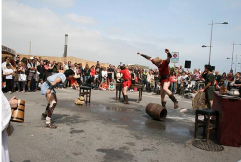
Ilustración 03b. Representación teatral en un evento de recreación histórica romana

Es habitual la presencia de artesanos entre los miembros de los equipos de reconstrucción. Éstos realizan muestras de trabajos artesanales entre los que se encuentran picapedreros, artesanos del tejido, cestería, construcción, etc. En muchos casos el artesano hace partícipe al público. El artesano también suele estar presente en estos eventos de manera individual sin formar parte de un grupo de reconstrucción. Estos pueden ser de la localidad o de otros territorios [Ilustración 04].