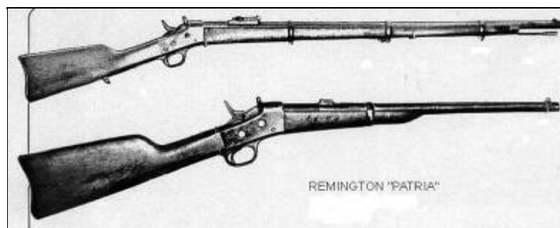
Imagen 4. Fusil y carabina Remington Coli (Settel 1984).

A su vez, el dibujante Cesar Spadari y el guionista Enrique Rapela, dan cuenta del uso de un tipo de Remington denominado Coli (Settel 1984), solo usado por las tropas de caballería (imagen 5). Este dato denota un conocimiento pormenorizado del armamento de frontera para comienzos de la década de 1870.