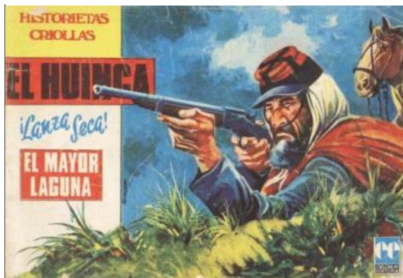
Imagen 5. Soldado de infantería con Remington Coli (Spadari 1973).

Algo similar sucede en lo que refiere a la vestimenta de la tropa fronteriza. Los guiones y dibujos de las historietas que caracterizan la vida fortinera de frontera son ricos en detalles que sólo conoce aquel que ha ahondado en las fuentes documentales de la época. Entre estas fuentes destacan los partes del ejército nacional (Colección Lucha contra el indio en el Servicio Histórico del Ejército) y múltiples bibliografías de científicos, militares y viajeros que transitaron los ámbitos fronterizos.