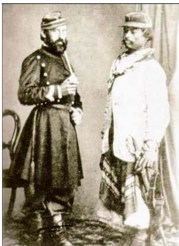
Imagen 8. Carta de visita de oficial y tropa durante la Guerra del Paraguay (Toyos y otros 2001).

A partir de lo expuesto resulta evidente la necesidad de continuar reflexionando sobre las estrechas relaciones que vinculan a la historieta argentina (en su calidad de producto cultural netamente interpelado por la historia y la antropología) con las ciencias sociales (cada vez más conscientes del impacto que tienen los canales de difusión masivos heterodoxos -como la historieta- en el proceso de construcción de conocimiento). Los aportes consignados representan un intento preliminar de señalar la fertilidad de un campo de estudio que hasta el momento ha recibido una atención minoritaria en los programas de investigación académicos. La propuesta dista de hallarse en una instancia conclusiva. Muy por el contrario, el presente artículo busca operar como un disparador de inquietudes antes que representar el cierre de una temática. Confiamos en que la sumatoria de nuevos esfuerzos en las actividades de pesquisa motive la aparición de escritos temáticamente convergentes y, de manera concomitante, se inicie un proceso que progresivamente configure un espacio de análisis científico exclusivamente ocupado de la historieta argentina.