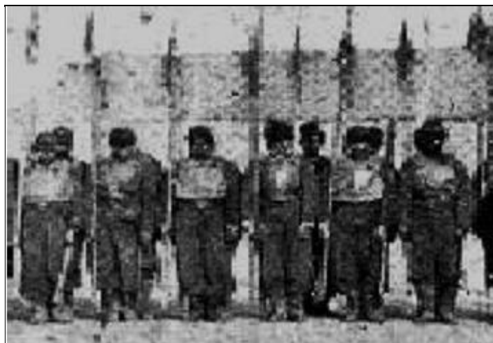
Imagen 1. Soldados con coraza de cuero (Pozzo 1879 en Museo Roca).

Los autores mencionados no solo abrevaron en fuentes primarias editadas con el fin de recrear el contexto histórico y material de sus obras. Las fotografías de época y las colecciones de museos y privadas -específicamente los artefactos militares e indígenas vinculados a los armamentos y a la vestimenta- debieron haberles resultado de extrema utilidad para tales fines. Un ejemplo de ello es el caso de las corazas de cuero implementadas en las tropas de frontera por el ministro Alsina. Si bien el uso de las mismas se encuentra documentado (Ministerio de Guerra y Marina 1876 y Servicio Histórico del Ejército colección Lucha con el indio ), su apariencia y forma de uso, sólo pueden apreciarse en fotografías o en las exposiciones museográficas (Álbum Antonio Pozzo 1879 en Museo Roca y Museo de Armas de la Nación). Carlos Casalla, en Cabo Savino N° 3 (1975), presenta al protagonista enlazado en un entrevero a sable con un indígena, en donde puede apreciarse el uso de la coraza de cuero endurecido (imágenes 1 y 2).