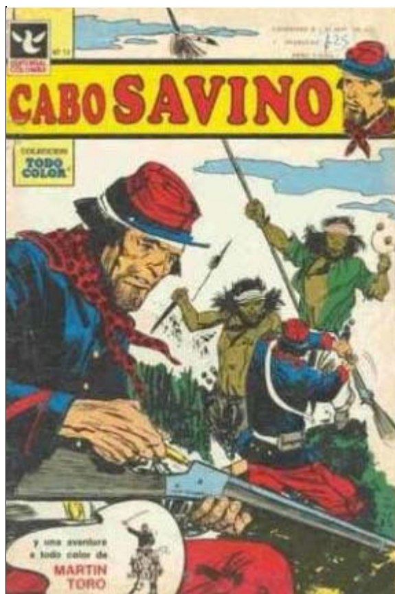
Imagen 3. Remingtons y vestimentas de soldados (Casalla 1975).