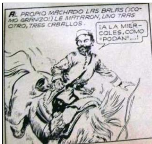
Imagen 7. Muerte de caballo del coronel Machado (Wadell y Magallanes 1974).

Un detalle sumamente interesante plasmado en el trabajo de Wadell y Magallanes, consiste en el dato referido a la muerte de tres caballos del coronel Benito Machado durante la carga efectuada por su batallón el Sol de Mayo (imagen 7). Dicha información solo se encuentra en los intercambios epistolarios realizados entre un sobrino de este y el vencedor de "La Verde", el teniente José I. Arias (ubicables en el Archivo Mitre) o en una publicación de difícil acceso como el libro Recordando el pasado, campañas por la civilización , de Del Valle (1926). Así este episodio de coraje extremo es rescatado y representado gráficamente para un público mucho más amplio y numeroso que el de los círculos académicos de historiadores que estudiaron dicho acontecimiento político-bélico de fines del siglo XIX.