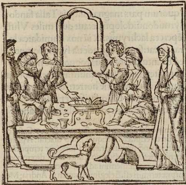
Modestini Iurisconsulti. Argumentum. ii.

Conticuere oēs intentiq; ora: Quia supra dixit: Fit strepitus tectis. Conticuere at p conticuerūt q me/ tri cā fit: uel rōne clausulaz. Nec est (ut qdā dicūt) dualis numerus: q apud Latinos nusq; penitus iue/ niē. Et bene oēs addidit: poterāt. n. simul qdā: sed nō oēs tacere. Intētiq; ora tenebāt: aut ora intue/ banē loquētis: aut immobiles uultus hēbant: ut Tenuitq; inhians tria cerberus orasi. imobilita ha/ buit: aut tenebāt habebāt: ut fit figura: & intelligamus ora intēta habebāt ut Terē. Nā illi andriæ nomē erat: te/ neo. Iō at hoc addidit: qā pōt q; tacere nec aduerrere. Inde: aphā resis: pro deinde. Toro p̄ aeneas sic orsus ab