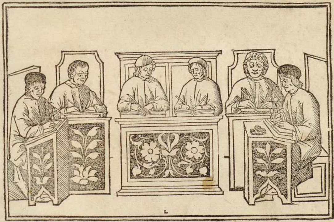
Seruius Donatus Probus Domitius Landinus Mancinellus