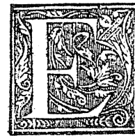
Tabla de la presente obra.