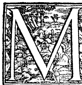
Cōdicio nes y ingenio de Caralla.

Basiano Antonino Caracalla primero deste nombre, y quarto de los que tomaron el nombre de Antonino, y de su hermano Geta, cōtenida en solo este Capitulo.