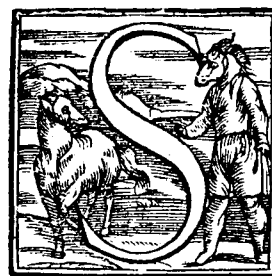
Galba fue el primero a quien los exercitos alzaron por Emperador.