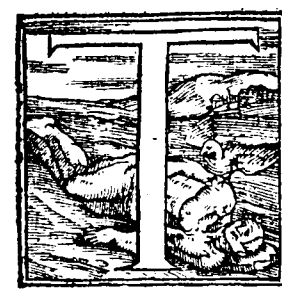
Seneca maestro de Nerõ.

CAP. I. En que se cuentan las cosas que passaron en el principio del Imperio de Neron, hasta el año quinto de su imperio.