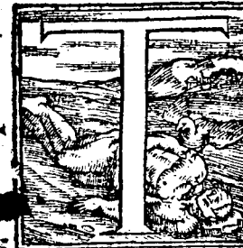
Mamea madre de Seuero.

R as la obscuridad y desuentura pasada plugo a Dios traer claridad y a legria, porque muerto este maldito Heliogabalo de comun consen-