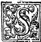
Sacrilegij enormis ex Platone.

S ACRILEGII enormitas, & grauitas, nedum (differantissime lector) ex facis canonibus, decretisq; sanctorum patrum, facile deprehendi potest; sed si dicta Platonis legantur in dialogo 9. de legibus in princ. utiq; grauior reputabitur, quippe cum de sacris deorum falorum ibi agatur. ¶ Et tam graue delictum reputatur; quid igitur facientium de pessimis & sceleratissimis Dei omnipotentis &