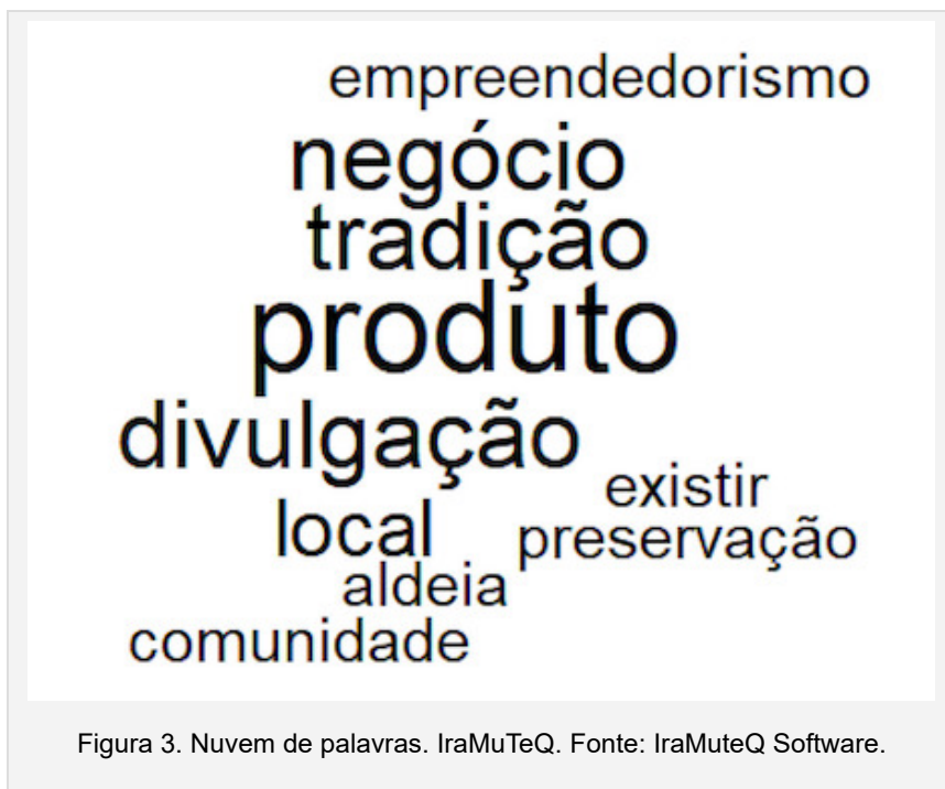
Figura 3. Nuvem de palavras. IraMuTeQ.

Cumulativamente, e para um maior entendimento dos resultados obtidos pela Análise de Similitude gerada, foi usado o mesmo corpus de texto para a geração de uma nuvem de palavras que reforce a análise e predominância das formas mais relevantes (figura 2).