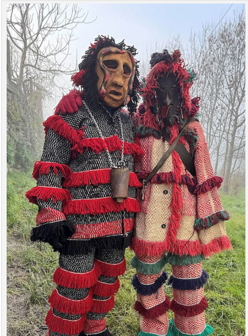
Fotografia 1. Os Máscaras de Ousilhão. Autor: Roberto Afonso (2024).

enquanto artefacto simbólico, deixa de ser um marcador de género fixo e passa a ser reconhecida como um meio inclusivo de expressão cultural e pertença, permitindo que a tradição se mantenha viva, dinâmica e socialmente relevante (Buch e outros 2011a, Barkar 2023).