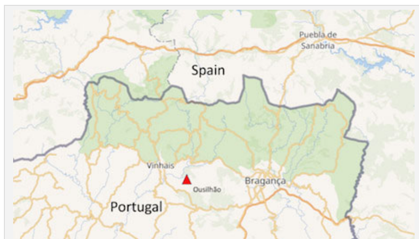
Figura 1. Localização da Aldeia de Ousilhão (Vinhais – Portugal).

à União de Freguesias de União das Freguesias de Nunes e Ousilhão e constitui-se como um de muitos núcleos habitacionais representativos da resistência e resiliência cultural do mundo rural transmontano.