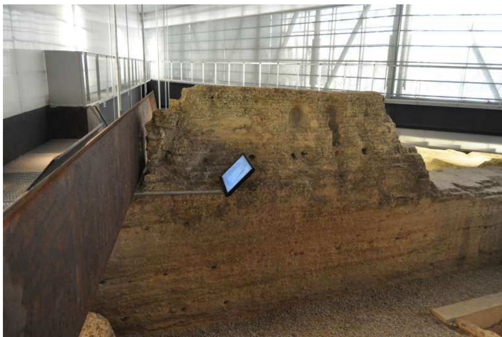
Fig 7. Disposición de monitores dependientes de la pasarela.

El descubrimiento de los restos arqueológicos de época turdetana y romana ayudan a entender la conformación de un asentamiento del que apenas se tenía información sobre su origen ayudando a la población a conocer su pasado y poder acceder a parte de él, mostrárselo a sus familiares y establecer una relación con su pasado.