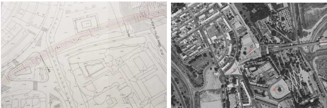
Fig. 1. Izq. Trazado de las pantallas de la línea de metro que llevan a la realización del estudio arqueológico. (Mercado, 2004).

Debido a su entidad, se planteó que los restos fueran incorporados a la estación de Puerta de Jerez. Desgraciadamente la Consejería de Cultura desestimó esta idea y tras la organización de unas jornadas de puertas abiertas los restos fueron tapados y el proyecto de metro desviado (Junta de Andalucía, 2012:en línea).