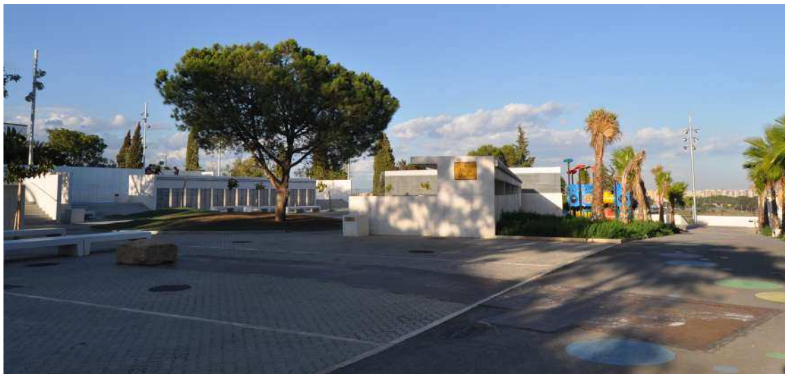
Fig. 6: Vista del empleo de cambio de pavimento para marcar la presencia de una estructura arqueológica en el subsuelo.

En lo que respecta al espacio público opta por la creación de una plaza a distintos niveles en la que delimita espacios como son un área infantil; una zona destinada a realizar actividades culturales, por ejemplo visones filmicas; y un espacio deportivo. La diferenciación de espacios los realiza mediante el uso de muros de cemento.