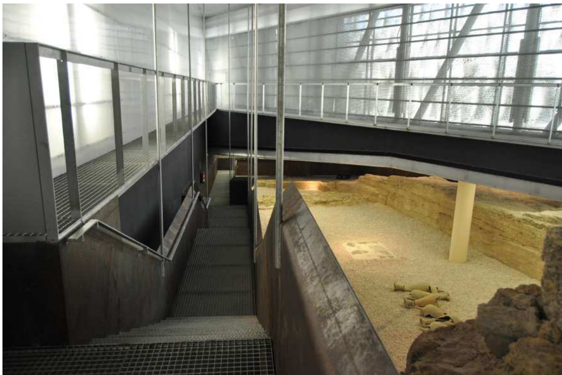
Fig. 4. Escaleras conducentes a los restos arqueológicos. (Foto: Julia García, 2013).

De otra parte, demuestra como los avances urbanos y el desarrollo de los medios de transporte no tienen por qué suponer una merma a la tutela del patrimonio arqueológico y viceversa, sino que se pueden ayudar saliendo los dos reformados y mejorando el día a día de la sociedad.