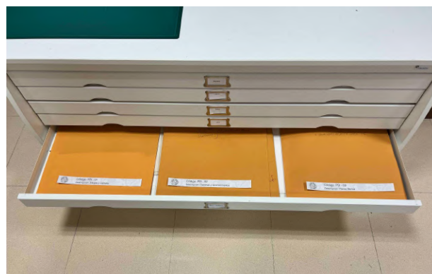
Archivador metálico y planera

Este adhesivo lo he creado usando el logo principal, fábrica de azulejos sanitarios San Isidro, que encontré en la documentación, en color negro y fondo transparente, indicando