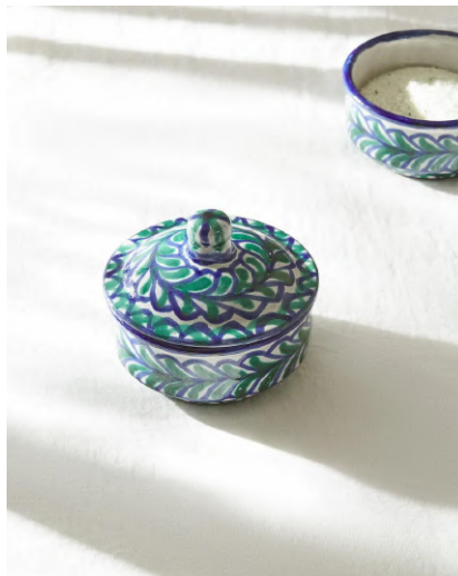
Caja de cerámica con tapa, dibujos florales en tonos azules y verdes sobre fondo blanco

E incluso la cerámica granadina se hace eco en grandes marcas a nivel mundial, de la mano de una empresa multinacional como es Zara Home, rescata una colección de unas 2200 piezas donde de esta manera no solo expone una colección de cerámica sin más, sino que rescata de los archivos históricos dibujos guardados como margaritas y flores conservando los colores de siempre, azul cobalto y el verde del cobre.