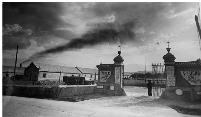
Solar y fábrica San Isidro