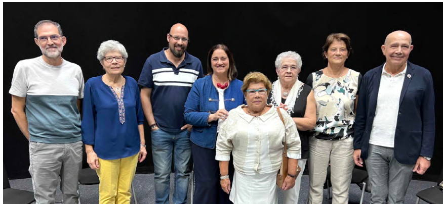
Momento final de la entrevista