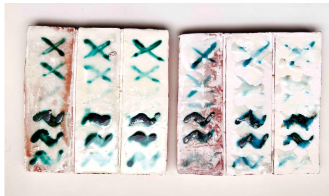
Pieza terminada. Segunda prueba

Repetimos el proceso ( segunda prueba ) aplicando el mismo porcentaje de engobe y pigmento así como los tiempos de cocción y el resultado fue aún más desastre, observamos que el color y el engobe blanco desaparecieron más aún .