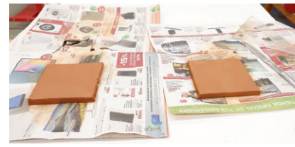
Proceso de realización pella de arcilla, primero se pasa por la amasadora y posteriormente le doy esa forma cuadrada, recordando a una loza de azulejo para aplicar nuestra prueba.