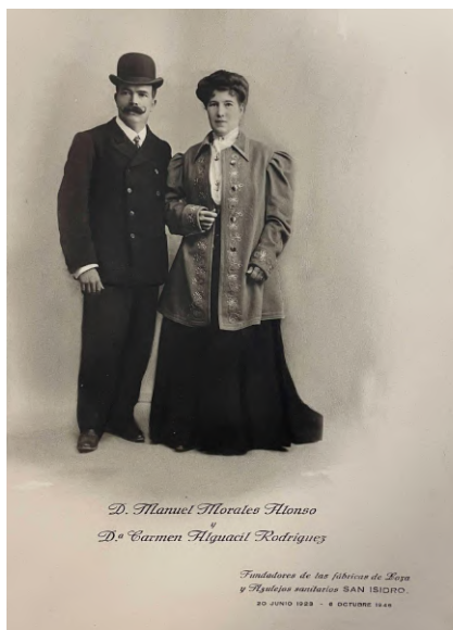
Fundadores de la Fábrica San Isidro