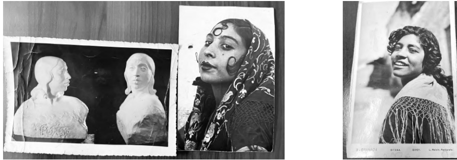
Busto y fotografías retrato mujer gitana