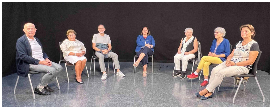
Momento previo a la realización de la entrevista

En su haber de formación Agustín ejerció como profesor en la Escuela de Arte y oficios de Granada pero también la realizaba en su propia fábrica formando a sus empleados en diversas técnicas que resalto a continuación.