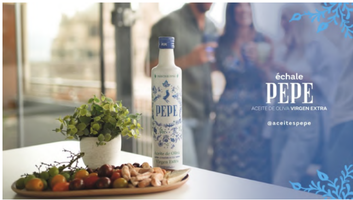
Botella de aceite de oliva, en homenaje a la cerámica Granadina