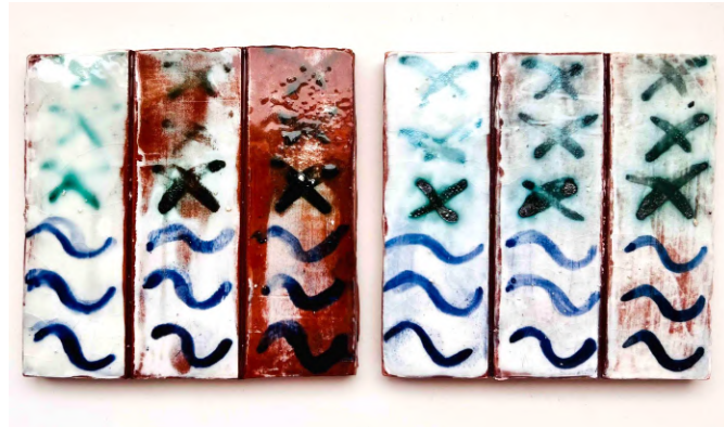
Pieza terminada. Primera prueba.

Comento con el profesor, Rafael Peralbo, el resultado, repasamos mis indicaciones y aparentemente todo está perfecto, todo debería de salir bien, pero realmente el resultado no es lo esperado.