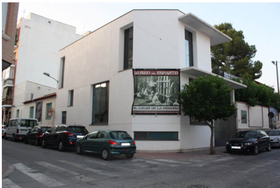
Ilustración 9. Museo-Centro de Interpretación del Esparto de Cieza.

En 2014, una subvención del Plan Territorial de Desarrollo Rural, Campoder (Iniciativa Comunitaria Leader 2009-2011) permitió la construcción del actual Museo-Centro de Interpretación del Esparto. El nuevo edificio, levantado dentro del mismo recinto de la Asociación, cuenta con 267 m 2 distribuidos en tres plantas. La planta principal se destina íntegramente a exposición, mientras que la superior acoge parte de la exposición y un espacio de biblioteca y sala de reuniones. La planta sótano, por su parte, se dedica a depósito y almacén de objetos. A todo ello se suma, en el patio, unos 100 m 2 vallados y cubiertos que cobijan diversa maquinaria industrial de gran tamaño, toda ella restaurada y en perfecto funcionamiento.