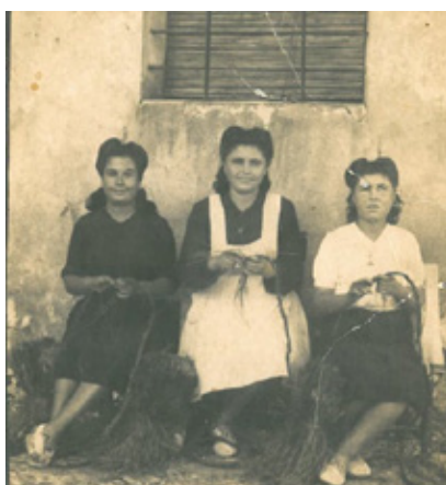
Ilustración 2. Mujeres haciendo lía.

Atendiendo a los modos de producción, el esparto se trabaja siguiendo un proceso prácticamente inmutable hasta mediados del pasado siglo. Básicamente, podríamos hablar de un trabajo en crudo , y de un esparto cocido , según el fin al que estuviera destinado. Todo comienza en el monte, donde los arrancaores recolectan el esparto valiéndose del palillo , una vara de unos 20 ó 30 cm de madera o hierro, sobre la que se giran las hojas para facilitar su extracción. Luego, los haces de esparto son tendidos en zonas aireadas y soleadas, donde se mantienen entre veinte y treinta días dorándose al sol. Una vez seco, el esparto puede trabajarse en crudo , como sucedía con la mayor parte de los productos artesanales, o entrar en una fase de separación y extracción de las fibras, utilizadas sobre todo en hilaturas y tejidos.