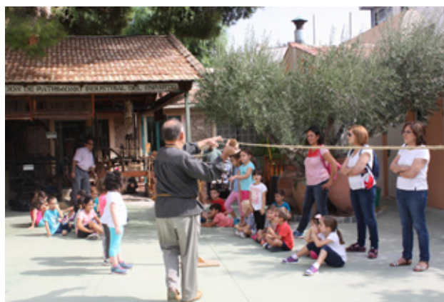
Ilustración 10. Demostración de hilado de esparto.

Los dos primeros programas buscan optimizar la experiencia de la visita, individual o colectiva, adaptándose por ejemplo a las distintas edades.