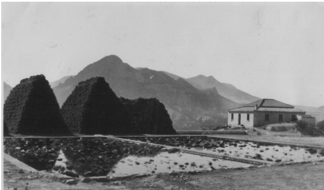
Ilustración 4. Balsas de esparto en el paraje del Toleillo.

Cartagena, diría : “...Se hace aquí una gran cantidad de cuerdas y de cables de esparto, algunos están hilados como los de cáñamo, otros no están hechos más que de esparto aplastado. [...] Estos cables son excelentes, porque flotan sobre la superficie del agua y no están sometidos a verse cortados por las rocas sobre los lados malsanos”. Y a continuación hace una muy acertada reflexión sobre esta fibra que, por su interés, reproducimos íntegra: