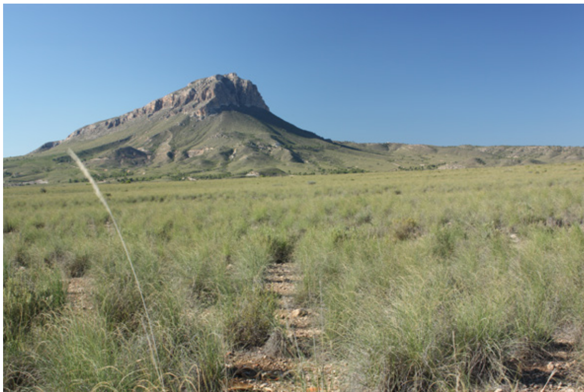
Ilustración 6. Paraje de la Cabeza del Asno, Cieza.

divisan desde esta v.[villa] son La Atalaya y el Castillo á la parte opuesta del r.[río] la del Oro, vulgarmente Lloro, á la espalda de la primera: Picarcho, Picablanca, Pila, Ascoy y Cabeza del Asno, descollando entre todas el Peñón de Armochón que se descubre á larga distancia [...]" (Madoz, 1847:388).