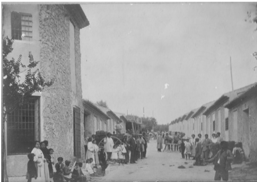
Ilustración 7. Calle Santiago, Cieza. Obreros de la fábrica de esparto de D. Silvestre Precioso.

“...el conjunto de los bienes muebles, inmuebles y sistemas de sociabilidad relacionados con la cultura del trabajo que han sido generados por las actividades de extracción, de transformación, de transporte, de distribución y gestión generadas por el sistema económico surgido de la ‘revolución industrial’. Estos bienes se deben entender como un todo integral compuesto por el paisaje en el que se insertan, las relaciones industriales en que se estructuran, las arquitecturas que los caracteriza, las técnicas utilizadas en sus procedimientos, los archivos generados durante su actividad y sus prácticas de carácter simbólico” (IPCE, 2011b:9).