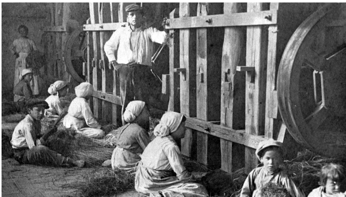
Ilustración 8. Picaoras trabajando en los mazos.

Más compleja es la trasmisión de este saber hacer. Todos los oficios requerían de un gran esfuerzo físico —pensemos en los arrancaores , que pasaban varios días seguidos en el monte, cargando esparto y expuestos a las adversidades meteorológicas del día y la noche; o en los balseros —, pero algunos eran también peligrosos. Era común que las picaoras dieran con sus manos bajos los enormes mazos de madera, amputando o destrozando sus dedos; los rastrilladores solían verse afectados por enfermedades pulmonares consecuencia de la inhalación continua del polvo de la fibra; y un oficio menos lesivo, como el de menaor —aquel que giraba la rueda de la máquina de hilar— solía estar desempeñado por niños, a pesar de una teórica prohibición. Los hilaores , en cambio, requerían una habilidad que se conseguía solo tras años de aprendizaje. Así, es fácil entender la dificultad de transmitir y conservar en las nuevas generaciones el vínculo con un oficio que era y es, duro, poco rentable y arduo.