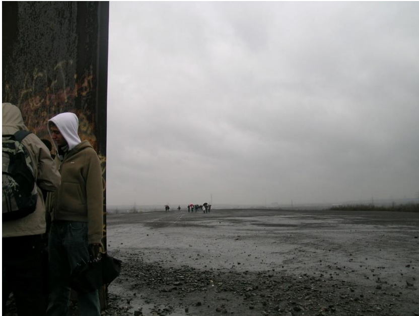
Figura 5: Francisco Arques (2008). Vista de la obra de Richard Serra The Schurenbach tip . Essen (1998). Archivo del autor.

Serra, a la pregunta que nos hacíamos al principio de cómo construir el imaginario paisajístico, nos responde con una colina de escoria, “un túmulo funerario para una industria muerta”, según sus propias palabras. En el centro de un territorio donde anteriormente existían infraestructuras de carreteras y vías férreas, hoy se levanta una colina de miles de toneladas de escoria de la que surge una pletina de acero de 67 toneladas. Un observatorio desde el que contemplar la Cuenca del Ruhr, un lugar significativo, elegido y construido con suma precisión: 51^{\circ} 30' 46.20'' N, 7^{\circ} 1' 08.85'' E (fig. 6 y 7).