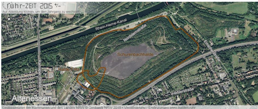
Figura 7: Historisch Schurenbach 2015.

El problema de construir el imaginario paisajístico que enunciábamos al principio, no radica en la transformación del paisaje, sino en el carácter de esta transformación, en la capacidad de saber actuar sobre un paisaje sin destruirlo, sin romper su carácter esencial, sin eliminar aquellos trazos que le dan continuidad histórica nos dice Joan Nogué. Pero en ese pensar el carácter, la historia, la identidad... nos olvidamos de que la montaña de escoria construida con el residuo de miles de toneladas —producto de la destrucción ambiental llevada a cabo durante años—, constituye una operación de apilar un desecho industrial mostrárnoslo naturalizado (como montaña) y desdibujando el gran pedestal que es. Serra desde su imaginario paisajístico nos propone un tótem, un punto geodésico que quiere ser el testimonio de una época de desarrollo industrial en la Cuenca del Ruhr, un juego retórico que nos confronta con ese paisaje de brumas y chimeneas que se ve desde la atalaya de escoria. Pero lo que me parece más reseñable es que Serra con su intervención,