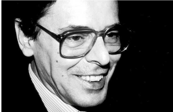
Figura 3: Elisa Cabot, El poeta, ensayista y traductor español José Ángel Valente .(Flickr.com) Licencia CreativeCommons

paisaje más emblemático de la obra de Valente sea el desierto: “Cruzo un desierto y su secreta/ desolación sin nombre” 12 .