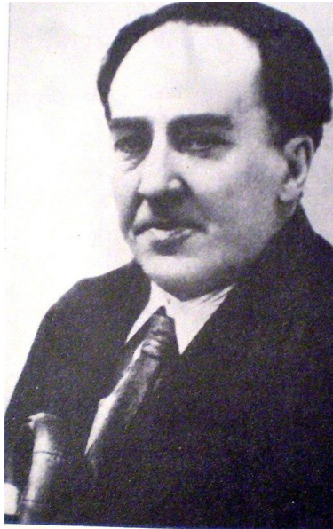
Figura 1: Alfonso Sánchez García, Retrato de Antonio Machado . (Historia de la Literatura Argentina, Vol. II) Imagen de dominio público

volverán la mirada a la arquitectura popular y sus sistemas constructivos tradicionales relacionados irremediabilmente con el contexto cultural e histórico 5 .