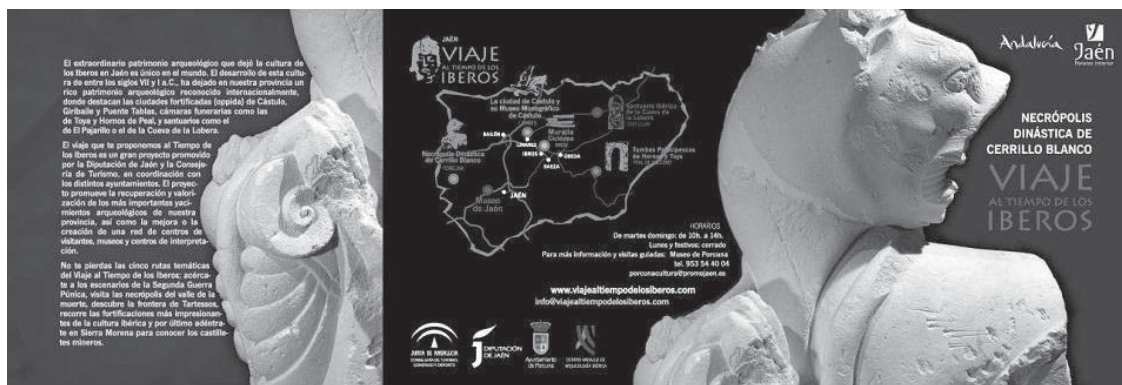
Figura 9. Folleto Necrópolis Dinástica de Cerrillo Blanco. Proyecto Viaje al tiempo de los Iberos.

En el momento presente el resto de yacimientos se encuentran en la fase final de la ejecución del proyecto, o pendientes de su inauguración. Además, el proyecto de Viaje a través del tiempo y del territorio para conocer la cultura ibera tendrá también como referente la inauguración del Museo Ibero de Jaén, que centralizará todas las acciones, contenidos y proyectos de los territorios bajo los cuales se han desarrollado las intervenciones de la última década.