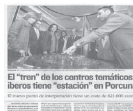
Figura 8. Nota de prensa. Inauguración 14-11-2010