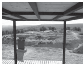
Figura 7. Zona de recreo y paneles explicativos