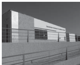
Figura 5. Vista exterior del Centro de Visitantes