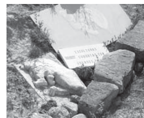
Figura 4. Paneles y recreación. Primeros visitantes.