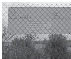
Figura 3. Cercado.