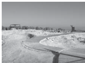
Figura 6. Yacimiento arqueológico. Vista general de pasarelas