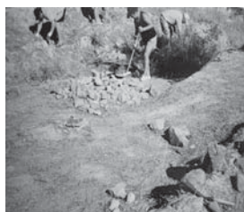
Figura 2. Actuaciones de limpieza y adecuación tras la recuperación del Yacimiento en 1998.