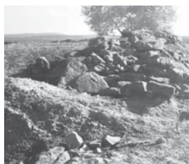
Figura 1. Estado previo del Yacimiento de Cerrillo Blanco, 1998.