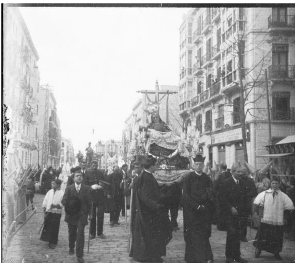
Fig. 7. La Virgen de las Angustias de San Andrés a su paso por la Gran Vía; al fondo, de nuevo el San Juan de Santa Isabel la Real.

Escortando los pasos, en nutridas filas, unos hombres cirio en mano, vistiendo toscas túnicas negras o blancas [...] No faltaban bandas de música para interpretar las consabidas marchas fúnebres, como no faltaban sobrepellices y capas pluviales del clero, ni los chaqués de las autoridades, ni los uniformes de las comisiones militares y, por supuesto, la escolta de una compañía del regimiento de Córdoba [...]» 32 .