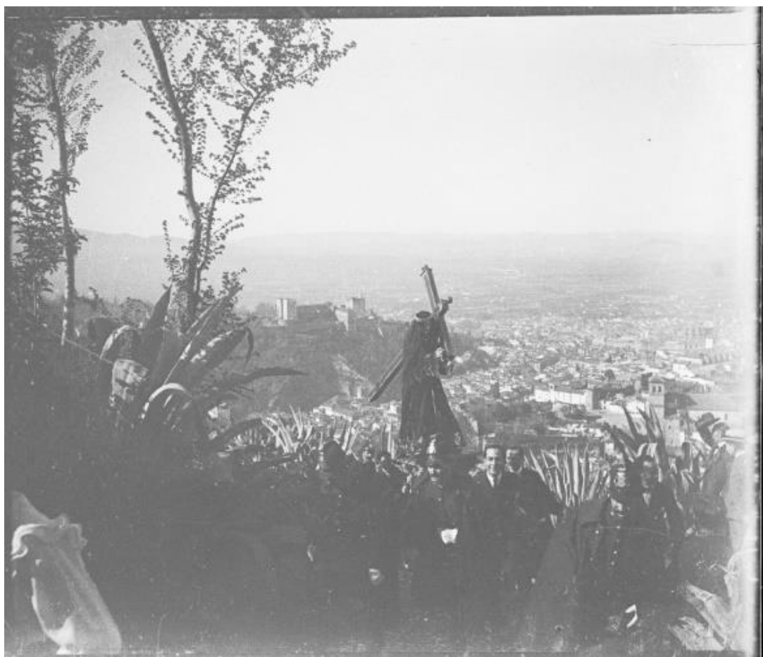
Fig. 4. Nazareno de la Hdad. del Santo Via Crucis del Albaicín en la subida a la Ermita de San Miguel.

desfile que solía demorarse sobre unas cinco horas. Al cortejo se incorporaban una escolta romana, niños cantores, niñas portadoras de atributos pasionistas, plañideras, bandas de música, algunos penitentes de hábito negro en el tramo de la Urna , morados en el de la Soledad y blancos en el de San Juan . Por supuesto, el cortejo iba precedido por las andas de la Vera Cruz y de los sones lastimeros de las mismas tres chías que durante los días previos recorrían la ciudad solicitando donativos 15 . Por supuesto, completaban las filas todas las autoridades civiles y, normalmente, en representación del Arzobispo acudía el párroco de San Gil, todos los cuales daban por finalizada la procesión con un opíparo ágape 16 .