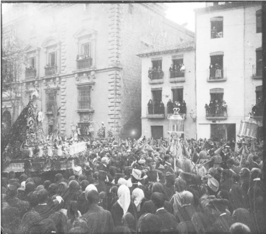
Fig. 3. La Soledad de Santa Paula girando hacia la Real Chancillería; al fondo se divisa el San Juan de Santa Isabel la Real .

del Entierro a las 5 de la tarde. En el año 1881, El Defensor de Granada daba testimonio de cómo «en muchos años atrás no ha salido el Santo Entierro de una manera tan brillante y esplendorosa» 13 . La pompa y el boato de esta procesión llegó hasta el extremo de que las religiosas de Santa Paula llegaron a vender propiedades para poder afrontar la confección de un nuevo manto para la Soledad , cuyo costo se elevó a 30.000 pesetas 14 .