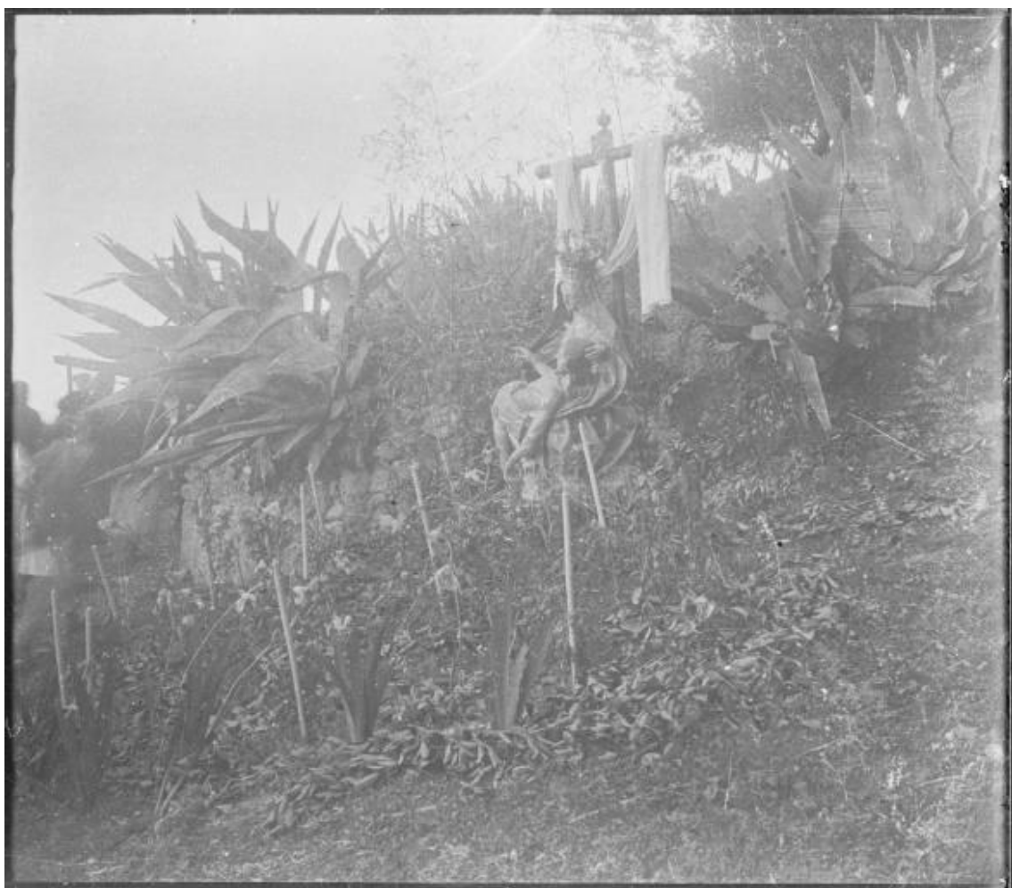
Fig. 1. Peculiar estación de la Hdad. del Santo Via Crucis del Albaicín en el camino de ascenso a la Ermita de San Miguel. Foto: Instituto Gómez-Moreno, Fondo Martínez Riobóo, 1911, DVD 3/Caja 2.31-34/Caja 33 (6x9cm), imagen n o 2.

intocables e incuestionables 2 . Tras el expolio de los conventos y monasterios, a finales de los años 40 del XIX llegaría el turno a las hermandades de cualquier clase, las cuales quedaban sin la posesión de sus tierras y principales fuentes de ingresos. El cierre de los cenobios obligaría a su traslado a templos parroquiales y, ante la incertidumbre de los siguientes sucesos, fue habitual la reclamación de objetos y donaciones que habían sido legados a las corporaciones bajo condiciones muy específicas. En consecuencia, al expolio le sucedieron el abandono y la indiferencia.