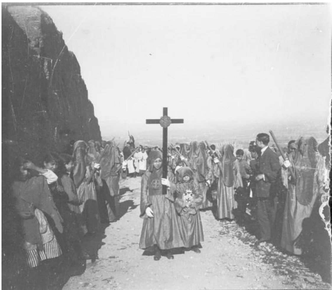
Fig. 10. Cabeza de la Hdad. del Santo Via Crucis del Albaicín llegando a la Ermita de San Miguel . Foto: Instituto Gómez-Moreno, Fondo Martínez Riobóo, 1911, DVD 3/Caja 2.31-34/Caja 33 (6x9cm), imagen nº2.

En 1922, la Soledad de Santa Paula , comenzó a procesionar con San Juan por su barrio del Boquerón con independencia de hacerlo también en la procesión general, a la que se sumaba al año siguiente la Cofradía del Viacrucis para ayudar a dignificar el acompañamiento y el porte de las imágenes 44 . A partir de 1925, el Crucificado de San José ya sólo saldría a la calle como único titular de la recién fundada Cofradía del Silencio 45 y, a ésta, se sumarían pronto nuevas fundaciones que podrían fin al modelo de procesión general castellano, para aproximar la Semana Santa granadina al formato de las estaciones de penitencia diarias de Andalucía Occidental, de lo cual acabaría abominando García Lorca: