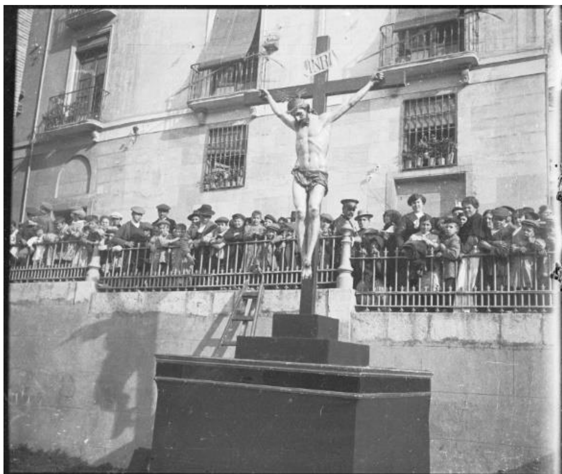
Fig. 8. El Cristo de la Expiración de San José sobre su carroza en la Plaza de Santa Ana .

Precisamente a esta Semana Santa que testimonia Julio Belza es a la que responde la paternidad del Centro Artístico. Gracias a su actividad, en 1909 fue posible recaudar entre socios y comerciantes la nada despreciable cantidad de 3.887 pesetas, con las que se pudo confeccionar los austeros tres nuevos pasos que se añadieron al cortejo. (Fig. 8) El del Crucificado de San José , por ejemplo, tuvo un costo de 350 pesetas, y ello que su configuración era de lo más simple 33 . De aquel presupuesto, salieron las túnicas de los penitentes, los puntuales exornos florales, las bandas de música, el acostumbrado ágape para las autoridades y, por supuesto, la gratificación necesaria para que un buen puñado de hombres se prestasen a empujar los pasos o a vestir la túnica nazarena.