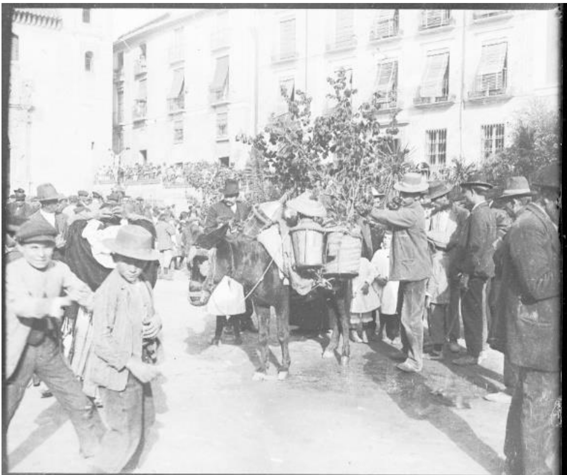
Fig. 9. Aguador repartiendo agua entre el bullicio de la Plaza de Santa Ana; al fondo a la derecha, se distingue el Cristo de la Expiración de San José.

clases más humildes. Este Santo Entierro ya no se presentaba tan resguardado como el de fines del siglo XIX, sino que ahora transitaba por la amplitud de la Gran Vía y los tramos existentes de embovedado del Darro. Era una estampa de otros tiempos puesta en marcha para entretenimiento de la burguesía, que a un tiempo se burlaba de los comportamientos poco decorosos de los nazarenos. De éstos, decía Julio Belza que «no eran penitentes y sí mercenarios pagados con un duro, cuya conducta durante la procesión dejaba mucho que desear, ausentándose de las hileras para beber al paso en las tabernas, gastándose bromas entre risotadas y palabrotas» 37 . (Fig. 9)