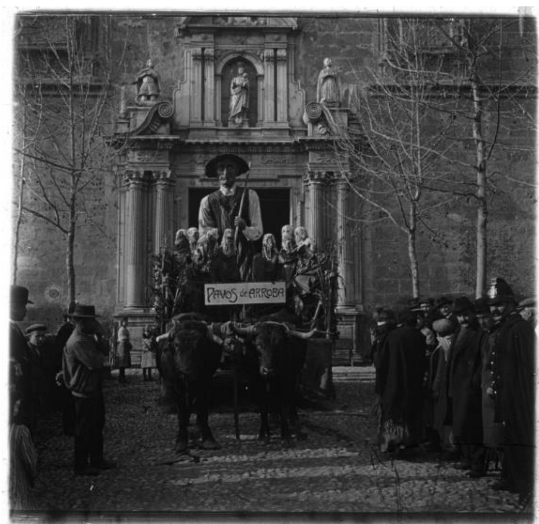
Fig. 5. Carroza del Carnaval granadino saliendo del Hospital Real.

todo el país a partir de los años 50. Ese mismo año, el Centro Artístico instalaba la primera caseta de feria y recuperaba las carocas para las fiestas del Corpus Christi. (Fig. 5) También, un año antes, en febrero de 1911, era implantado por las mismas manos un primer desfile de Carnaval que partía desde el Hospital Real. No obstante, con anterioridad a la gestación de este tipo de festejos que han perdurado o no en el tiempo, al iniciar la primavera del año 1909, la iniciativa del Centro Artístico ampliaba aquella vetusta Procesión General del Santo Entierro al modo de un museo andante de los mayores tesoros artísticos de la Escuela Granadina de Escultura.