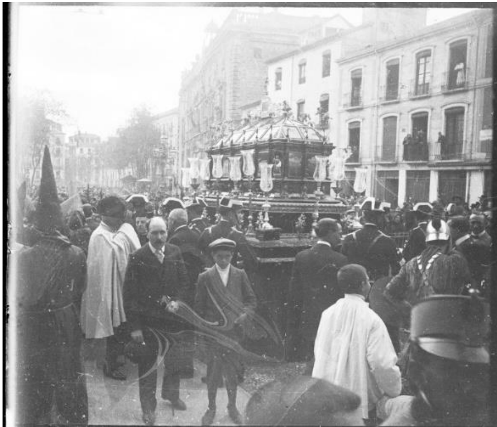
Fig. 2. Salida de la Urna del Santo Entierro de la Iglesia de Santa Ana . Foto: Instituto Gómez-Moreno, Fondo Martínez Riobóo, 1909, DVD 1/Archivador 1. CD 1. Albaicín y Semana Santa/Semana Santa, imagen nº1.

la reaparición común de las grandes procesiones religiosas fuera de los templos. De hecho, meses antes de que fuese proclamado como rey Alfonso XII, es posible apreciar el cambio de línea política que experimentaba el Ayuntamiento de Granada. Tanto es así, que el Consistorio Municipal consigue conformar una comisión civil y religiosa, con la que compromete a la aristocracia y a las autoridades a asumir la responsabilidad de organizar con la mayor pompa posible la Procesión del Santo Entierro de Cristo en la tarde del Viernes Santo 4 de abril. La comitiva partió desde la Iglesia de Santa Ana, nueva sede de la Parroquia de San Gil, a las 5 de la tarde, con las imágenes del Cristo Yacente en su urna de carey y la sublime dolorosa de la Soledad del Monasterio de Santa Paula 10 . (Fig. 2)