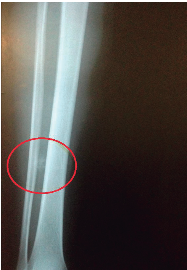
Figura 1. Radiografía anteroposterior de pierna derecha. Se indica la imagen de densidad radiológica similar al calcio.

A la exploración física, la masa tumoral se localizaba a nivel anterolateral del tercio medio de pierna derecha, de aproximadamente 2 cm de diámetro, fija, dolorosa a la palpación, sin cambios inflamatorios, presentando limitación para la movilidad activa y pasiva, lo que le dificultaba la deambulación. El resto del examen físico no presentaba alteraciones. La radiografía simple mostró una masa difusa que impresionaba afectación cortical medial de peroné derecho (Figura 1). Se solicitó una tomografía axial computarizada (TAC) que se informó como una imagen de bordes irregulares con afectación cortical del peroné y membrana interósea (Figura 2).