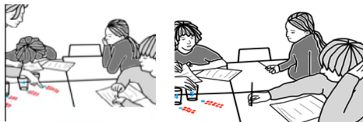
Figura 4. Profesora y Albert trabajando juntos (Radford, 2017)

En el análisis que realiza el profesor Radford sobre la interacción entre la profesora y Albert permite establecer elementos característicos del desarrollo de un proceso de subjetivación.