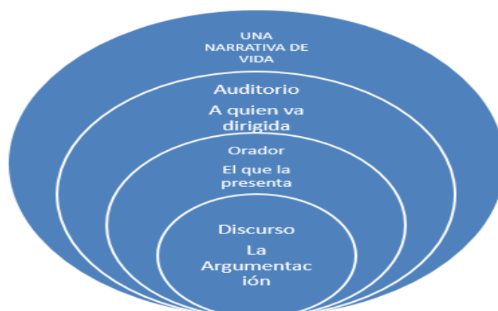
Figura 3. El discurso argumentativo, en la narrativa de vida

La producción de una narrativa de vida se realiza desde los discursos argumentativos el sí mismo como otro , es una necesidad en los intercambios de roles entre orador y auditorio.