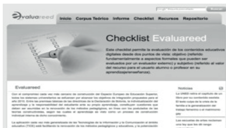
Ilustración 1. Página de acceso al portal Evaluareed

El resultado final del proyecto ha sido un portal web centrado en la evaluación de recursos electrónicos educativos desde el que se tiene acceso al checklist Evaluareed, núcleo del portal, y a una serie de secciones auxiliares que lo complementan y que sirven para profundizar en el tema (corpus teórico, informe detallado del proyecto, recursos evaluados y bibliografía), diseñado de forma que permite un acceso sencillo e intuitivo a los contenidos, especialmente al uso del checklist y de los informes de evaluación. Desde su lanzamiento piloto en 2011 el portal ha sido actualizado con regularidad, siendo la última versión de principios de 2015 ( http://www.evaluareed.edu.es ).