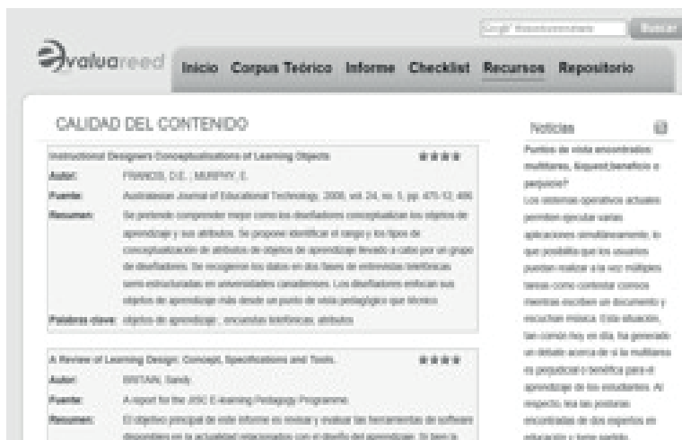
Ilustración 4. Ejemplo de ficha bibliográfica