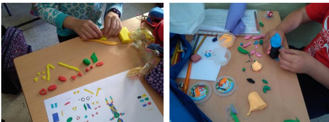
Figuras 5 y 6. Alumnado de 4º A, Colegio Fuentenueva (2016). Proceso creativo.