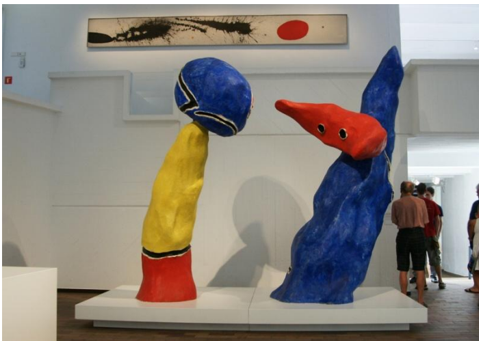
Figura 3. Joan Miró, Pareja de enamorados de los juegos de flores de almendro (1975)