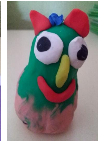
Figuras 1, 2, 3 y 4 de izquierda a derecha. Guillermo, Diego y Cristina. Alumnos de 4º curso de Educación Primaria 9-10 años. Colegio Fuentenueva (2016) Granada. Obras escultóricas que ilustran el cuento "Donde viven los monstruos".