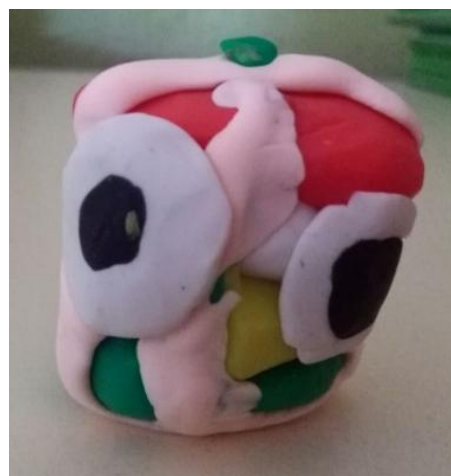
Figuras 11 y 12. Irene, 10 años (izquierda) y Cristina, 9 años (derecha). Alumnos de 4ªA, Colegio Fuentenueva , 2016. Obras escultóricas que ilustran el cuento "Donde viven los monstruos".