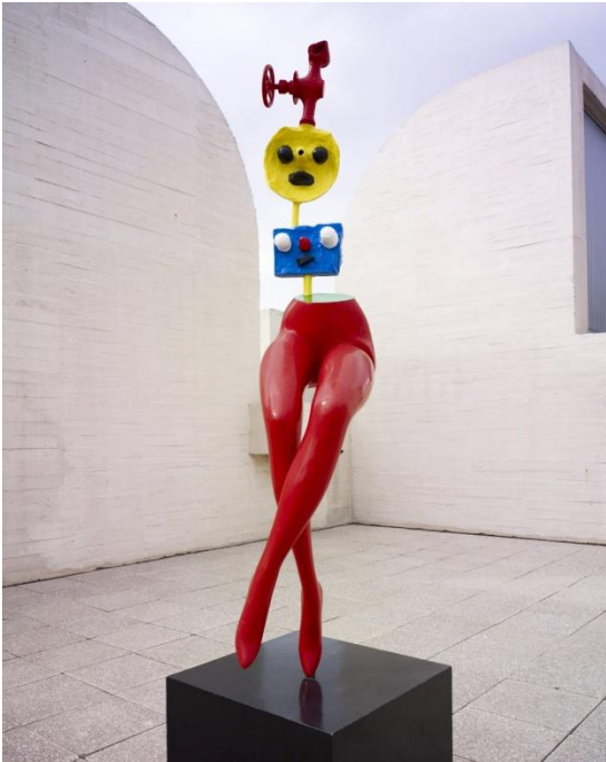
Figura 3. Joan Miró, Muchacha evadiéndose (1967)