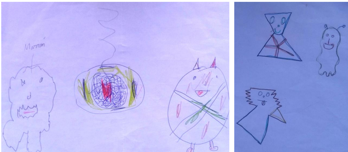
Figuras 3 y 4. Lucía, 9 años (izquierda); Esther, 10 años (derecha). Colegio Fuentenueva, 2016 (Granada). Algunos de sus bocetos.