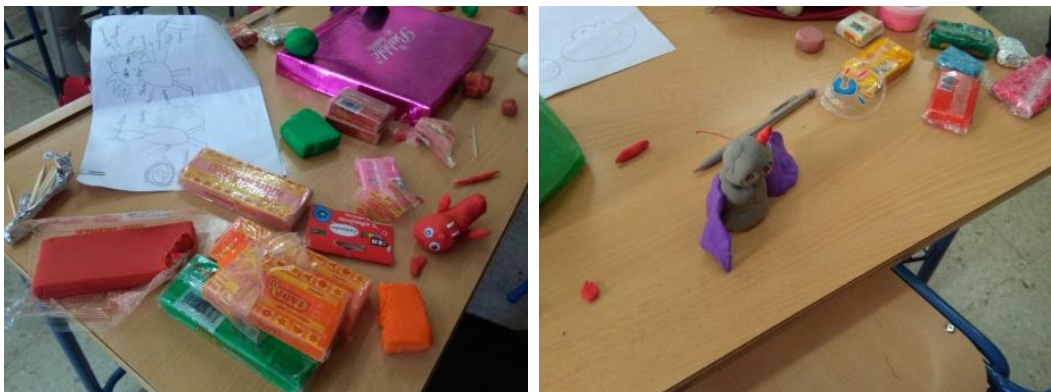
Figuras 7 y 8. Alumnado de 4º A, Colegio Fuentenueva (2016). Proceso creativo.