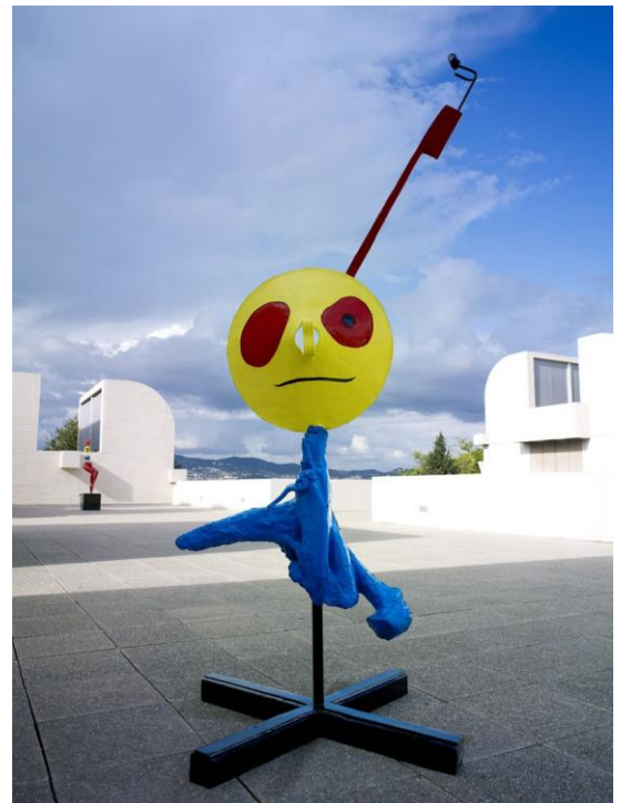
Figura 4. Joan Miró, Mujer y pájaro (1967)