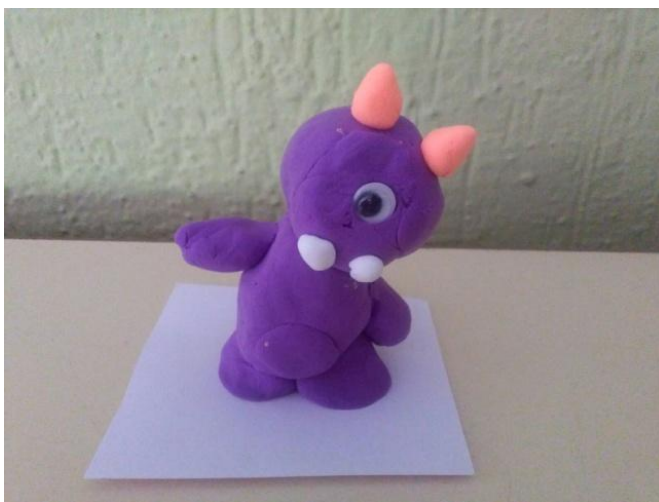
Figuras 9 y 10. Miguel, 10 años (izquierda) y Claudia, 10 años (derecha). Alumnos de 4ªA, Colegio Fuentenueva , 2016. Obras escultóricas que ilustran el cuento “Donde viven los monstruos”.