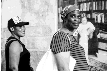
3. Detalle de L'avi i n'Ona (El abuelo y Ona), calle Lluís Martí, 115, Palma. Marina Molada Miró