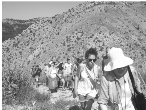
Figura 1. Alumnos del I Curso de Pintura Miradas y Territorio. Subida al castillo de Alcalá de la Selva (Teruel, 2011)

“En estas excursiones se atiende al desarrollo físico de los alumnos por medio de largas caminatas, ascensiones y ejercicios varoniles que dan vigor al cuerpo, al mismo tiempo que energía moral y temple al alma; estudian directamente los objetos naturales y el territorio como teatro vivo de la actividad humana (...)” (Torres Campos, 1882: 188).