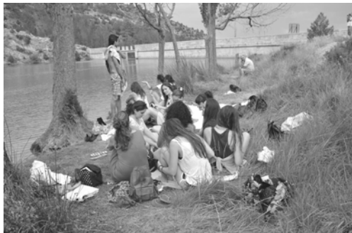
Figura 2. Alumnos del III Curso de Pintura Miradas y Territorio. Descanso en el pantano de Rubielos de Mora (Teruel, 2015)

Hoy en día abunda la bibliografía referida al paisaje como experiencia estética derivada de la observación y la experimentación directa mediante el acto físico de andar. Arquitectos, artistas plásticos, poetas y filósofos coinciden en valorar el paseo como hecho indispensable para definir la idea de paisaje.