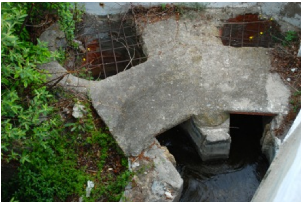
Derrame de acequia en Laujar de Andarax.

los recursos más valioso con que cuenta en el orden turístico y cultural. El éxodo rural y la descapitalización llevan a una situación indeseable, no solo para la zona sino para cotas más bajas incluso costeras, ya que la aridez y la erosión avanzan por las laderas. Los ríos y barrancos ahondan cada vez más sus cauces determinando agrietamientos y derrumbamiento de paredes. Y gargantas. A un nivel más concreto, la racionalidad en el uso del agua, no puede basarse en la construcción de grandes presas y trasvases que exportan el recurso a zonas costeras de agricultura de vanguardia, a cambio de desertificar las cabeceras. De no actuar pronto tendremos sin duda, otro paisaje, el derivado de la desertificación inducida por la falta de manejo o por un manejo inadecuado y tan grandilocuente como ineficaz.”(Rodríguez 2005: 253)