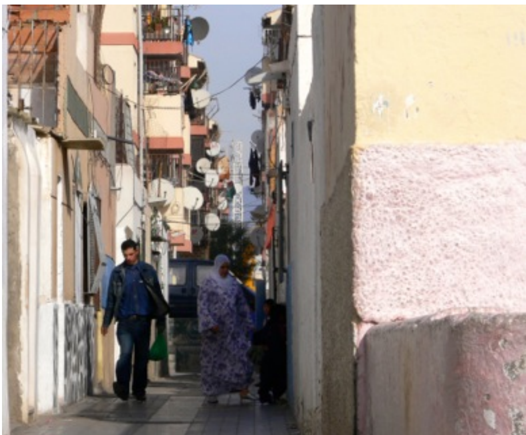
El Puche Centro.

intenta salir del barrio, de esta manera, muchas de las primeras familias allí asentadas en un principio cambiaron de residencia, adquiriendo un inmueble en otro lugar, y dirigiéndose fundamentalmente hacia Los Molinos o Las Quinientas Viviendas, dos barrios de una mejor consideración dentro de la ciudad. Estos primeros habitantes fueron sustituidos, en un primer momento, por familias gitanas, procedentes de otros barrios de la capital almeriense y, fundamentalmente, de familias -gitanas y no gitanas- llegadas de otras provincias. . El progresivo enriquecimiento y desarrollo de la provincia, en general y de la capital en particular, parece no afectar de manera palpable a estos barrios. Espacios del extrarradio , apartados de la vista, de la prosperidad y del desarrollo del resto de la ciudad. Lugares donde la distancia social entre centro y periferia se hace cada vez más profunda. En Almería el extrarradio está perfectamente delimitado por los barrios marginales de El Puche, La Fuentecica, La Chanca-Hoya y Los Almendros, que se configuran alrededor de la ciudad y forman un cordón de desempleo, pobreza y exclusión.