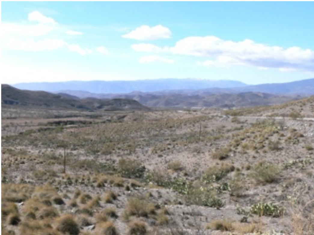
Típico paisaje estepario. Filabres -Tabernas.

Los despoblados enormes, tantos y tan extensos, que para esta región se tiene la impresión a veces de que la geografía rural tiene más por objeto el estudio del baldío, descampado, erial y floresta que el campo cultivado y habitado.