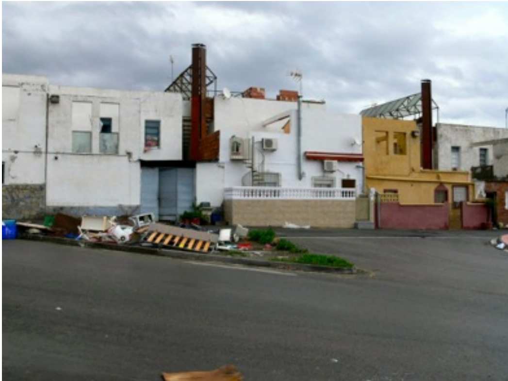
Barrio de Los Almendros.

Todas estas promociones son de carácter público, las promociones privadas son insignificantes, limitándose a la autoconstrucción y reforma de vivienda.