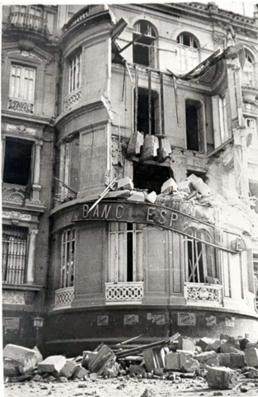
Almería. Guerra Civil. Escenas del bombardeo alemán sufrido por la ciudad durante la mañana del día 31 de Mayo del año 1937

adquiere carácter intensivo durante los años sesenta y setenta del siglo XX". (Quirosa 1997: 68)