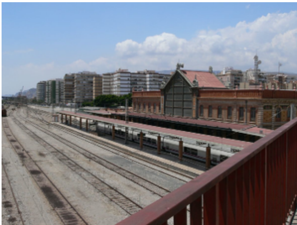
Estación de ferrocarril.