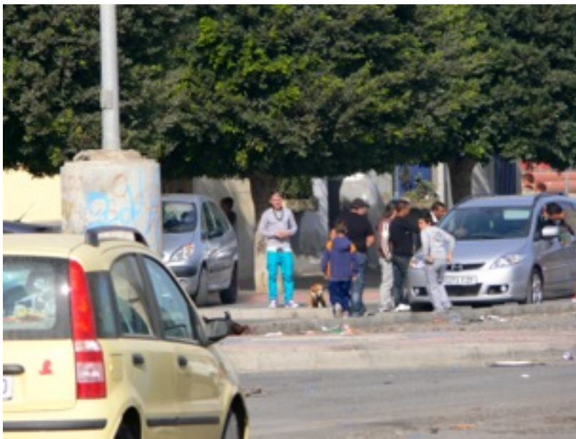
El Puche Norte.

La marginalidad de El Puche está generalmente aceptada por el resto de la ciudadanía de Almería, y por las propias instituciones, que llevan a cabo programas específicos para El Puche como Zona Necesitada de Transformación Social. Muchas veces estas actuaciones se producen sin evaluar unos objetivos, o la propia función de la actuación, sin conseguir unas propuestas concretas de actuación. Sus deficiencias se reducen al plano mas visible: mejora de asfalto, alumbrado, etc., sin ahondar en los problemas y reales necesidades. Infravivienda, falta de empleo y unas condiciones sanitarias peligrosas. Las relaciones institucionales hacia el barrio han sido denominadas de atención descortés , para definir el escaso interés que los políticos a sabiendas de la verdadera situación del barrio demuestran por él. (Checa Olmos 2005) Esta distancia psicológica entre las lógicas institucionales y las de estos grupos e individuos, ha sido tratada como responsable de la desconfianza y desafección política que en su conjunto muestran sus habitantes para con su sistema político. Podemos, hablar de una zona sur en estado de vulnerabilidad ,otra zona, el Puche Centro se enmarcaría en un estado asistencial, y una última Puche Norte en estado de exclusión.