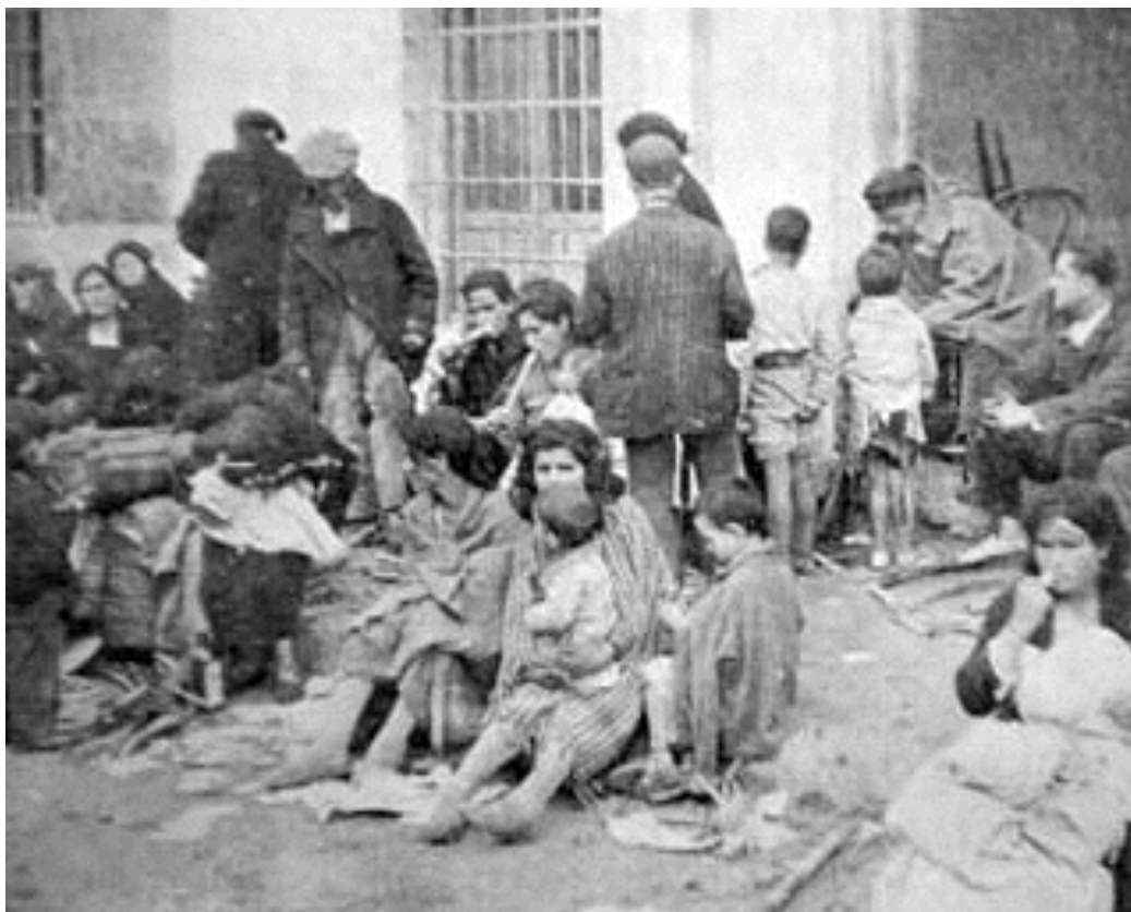
Refugiados .Archivo Diputación provincial.

convertido en un área de preferencia residencial para estratos sociales medios debido a que presenta unas condiciones bastante atractivas (Buenas comunicaciones con el centro, zonas de esparcimiento, magníficas vistas...)