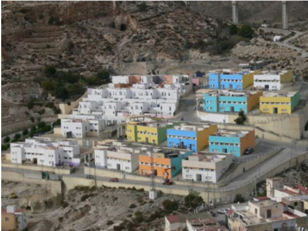
Nuevas edificaciones en el barrio de La Chanca.