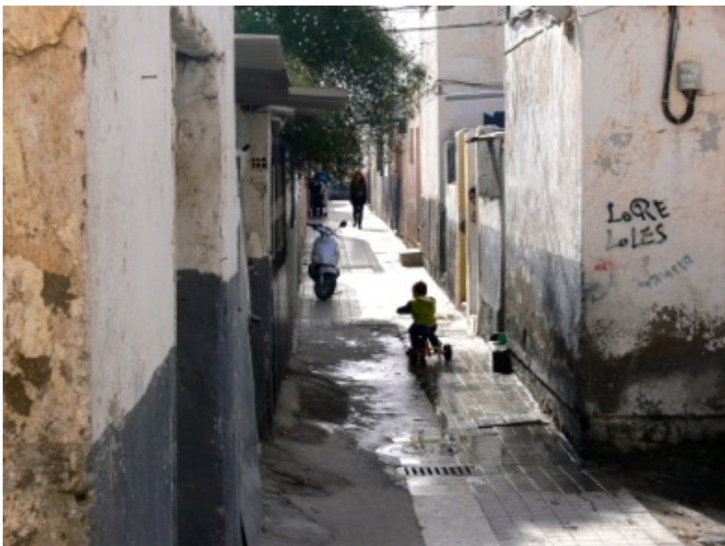
El Puche Centro.

Este reciente barrio fue levantado para albergar a los afectados por las lluvias torrenciales que se precipitaron sobre la capital almeriense a lo largo de los primeros días de enero de 1970. Tras las torrenciales precipitaciones lluviosas llegaron a contabilizarse un total de 453 viviendas y cuevas derruidas, declarándose en ruina total 2.118 casas y chabolas. Como consecuencia de ello, unas mil personas de los barrios más humildes afectados de la ciudad: Barrio Alto, Cuevas de El Puche, Hoyo de las tres Marías, Chamberí, Cuevas de San Joaquín, San