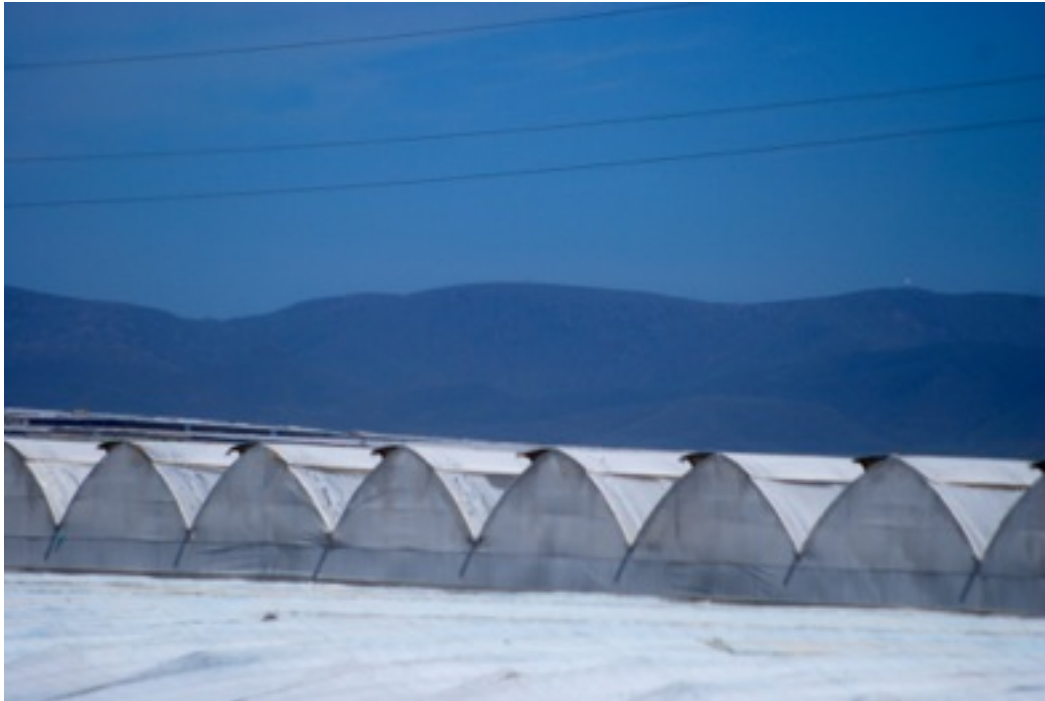
Invernaderos con sistemas de ventilación. Nijar.