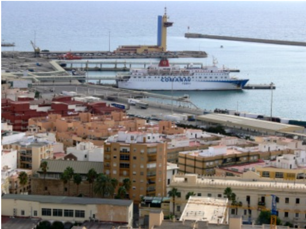
El Puerto visto desde La Alcazaba.