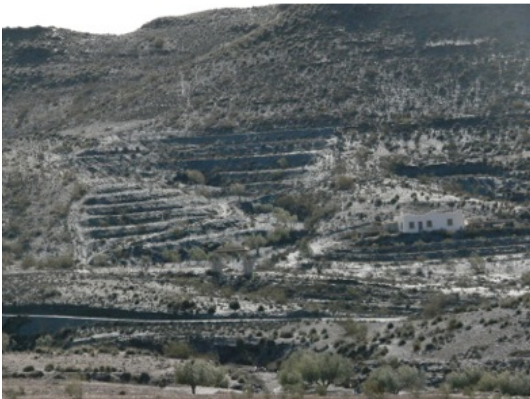
Cortijo en Tabernas

El paisaje queda neutralizado por una mentalidad que desecha el cultivo de alta y media montaña, por una desconocimiento tanto del trabajo hortícola de regadío como de las complicadas técnicas hidráulicas necesarias para su abastecimiento.