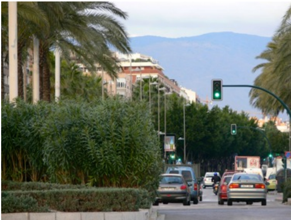
Alrededores del Puerto Marítimo.

La modernización de las instalaciones portuarias que se viene efectuando, no le ha restado aún el encanto que los muelles han venido teniendo en los últimos años. Sigue siendo una zona tranquila, sin excesivos trajines comerciales y una de las más bellas de la capital, flanqueada por los jardines del parque, el Paseo Marítimo y la avenida construida sobre el antiguo cauce de la Rambla.