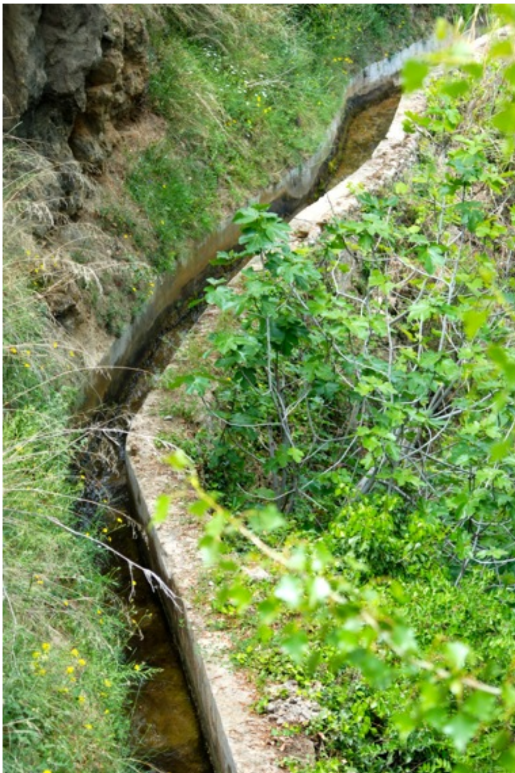
Acequia de altura en Laujar de Andarax.

que limitan, prohíben y sancionan los usos que las comunidades campesinas vienen haciendo en sus montañas.