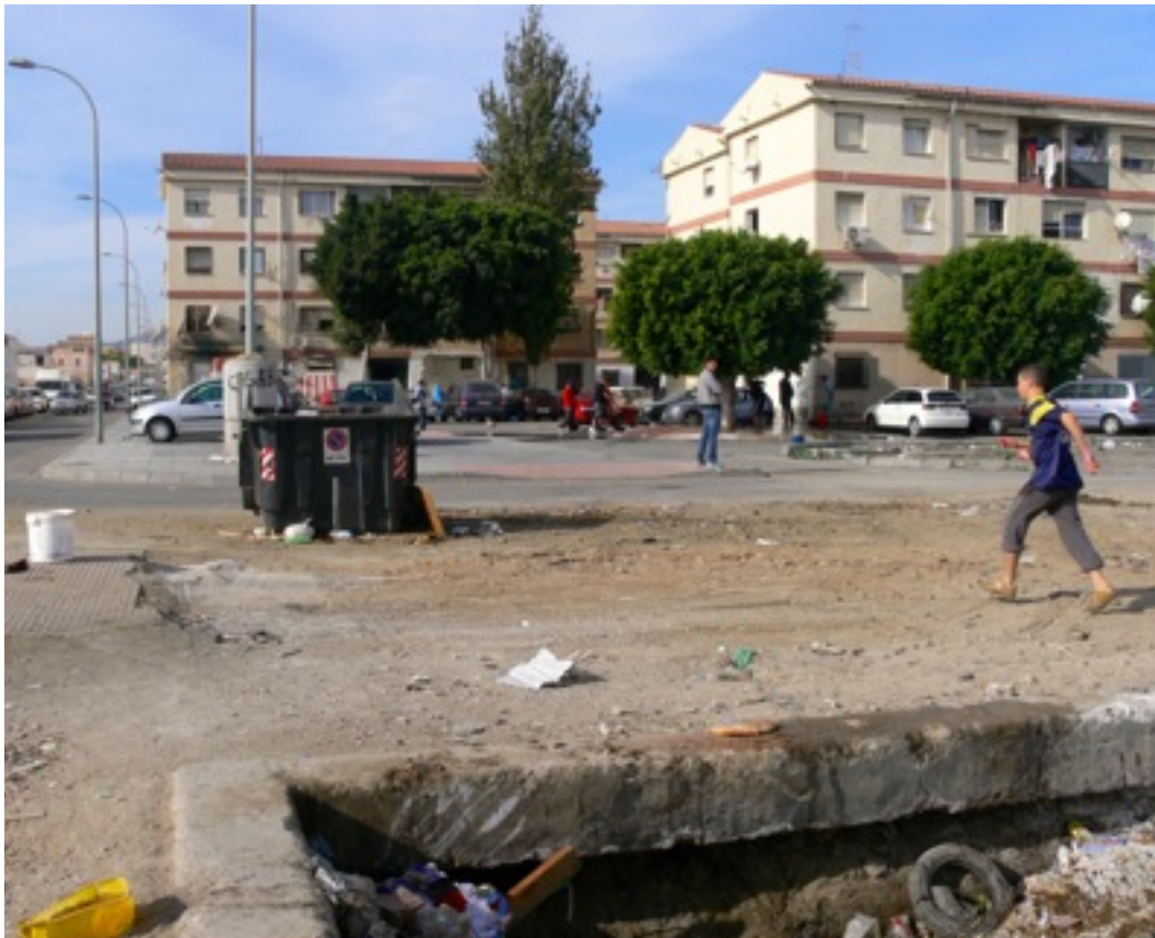
El Puche Norte.

Desde el exterior se tiende Para simplificar suele considerarse en barrio en su conjunto y de forma homogénea, más la realidad es otra un tanto diferente: El conjunto se divide en tres zonas fundamentalmente: la Zona Norte está habitada casi en su totalidad por población de etnia gitana e inmigrantes magrebies. Se trata de la más deteriorada de ellas Los bloques de cuatro plantas sin ascensor fueron receptores de habitantes que estaba acostumbrados a vivir en casas y a las relaciones sociales al aire libre , dificultando al principio la integración de sus habitantes.