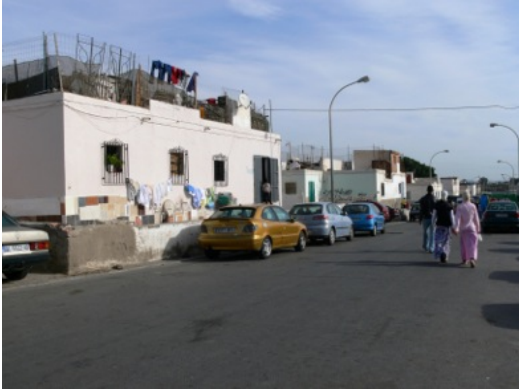
El Puche centro. Calle Sevillanas.

En El Puche Centro las viviendas son de tipo unifamiliar, de planta baja, concentradas en dos rectángulos a ambos lados de la calle Sevillanas, perpendicular al río, y separadas entre sí por calles peatonales muy estrechas, formando un entramado reticular de tránsito con escaso espacio vital.