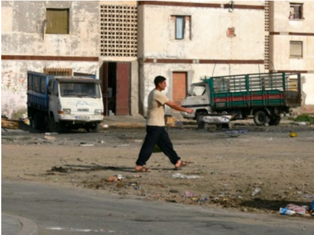
Barrio periférico El Puche Norte.

Como son Barrio Alto Y Los Almendros. En La Barriada de la Chanca adquiere la infravivienda su más alto nivel en el hacinamiento dado que en la generalidad, la media de la superficie destinada para vivienda está por debajo del límite establecido.