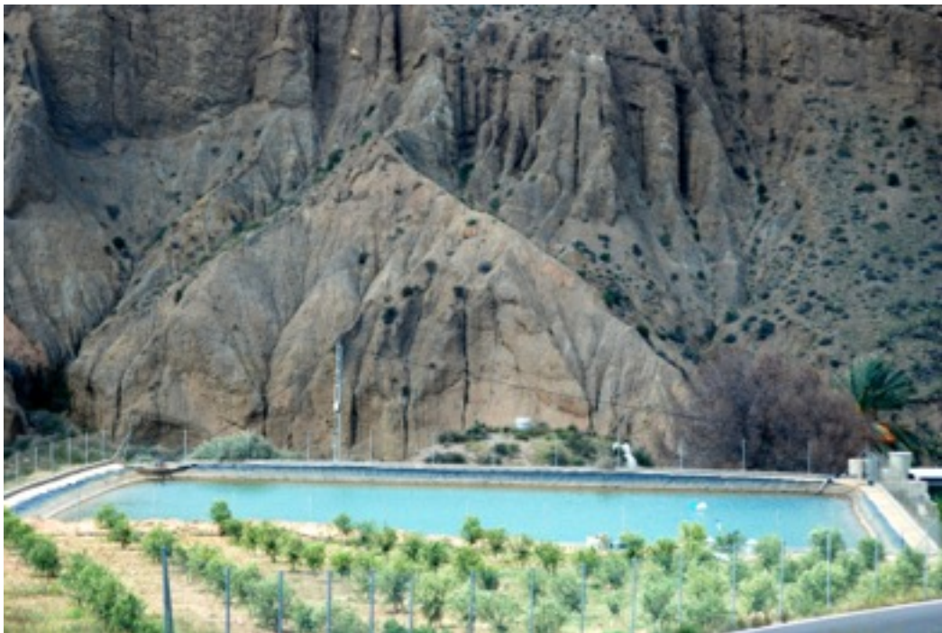
Pantaneja en Gador.

Más en general, esta escasez de agua al mismo tiempo que revaloriza el valor de ésta, determina unas posibilidades de explotación del terreno, mucho más pequeña. El minifundio almeriense, estructura agraria heredada de la época morisca, viene determinada por el clima. El minifundio es una adaptación del paisaje a las posibilidades de explotación y rendimiento. De esta manera que cada espacio por su propia ordenación, orografía...da pie a un determinado sistema de producción. “La aridez explica la mayor parte de los problemas que ha de tener el hombre almeriense para la creación de paisajes agrarios”. (Martín Galindo 1988: 35). Aridez y minifundio, dotan a este paisaje de una propia personalidad.