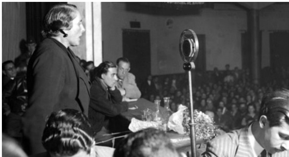
Ilustración 2: Célebre discurso de Dolores Ibárruri "La Pasionaria" de despedida a los voluntarios de las Brigadas internacionales, pronunciado el 1 de noviembre de 1938.