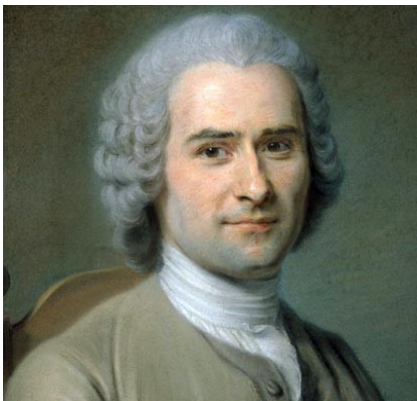
Ilustración 2: Jean Jacques Rousseau

Jean Jacques Rousseau (1712-1778), es el creador de la corriente naturalista