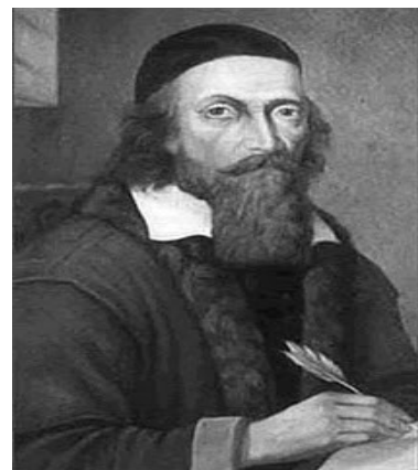
Ilustración 1: Comenio, pedagogo humanista y filósofo checo

Juan Amós Comenio (1592-1670), tuvo gran relevancia en el cambio que se desarrolló en la Educación en el siglo XVII. Con su obra “ Didáctica Magna ”, publicada en 1657, introduce el concepto del alumno como centro del proceso de aprendizaje (Paidocentrismo), además de dar la importancia a la educación de pacificadora, planteando que la educación es la base para el entendimiento de los pueblos.