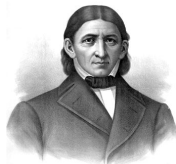
Ilustración 3: Friederich W.A. Fröbel.

Friederich W.A. Fröbel (1782-1852), su pedagogía de basa en el principio de la unidad, considerando que la vida es la unión entre lo espiritual y lo terrenal. Otros de los principios de su teoría es la ley de transformación, equilibrio y armonía en la naturaleza, entendiendo la Educación como algo dinámico y progresivo. También estudia y da forma a la ley esférica, al principio de la actividad espontánea creadora, resalta a la naturaleza como mejor medio de aprendizaje, refuerza el paidocentrismo, la capacidad de