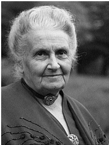
Ilustración 4: Maria Montessori

María Montessori (1870-1952) una de las primeras mujeres en ingresar en la Universidad en esa época, se doctoró en Medicina y llegó a ser una de las pedagogas