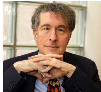
Ilustración 6: Howard Gardner

Howard Gardner (1943- actualidad) este psicólogo abre la perspectiva de la educación a otros horizontes, creando el concepto de las inteligencias múltiples . Su teoría hace referencia a ocho inteligencias, explicando que a cada niño se le debe reforzar según su tipo de inteligencias y sus capacidades.