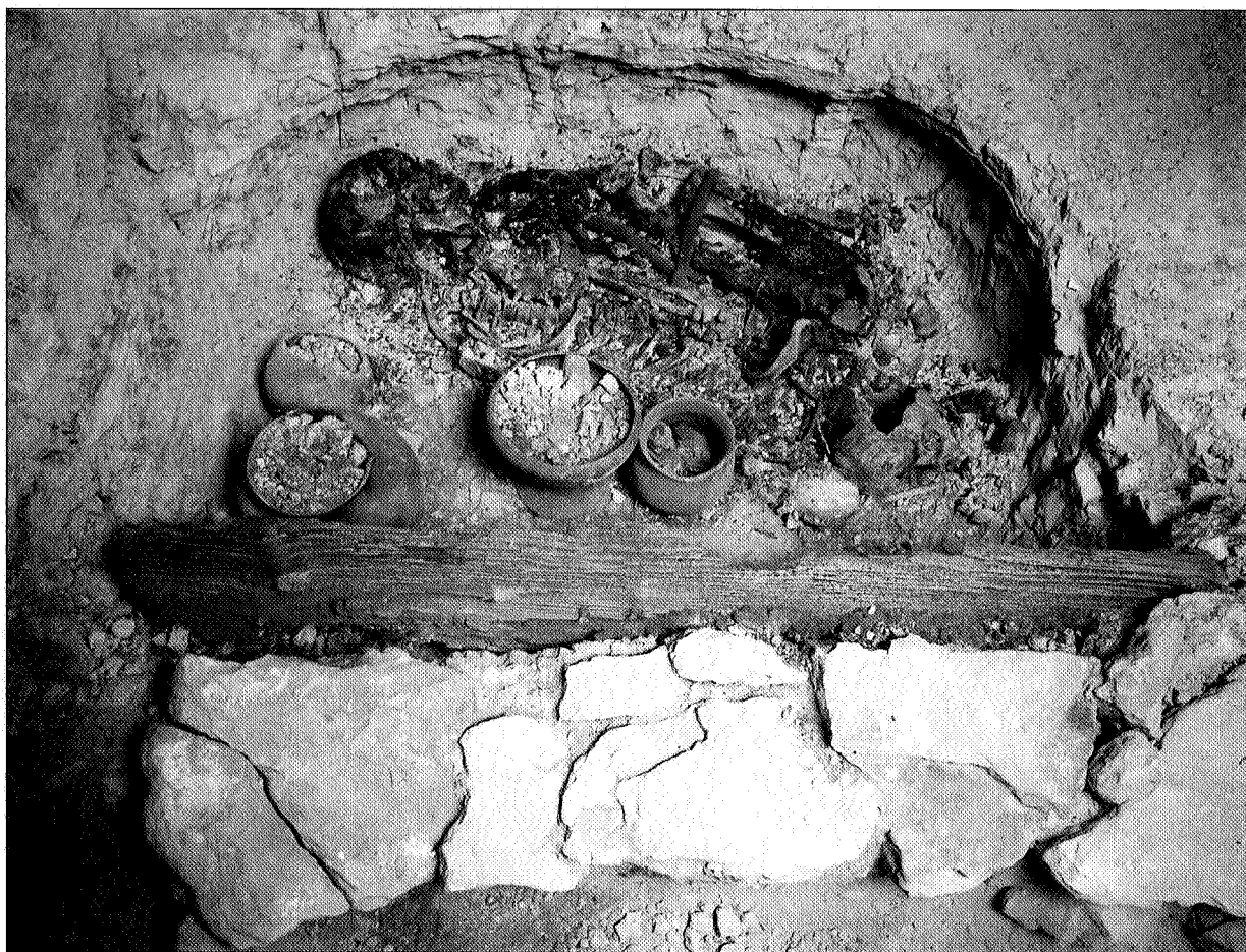
Lám. III. Vista general de la sepultura 121.

recogida de aguas y la excavación de una sepultura con un importante ajuar con espada y alabarda en esta zona, hacen que se defina una «acrópolis» perfectamente delimitada y diferenciada, donde viven la élites del poblado, siguiendo un modelo ya clásico en el área almeriense de la Cultura de El Argar. Asimismo, en la terraza intermedia se han definido los primeros niveles de ocupación del poblado, así como la planta de varias casas en el sector oriental, delimitadas por construcciones de envergadura. En este mismo sector se han excavado nuevas sepulturas, que nos ayudarán, tras su análisis y estudio, a definir las relaciones familiares y organización social en las diversas áreas del asentamiento. En la terraza inferior se ha definido un nivel de aterramiento delimitado por el corte de la roca natural y muros de mampostería en sus extremos. En dicha terraza se han documentado los restos de una vivienda con estructuras de molienda, banco, almacenamiento y abundantes restos orgánicos. Dentro