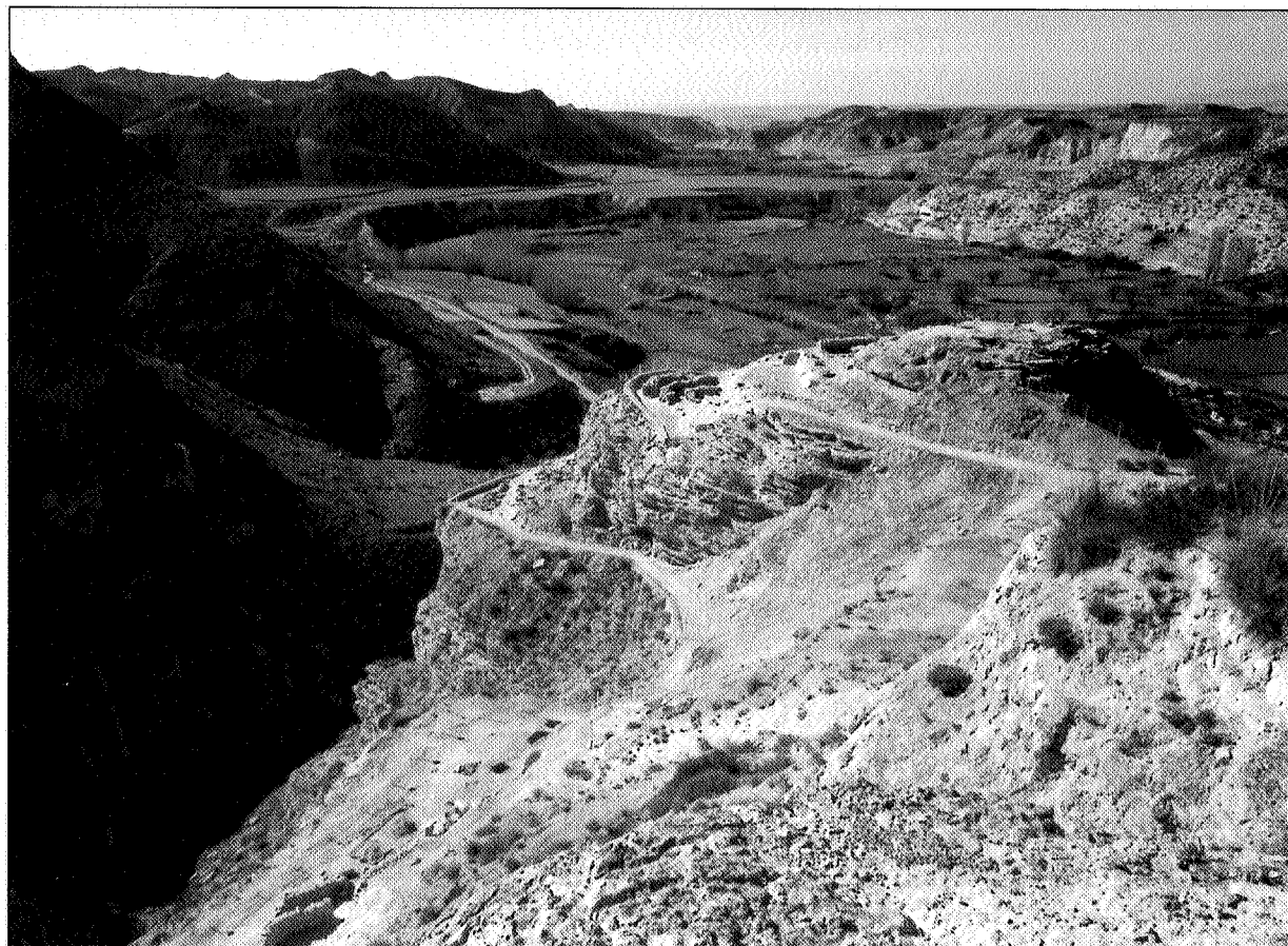
Lám. I. Vista del Castellón Alto desde el noreste, dominando la vega del Río Castilléjar.