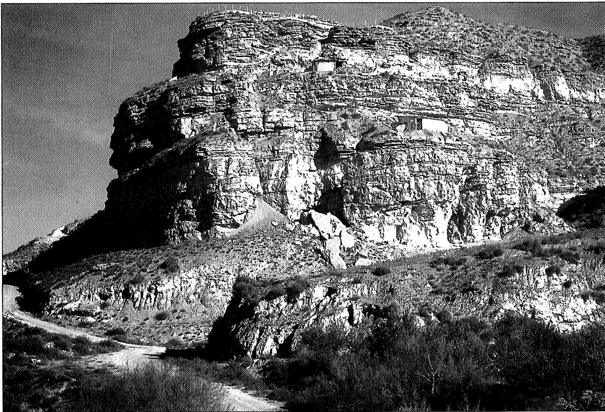
Lám. II. Vista del Castellón Alto desde el valle. Puede observarse en la terraza inferior la caseta levantada sobre la sepultura 121.

dera intermedia y la musealización de dos sepulturas en la ladera oriental. Las intervenciones de excavación y restauración han continuado en el 2001 y 2002 con el objetivo de poner en valor el yacimiento y abrirlo al público para su visita. Estos últimos trabajos han sido dirigidos por Fernando Molina, Catedrático de Prehistoria de la Universidad de Granada, y M a Oliva Rodríguez-Ariza, Profesora de Prehistoria de la Universidad de Jaén.