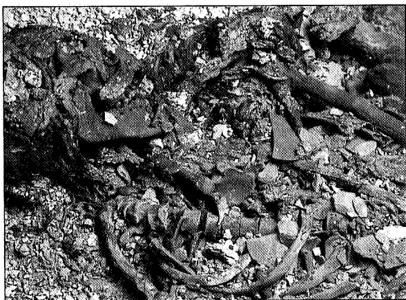
Lám. IV. Sepultura 121. Detalle del individuo adulto con la cabeza, pelo y hacha de cobre.

decúbito lateral izquierdo, con las piernas y brazos fuertemente flexionadas sobre el pecho. Era un hombre de 1,60 m. de altura que tenía entre 27 y 29 años cuando murió. Físicamente ofrece mediana robustez, con las inserciones musculares poco marcadas y tiene algunas señales que indican que realizó en vida duros trabajos.