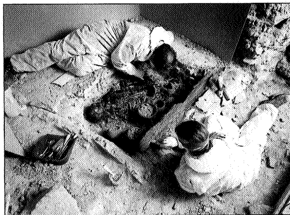
Lám. V. Trabajos de consolidación de los restos de la sepultura 121 antes de su extracción.

En la parte anterior derecha de la sepultura aparecen restos de un niño parcialmente articulado, en posición secundaria. La conexión anatómica de segmentos vertebrales y algún miembro superior indican que el niño no estaba esquelizado en su totalidad, sino parcialmente momificado cuando se extrajo de su sepultura original y se depositó junto al adulto. También conserva restos de partes blandas y de pelo oscuro, corto y peinado hacia delante para formar en la frente un flequillo. Se han encontrado restos de un posible gorro de lana tejida