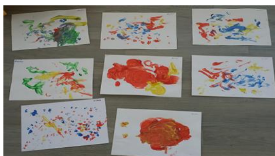
Sánchez. M (2014). Creatividad libre. Serie muestra de 4 fotos de los dibujos realizados por niños/as de 2-3 años de Educación Infantil.