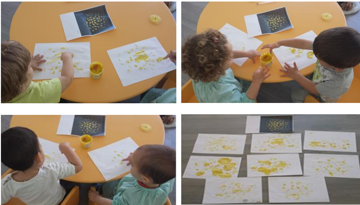
Sánchez. M (2014). Interpretamos. Serie muestra de 4 fotos de los dibujos realizados por niños/as de 2-3 años de Educación Infantil.