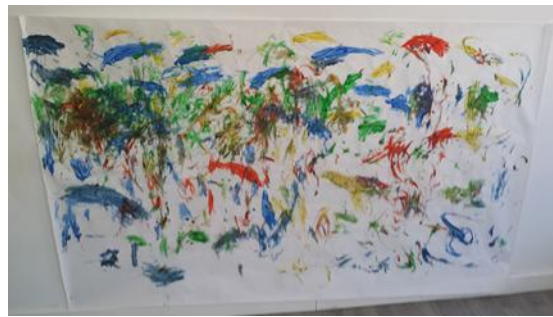
Sánchez. M (2014). Obra colectiva. Serie muestra de 4 fotos de los dibujos realizados por niños/as de 2-3 años de Educación Infantil