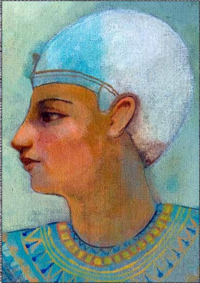
Asunción Jódar (2011) Figura, lotos y peces . Óleo, acuarela y acrílico sobre lino, 100 x 50 cm. Colección particular, Granada.