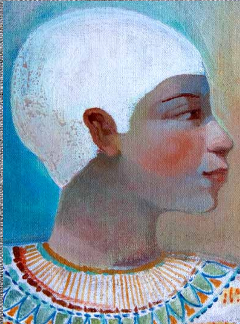
(arriba izquierda) Figura femenina de la tumba de Nebamun (c. 1.350 a.C.), detalle. Museo Británico, Londres.