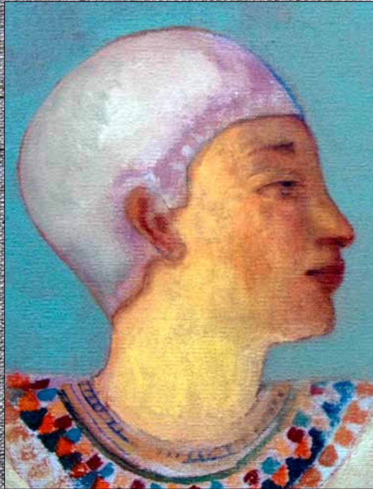
(arriba izquierda) Sarcófago antropomorfo de Pef-tjau-ay-aset (Dinastía XXVI) detalle. Madera estucada y pintada. Museo Egipcio de Milán.