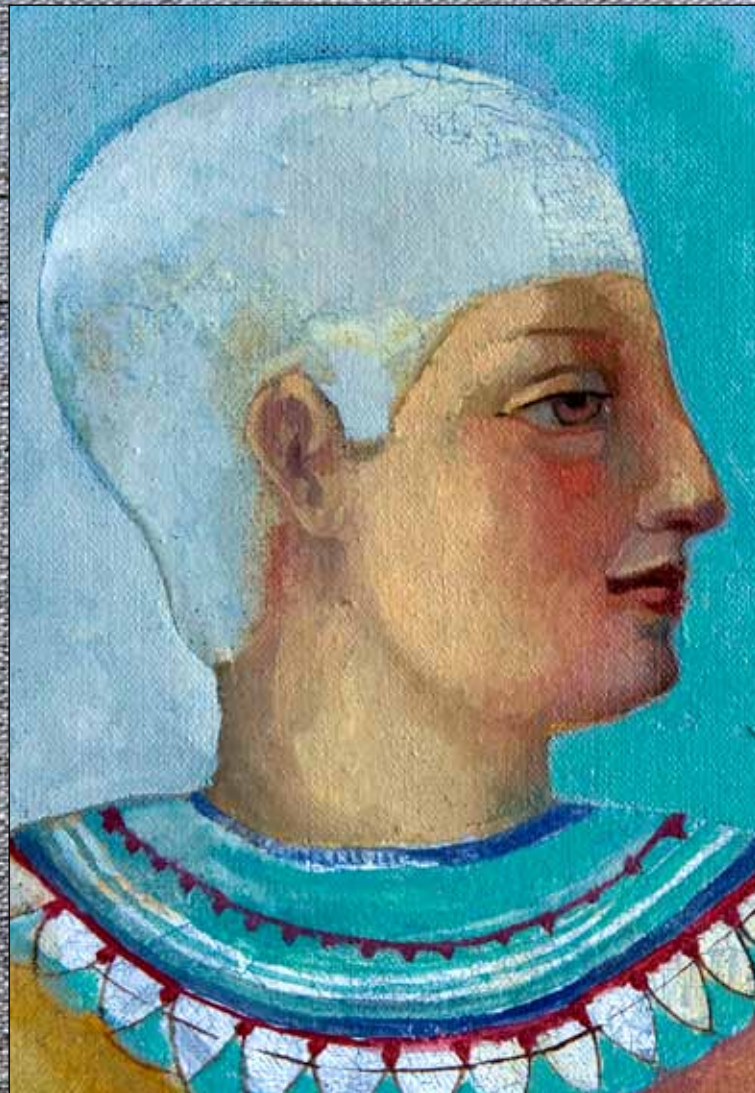
Asunción Jodar (2011) Figura, gato y loto . Óleo, acuarela y acrílico sobre lino. 100 x 50 cm. Colección particular, Granada