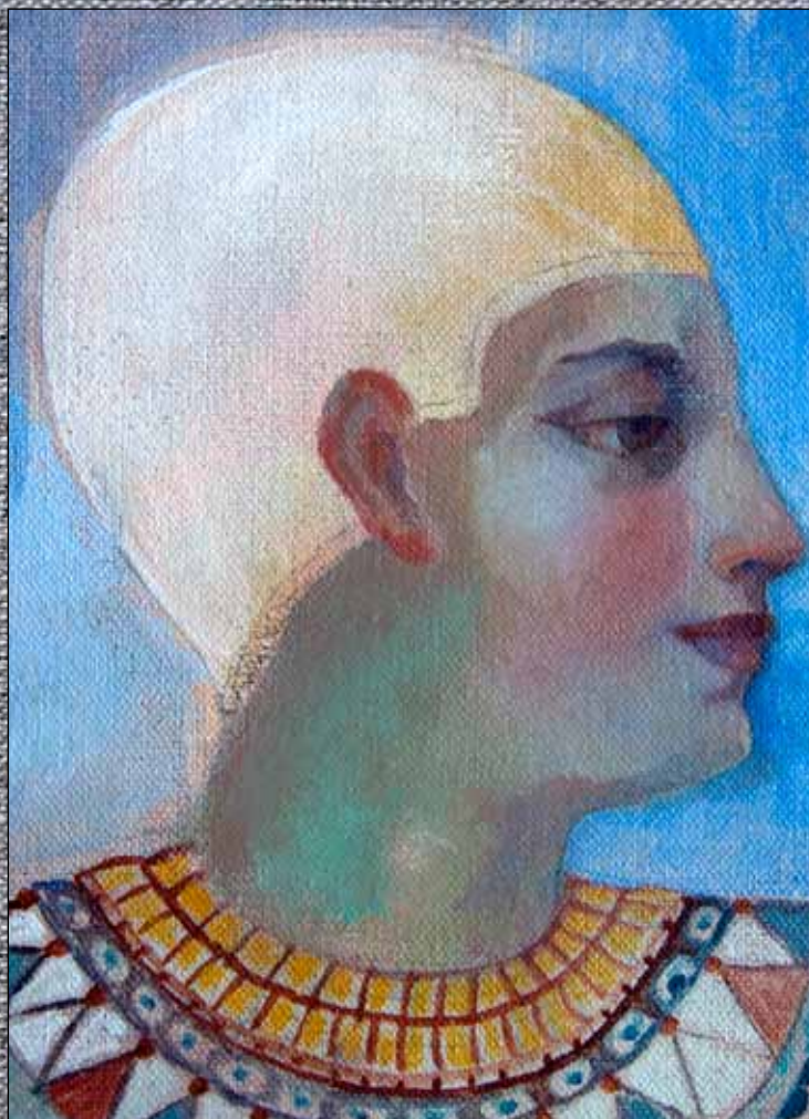
(arriba izquierda) El príncipe Sethherkhepeshef, hijo de Ramsés III (1.186-1.070 a.C.) detalle. Dibujo sobre piedra calcárea. Museo Egipcio de Turín.