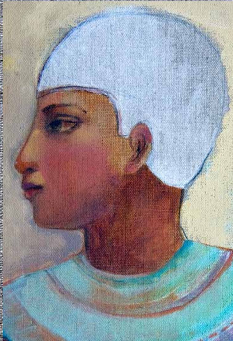
Asunción Jódar (2011) Figura, garza y seis patos . Óleo, acuarela y acrílico sobre lino. 100 x 50 cm. Colección particular, Granada