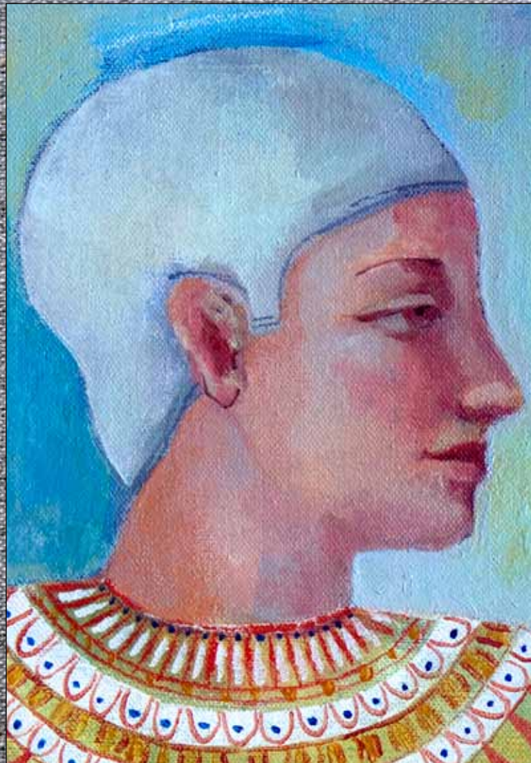
Asunción Jódar (2011) Figura, pájaro y foto. Óleo, acuarela y acrílico sobre lino. 100 x 50 cm. Colección particular, Granada.