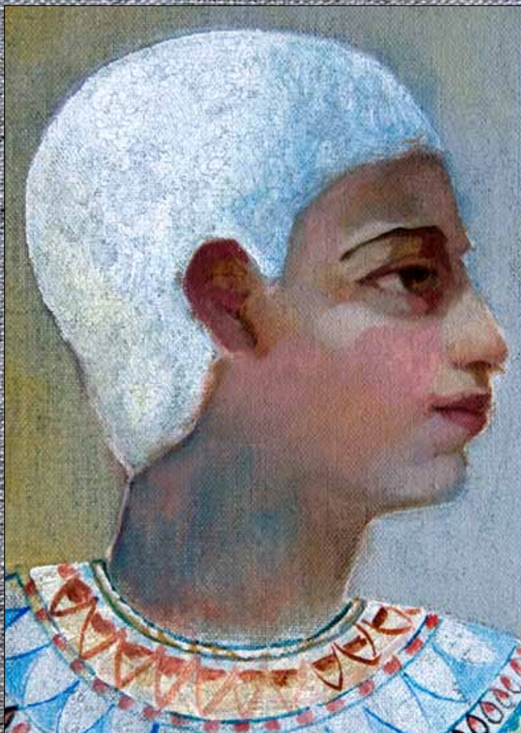
(arriba izquierda) Tumba de Roy, dinastía XXVIII, detalle.

Asunción Jódar (2011) Figura, barca, garza y gato Óleo, acuarela y acrílico sobre lino. 100 x 50 cm. Colección particular, Granada