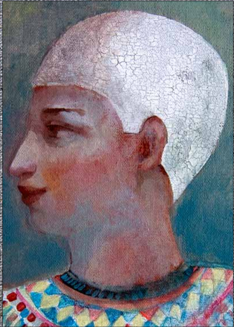
Asunción Jódar (2011) Figura y tres aves . Óleo, acuarela y acrílico sobre lino. 100 x 50 cm. Colección particular, Granada.