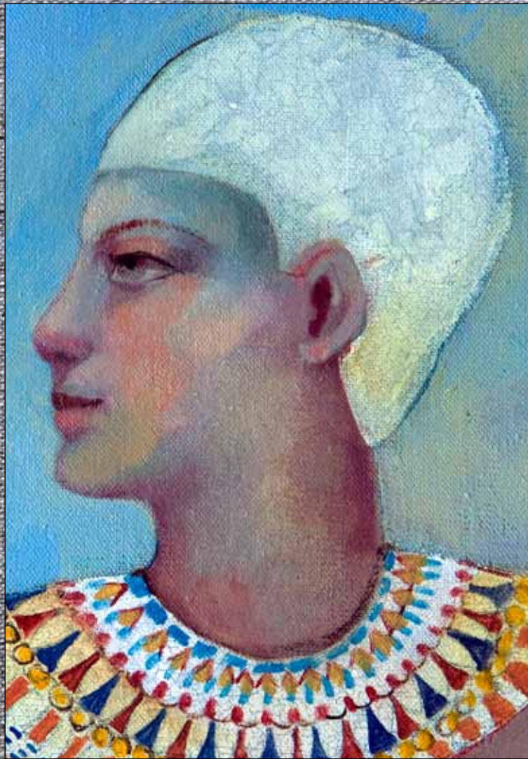
Asunción Jódar (2011) Figura, pájaro, foto y pato . Óleo, acuarela y acrílico sobre lino. 100 x 50 cm. Colección particular, Granada.