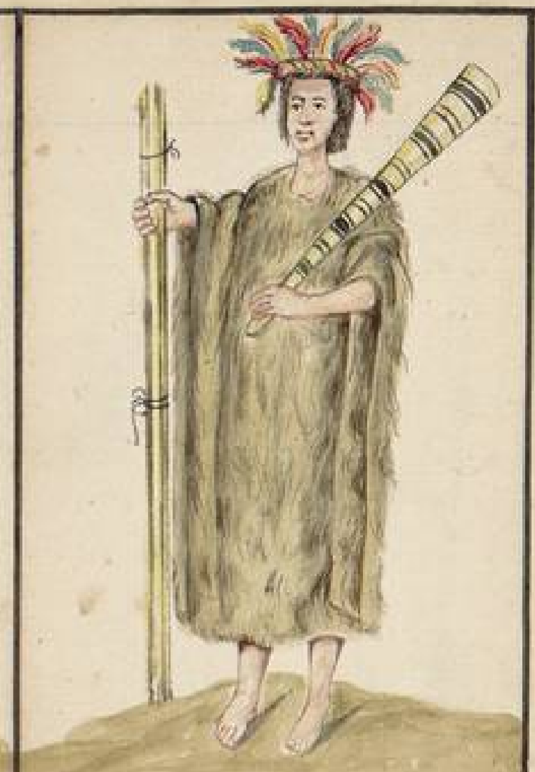
Indio Sipico, habita las Riberas del Napo: se encuentran en esta Nacion muchos blancos y Mujeres hermosas: segun el Padre Giral: se infiere que sean prisioneros Carapachos: Estos sipicos son heridos por Nigromanticos, o nigromas entre aquellas Naciones: los respetan estas: adornanse con vistosos y hermosos Plumages: haciendo estibar en esto: y en la Masana armoniosa mente pintada su cuerpo de medio cuerpo arriba: andan desnudos.