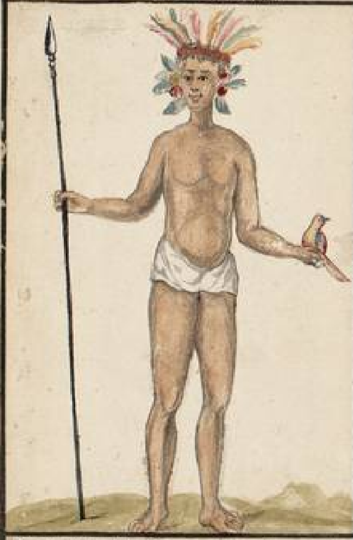
Indio Turi del Rio Titumayo: todo su luxo estriba en el adorno de su cabeza: y es muy solido en Casar: las Aves que visten las mas brillantes y armoniosas Plumages: Son muy diestros en la composicion de los Venenos: Su fortaleza y actividad se pruevan en el Casar del Sol: e en otros ritos de los Indios: e en otros ritos de guerra: aunque vicia por su quietud por sus enemigos: por la guerra: y usan de la Solgama.