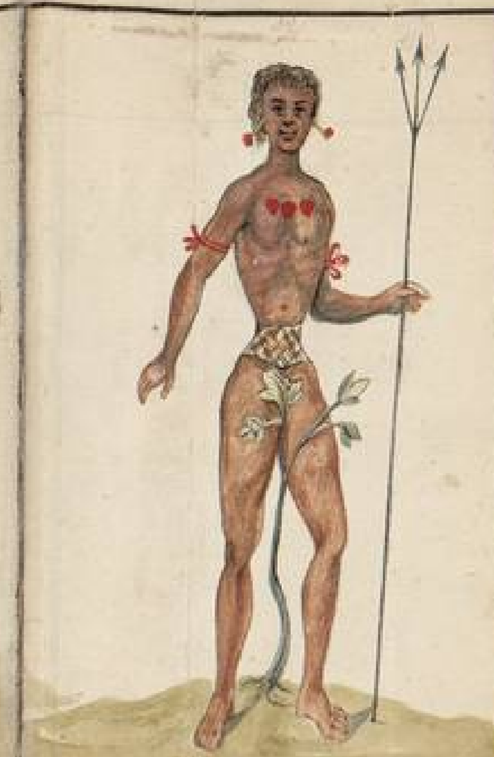
Indio Guagua o Maguare, habita las Riberas del Napo: es antropofago y cuelgan al pecho los conejos de los que matan en la Campaña: Saben la Curia humana para curar las enfermedades: son cruentes: pero en ciertas ocasiones buelven a su patria rudo: segun el Padre Giral que ha dado es las Noticias: son los hombres mas ligeros que conoce el mundo: y han de contribuir la curia de su curia tan ligada quanto no se creeble: si muy temida esta Nacion por su crueldad en el ejercicio de su oficio.