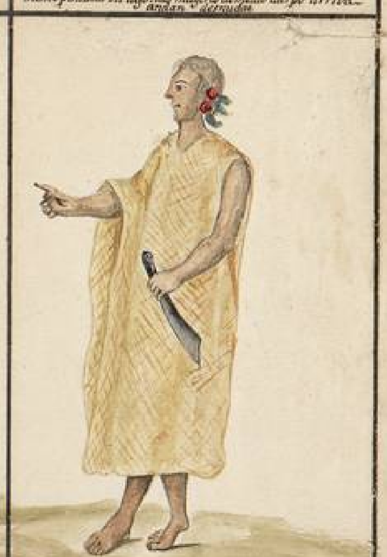
Capanaquas: Viven en las Riberas del Rio estagan colateral del Mucuro: ellos asan y comen a sus difuntos pensando hacerles obsequio: Sepultandolos en su vientre: Son diferentes Tribus bajo del mismo nombre: Sus casas son muy grandes: ocupando dos quadras de largo y una de ancho: y como se dijo de los Chumichis: viven muchas familias dentro de cada una: aunque con separacion.