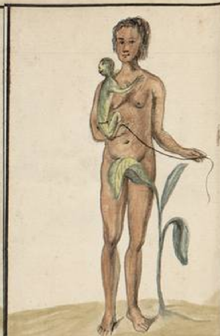
India sola desnuda de los Omaguas que vive en el Rio Napo colateral del Marañon: e Amazonas: tiene su oficio en saber pintar: usan los hombres de vistosos plumages: su idioma es de una quinzona estraña: a algunas Republicas o Pueblos de esta Tribu se ha inscrito el oficio y prodigalidad del cavallero Comandante de Marañon: se afirma en hacer Visocho de Luas braba: con lo que se dilatan en sus Navegaciones y ha hido desde a todo algunas Tribus.