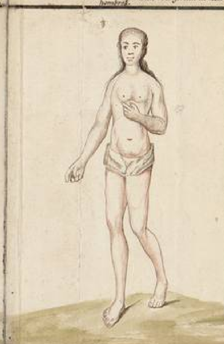
Carapachos, antropofagos que habitan el Rio Tadiña: son muy blancos que los Espanoles y poblados de barbudas mujeres: y otros venen andan desnudos con solo su Pamparilla: son de hermosas facciones y se rapan media cabeza: despues de haber hecho posesion con el Gijil al Pico de su concurrencia le mataron a tra con un hachete: hiriendo a tra. Lamarravilla de color blanco: las distingue de todas las demas Naciones que se ven en el punto reservado a profundos conocimientos.