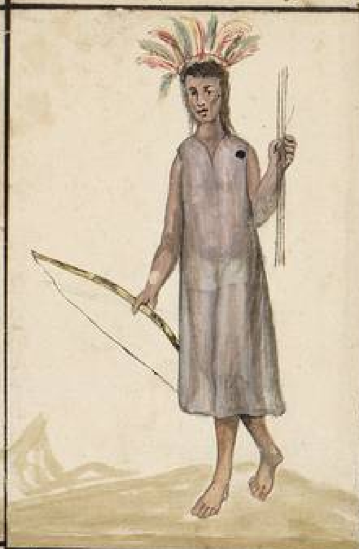
Chipicos, en el Rio Napo colateral del Napo: Esta evacion tiene algunos blancos como los Sipicos: distan un tien de leguas de las Riberas Carapachos: Son muy numerosas esta evacion: y algunos Pueblos se miran reducidos: Son muy racionales: y doculentos segun afirma el Reverendo Padre Misionero de diez años en el Padre Giral de Barceles: Se ponen en ruta para tratar de la paz: o de la guerra.