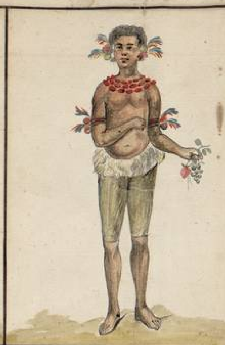
Indio Camachiro que vive cerca de la Boca del mismo Rio Napo: usa del presente traje: Esta Tribu es muy diestra en el uso de la Cerbatana y Flecha: e inclinada a la pesca de que principalmente subsiste: habitan como otras muchas Naciones diferentes Familias en una sola Casa que suele ser de dos o tres con sus divisiones: suele ser una especie de Telar que no tienen mas Ventanas para luz que la que le entra por el hueco de la puerta.