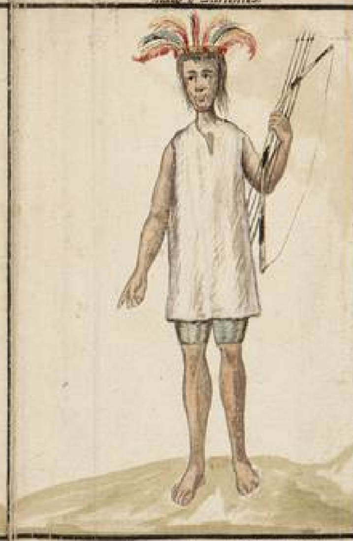
Evacion de los Casibos en las Riberas del Rio Tadiña: que recibe las aguas del famoso Mucuro: son entre los Indios enemigos de todas las Naciones de la Campaña del Sacramento: No tienen mas ejercicio ni mas gloria que la de matar gente de que se alimentan: igualmente que de Lenaxo: el pelo de las que asesinan: lo llevan siempre colgando de las flechas en señal de triunfo: tienen poblaciones fijas donde asistan.