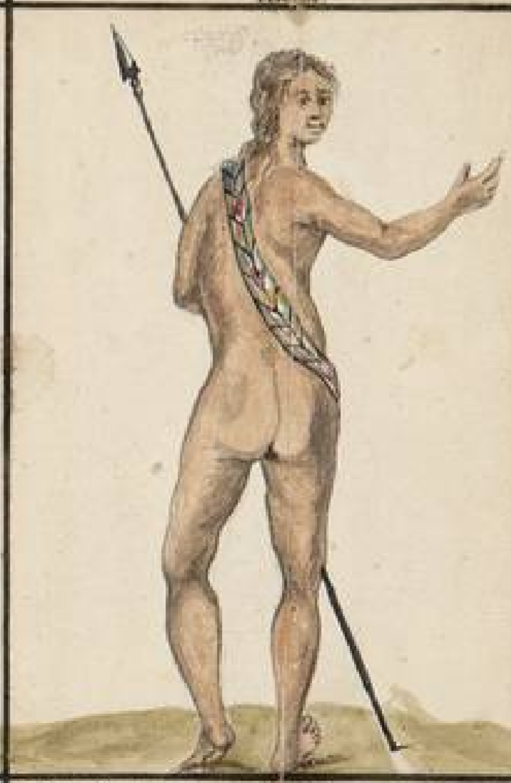
Indio Lquito totalmente desnudo menos la Faja: e de una de hermosisimo plumage: habita las Riberas del Rio Napo: Su arma comun es la lanza: Son muy adictos a la Chicha especie de Cerbeza: la fermentan con los cogollos del Arbol Diabla huasca: que les embriaga: y llena de ideas festivas su cerebro como el Opio a los Asiaticos: Tienen sus Brazos en grande veneracion.