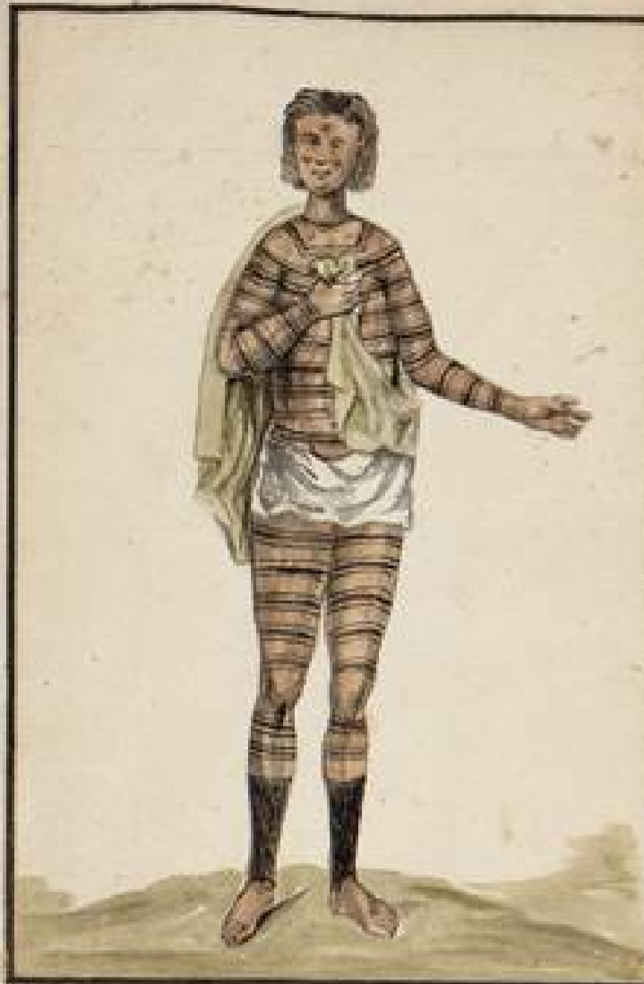
Indias pintadas que habitan las Riberas del Rio Napo colateral de el de las Amazonas. Usan de Pamparilla y Manta al Ombro: se de inferior - q' a este caudaloso Rio el mayor que conoce el mundo le hubieren dado este nombre los primeros Espanoles de la Conquista. al ver estas Mujeres solas y gloriosas a quienes los hombres dejan en otras ocurrencias del año para ir a la Casa de su parentesco quando se van a aquellas y vienen entonces con ropa de Malla.