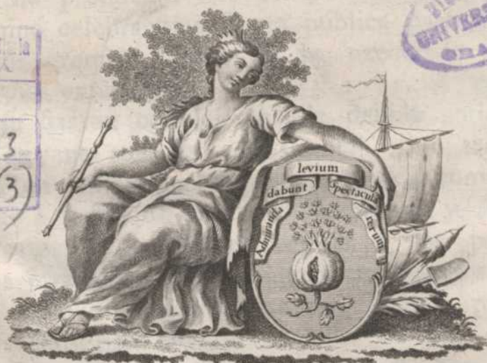
Grabado en Madrid por D. J. B. G.

MADRID MDCCLXXXIII. POR D. JOACHÍN IBARRA, IMPRESOR DE CÁMARA DE S. M. CON LAS LICENCIAS NECESARIAS.