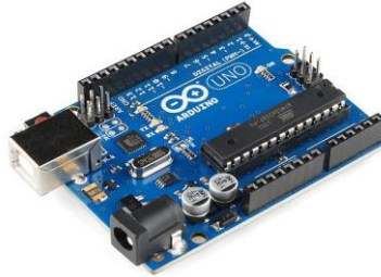
Figura 4. Microcontrolador Arduino Uno

microcontrolador en la placa Arduino se programa mediante un lenguaje de programación y un entorno de desarrollo propio de fácil aprendizaje. Debido a su naturaleza como plataforma de código abierto y hardware libre, así como de su aplicabilidad inmediata para proyectos sencillos, resulta un apoyo ideal para la docencia práctica en la asignatura “Periféricos y Dispositivos de Interfaz Humana”.