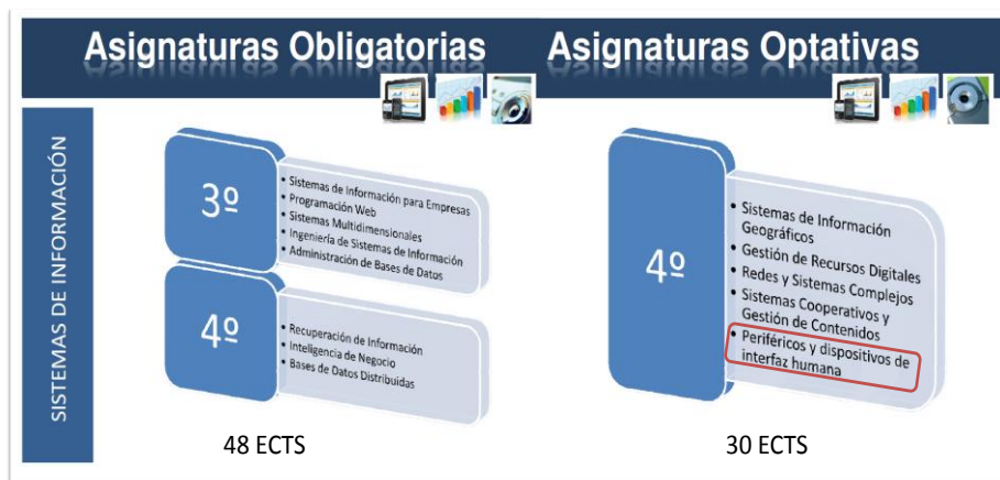
Figura 2. Oferta de asignaturas obligatorias y optativas para la Especialidad Sistemas de Información dentro del Grado en Ingeniería Informática.

La oferta de optatividad en el módulo “Complementos de Sistemas de Información” incluye asimismo las siguientes asignaturas: “Sistemas de Información Geográficos”, “Gestión de Recursos Digitales”, “Sistemas cooperativos y Gestión de Contenidos” y “Redes y sistemas complejos” (ver Figura 2, derecha).