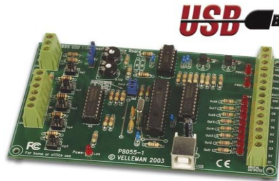
Figura 5. Tarjeta de interfaz USB de experimentación “Velleman” VM110N

Las tarjetas de interfaz USB de experimentación “Velleman” (Figura 5. ) por su parte complementan a las anteriores “Arduino” permitiendo un estilo de programación de más alto nivel, permitiendo crear aplicaciones gráficas que realizan pequeñas interacciones con el entorno como control de motores, relés, sensores de temperatura, presión, etc. Además, de esta forma los estudiantes experimentan y contrastan con el uso de entornos diferentes para la programación y manejo de microcontroladores, obteniendo una visión mucho más amplia y motivadora del uso de los dispositivos periféricos que la que obtendrían con el uso exclusivo de los periféricos clásicos de un computador (teclado, ratón, pantalla, etc.).