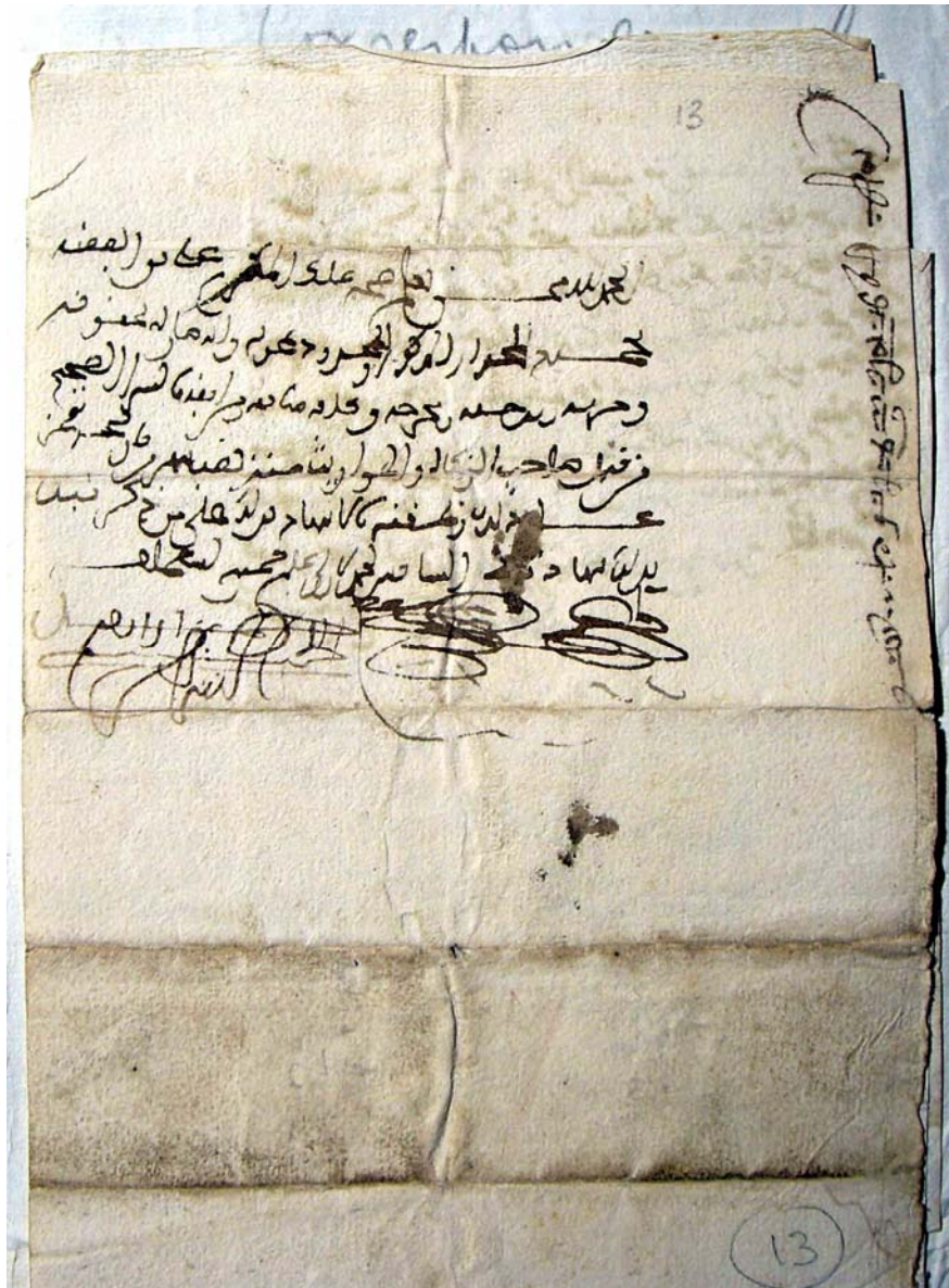
Foto 1: Archivo de la Catedral de Granada. Legajo 546-6. Documento nº 10ª