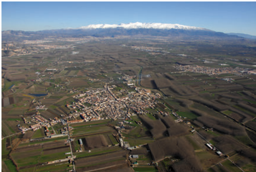
Figura 01. Vista de la Vega y Sierra Nevada.

También se han elaborado mapas de elementos de identidad, denominadores comunes en los que pueden registrarse experiencias existentes o pasadas. Son dispositivos o lugares donde la gente puede reconocerse. Los elementos destacados son objetos de apoyo para el proyecto, y son planteados como narrativos, porque dan sentido y valor a un conjunto de elementos; como enlaces, porque se constituyen como estructuras activas entre los lugares, y como signos, porque concentran e irradian un significado particular que puede ser fijado en la memoria y el lugar. Pueden ser entendidos como travesías de toma de conciencia con el territorio.