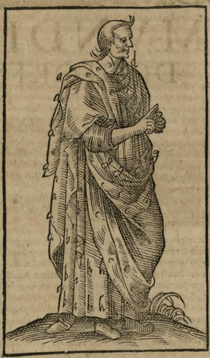
Icon Senatoris togati.

A R V G A in tiliarum formam, hoc est, in longum diducta & extensa.